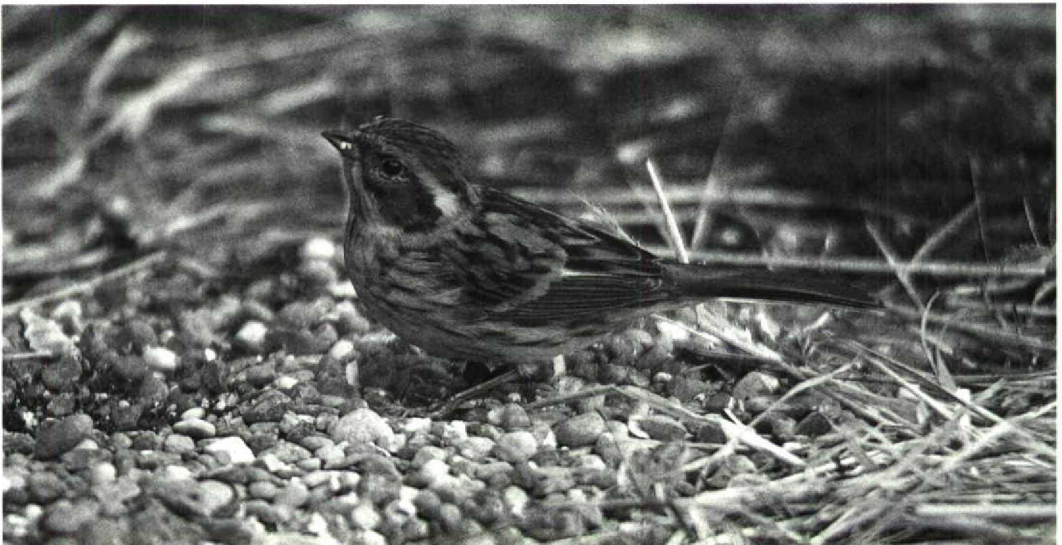
57 Yellow-throated Bunting Emberiza elegans , female in captivity, Britain, November 1991

Colin Bradshaw, 9 Tynemouth Place, North Shields, Tyne and Wear NE30 4BJ, UK