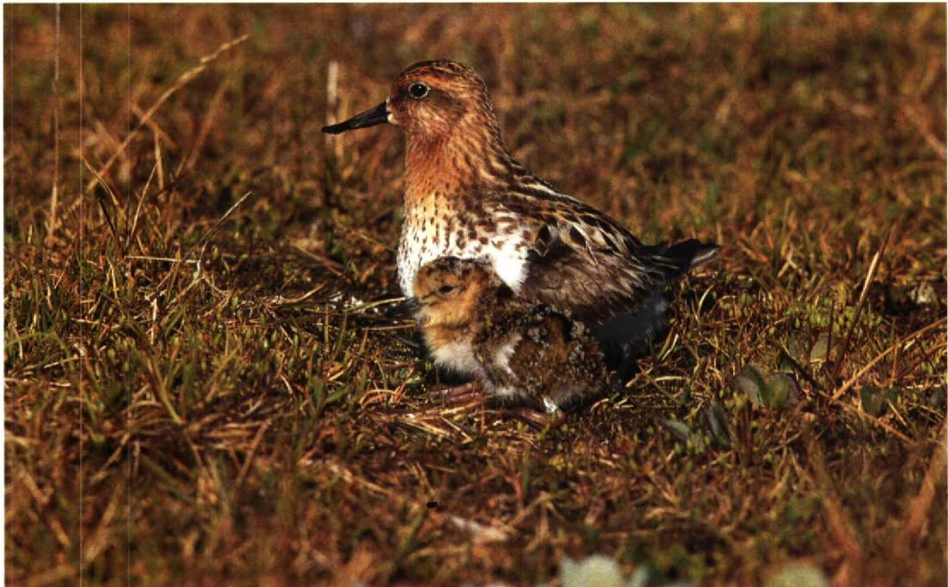
41 Spoon-billed Sandpiper Eurynorhynchus pygmeus , adult with chick, Belyaka Spit, Kolyuchinskaya Gulf, northern Chukotski peninsula, Russia, 22 July 1988

Arctic breeding sandpipers are well known for the diversity of their mating systems, ranging from pure monogamy to various forms of polygamy (eg, double-clutch system, polygamy in lekking species; cf Pitelka et al 1974). These mating systems are associated with many other species-specific features such as site fidelity (Oring & Lank 1984), migration schedule (Kokhanov 1965) and migration