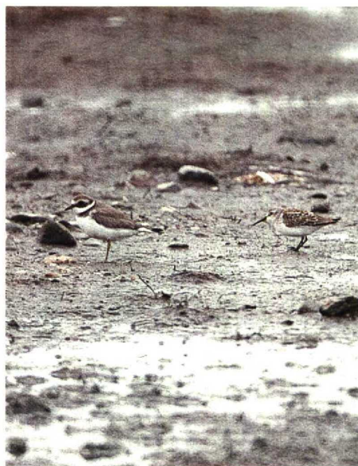
200 Western Sandpiper Calidris mauri , Wexford, Ireland, September 1992 (Paul Archer)

Saudi Arabia, seven Great Knots Calidris tenuirostris were present in October. The juvenile Western Sandpiper C mauri at North Slob, Wexford, Ireland, on 3 September stayed until 6 September, constituting the first record for Ireland and the seventh for the British Isles (cf Birding World 5: 341-343, 1992; Dutch Birding 14: 187, 1992). In October, a Pintail Snipe Gallinago stenura was discovered at Tarut. In the second week of November, five Slender-billed Curlews Numenius tenuirostris were reported from Albania. On 20 November, one was seen 15 km north of Kairouan, Tunisia. In France, the annual numbers of Marsh Sandpipers Tringa stagnatilis have been increasing significantly during the 1980s, and more than 70 individuals were reported in 1990 (all French records are dated between 18 March and 19 November); as a consequence, this species is no longer considered by the French rarities committee. A Solitary Sandpiper T solitaria was present on Fair Isle, Shetland, Scotland, on 13-15 September. The first Willet Catoptrophorus semipalmatus for Norway was a first-winter staying at Mølen, Vestfold, from 14 October. The only other WP records of this species in this century were one found long dead in Azores, on 12 March 1979 and a first-year photographed at Kemi, Lappland, Finland, c 20 km from the Swedish border, on 21 September 1983 (cf Lintumies 19: 161, 1984). During the night of 8-9 October, the largest influx since 1985 of Pomarine