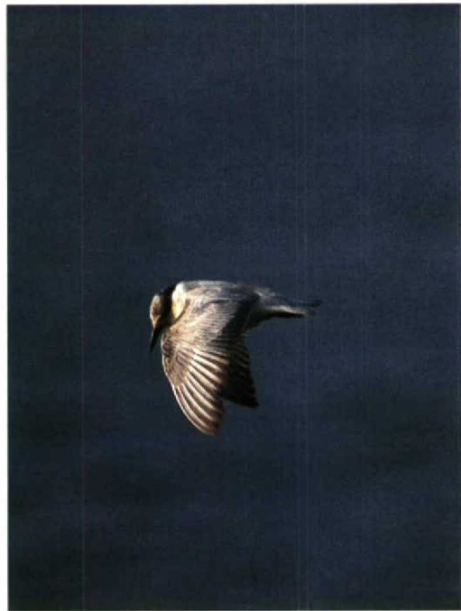
185-186 Witwangster Chlidonias hybridus , Houtribsluizen, Flevoland, 14 december 1991 187 Witwangster Chlidonias hybridus , Flevoland, december 1991