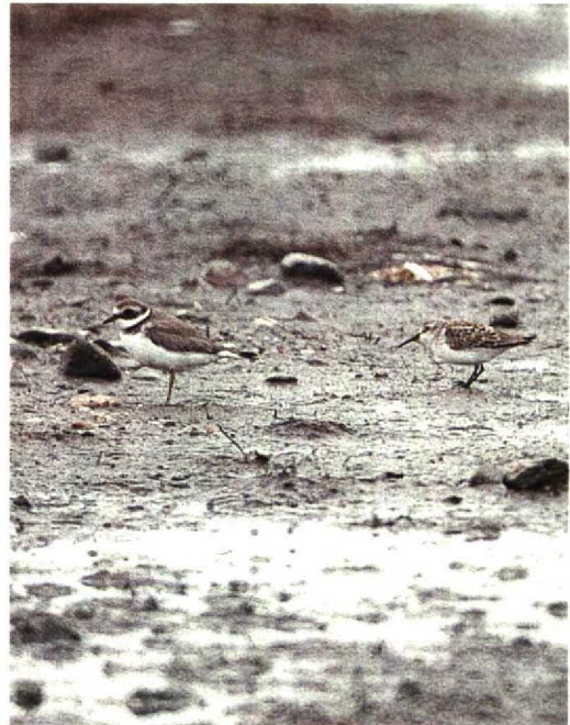
200 Western Sandpiper Calidris mauri , Wexford, Ireland, September 1992 (Paul Archer)

pomarina were seen, respectively. In Denmark, Spotted Eagles A clanga were present in Sjaelland on 29 September and 7 October. There were also two Steppe Eagles A nipalensis in Skåne and one was in Sjaelland (seen crossing the sea). In Finland, three were present during the summer. An adult Imperial Eagle A heliaca at Falsterbo, Skåne, on 17-18 September formed the 10th record for Sweden. A first-year Peregrine Falco peregrinus with a Finnish ring (D148773, ringed on 7 July 1992 in western Lapland, Finland) was trapped and released at Dronrijp, Friesland, the Netherlands, on 19 September. Hazel Grouse Bonasa bonasia still survive in the French Pyrénées, with recent sightings reported from Couledoux, Haute-Garonne. On 10 October, an adult Demoiselle Crane Anthropoides virgo was present in a flock of Cranes Grus grus in Mecklenburg, Germany. On 2-11 October, an immature Black-winged Pratincole Glareola nordmanni stayed around Davidstow airfield, Cornwall. On 19 August, two first-year Semipalmated Plovers Charadrius semipalmatus were seen at Paúl da Praia, Ilha Terceira, Azores (cf Dutch Birding 13: 139-140, 1991; 14: 173-176, 1992). On 20 August, a Kittlitz's Sand Plover C pecuarius was trapped and photographed in Bahrain. Sociable Plovers Chettusia gregaria at Tiel, Gelderland, on 25-27 September and at Nijkerk, Gelderland, on 22 November were already the fourth and fifth in 1992 for the Netherlands. At Tarut, North-Eastern Province,