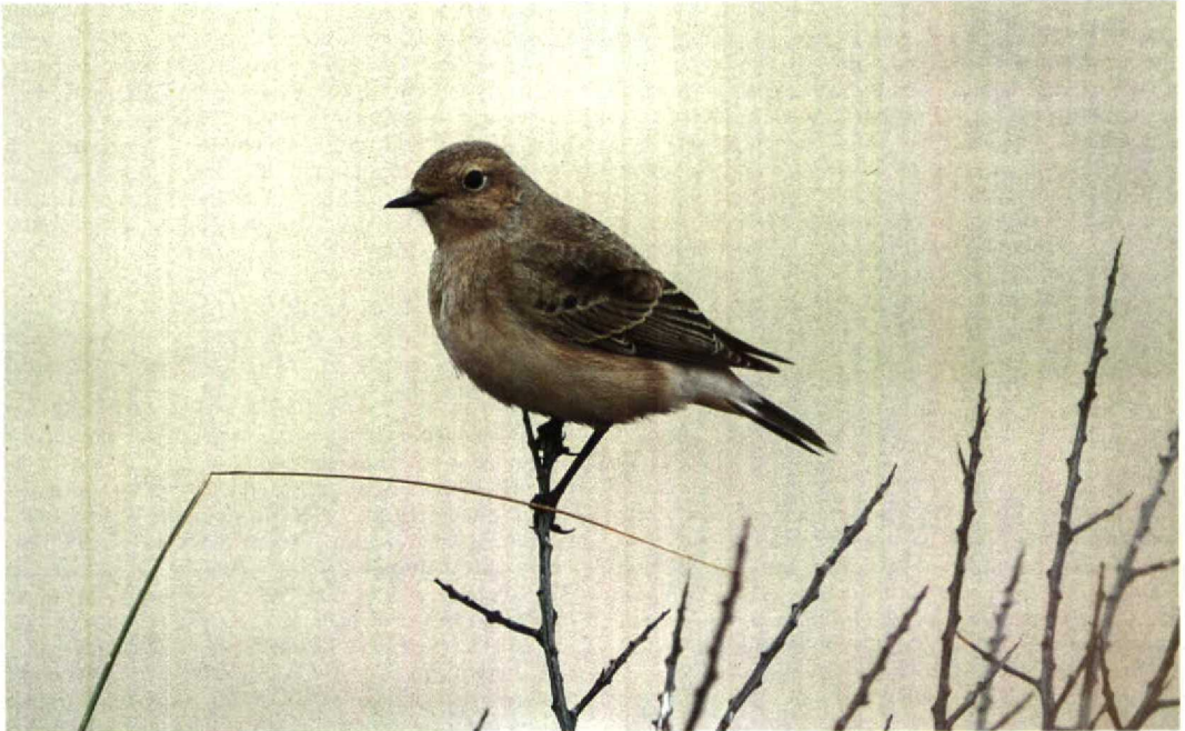
206 Bonte Tapuit Oenanthe pleschanka , eerstejaars vrouwtje, Katwijk, Zuidholland, 1 november 1992 (René Pop)