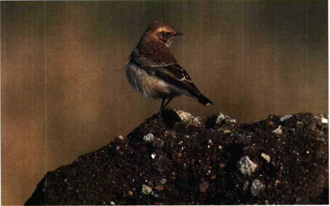
205 Bonte Tapuit Oenanthe pleschanka , eerstejaars mannetje, Petten, Noordholland, 26 oktober 1992 (René van Rossum)