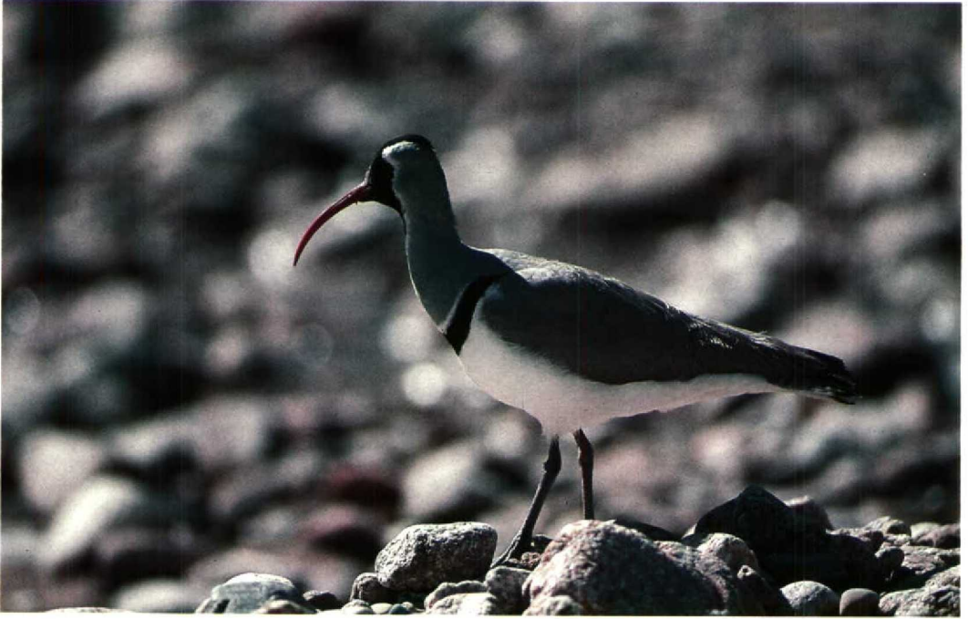
194 Ibisbill Ibidorhyncha struthersii , northern Tien Shan, Kazakhstan, May 1989

and Songar Tit Parus songarus (sometimes considered conspecific with Willow Tit P. montanus ). 5 Species closely associated with mountain streams. In the central Asian mountains this group includes Dipper Cinclus cinclus leucogaster , Brown Dipper C. pallasii , Grey Wagtail Motacilla cinerea , Blue Whistling Thrush Myiophonus caeruleus , Little Forktail Enicurus scouleri and River Chat/White-capped Redstart/Water Redstart Chaimarrornis leucocephalus .