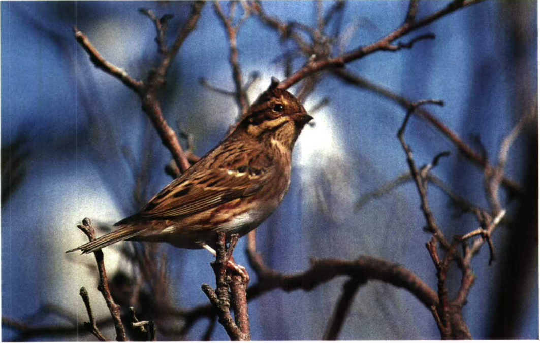
207 Bosgors Emberiza rustica , Vlieland, Friesland, oktober 1992