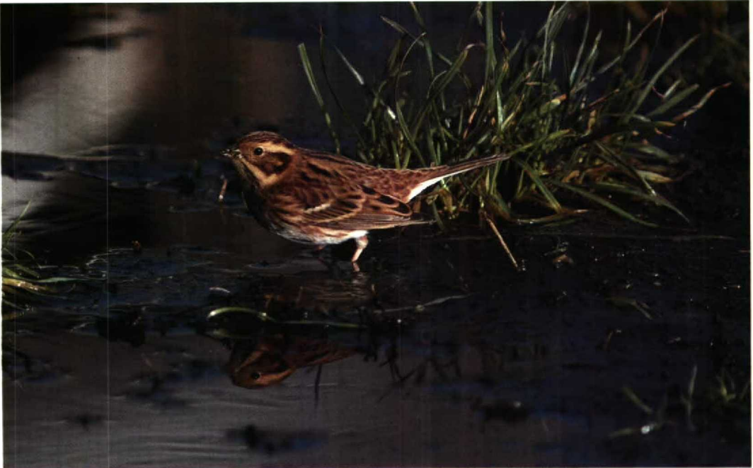
208 Bosgors Emberiza rustica , Petten, Noordholland, 26 oktober 1992