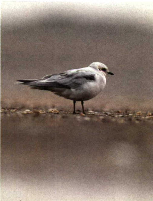
212 Ross' Meeuw Rhodostethia rosea , tweede-winter, IJmuiden, Noordholland, 23 november 1992

november) in de Vissershaven van IJmuiden bekijken. Het betrof het derde geval voor Nederland van deze lang verwachte soort, die het embleem van Dutch Birding vormt (in 1984 getekend door de ontdekker). Het eerste was een adult vrouwtje in zomerkleed dat vanaf 6 juni 1958 op Vlieland, Friesland, verbleef en op 14 juli dood werd aangetroffen. Het tweede was een adult in winterkleed dat op 17-18 januari 1981 bij Camperduin, Noordholland, werd waargenomen. MAX BERLIJN