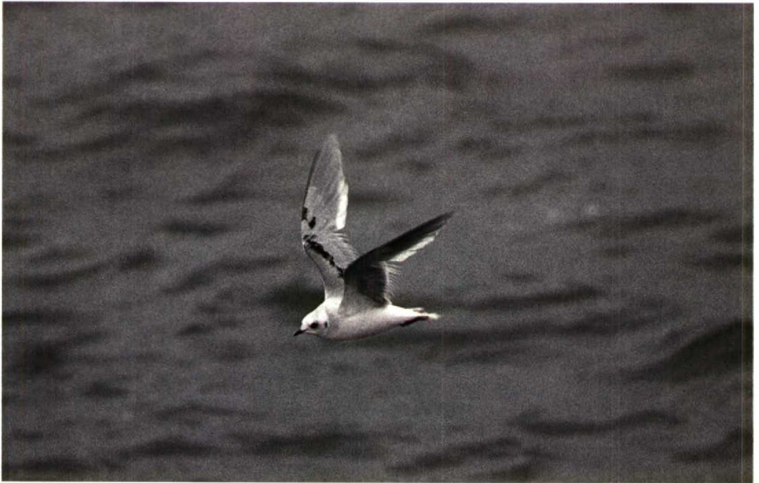
211 Ross' Meeuw Rhodostethia rosea , tweede-winter, IJmuiden, Noordholland, 22 november 1992