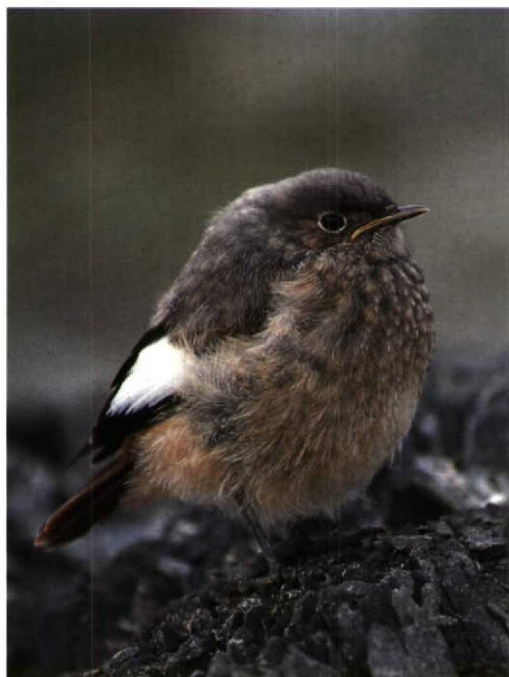
189 Blue-headed Redstart Phoenicurus caeruleocephalus , western Tien Shan, Kazakhstan, June 1988 190 Güldenstädt's Redstart Phoenicurus erythrogaster , juvenile, central Pamirs, Tadjikistan, July 1988 191 Caucasian Great Rosefinch Carpodacus rubicilla caucasica , North Osetia NR, Russia, November 1983