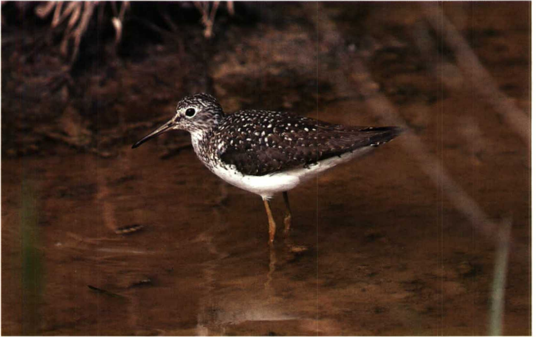
197-198 Solitary Sandpiper Tringa solitaria , adult summer, Louisiana, USA, 2 April 1982 (Arnoud B van den Berg)