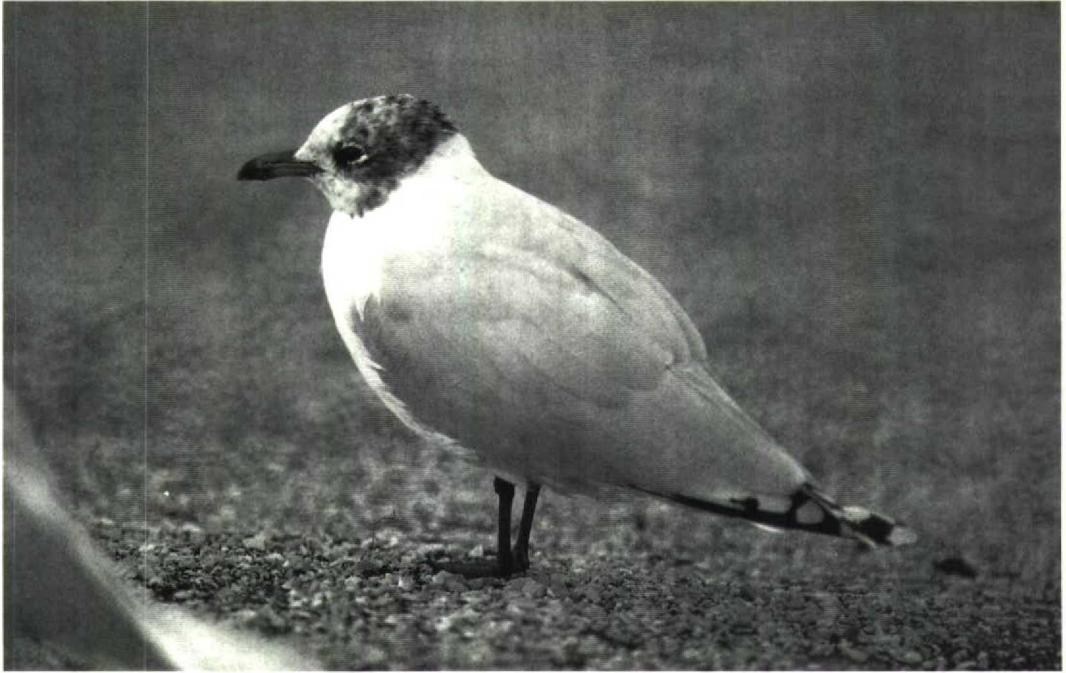
179 Mediterranean Gull Larus melanocephalus , second-year, showing HMS1 (see main text), lightly mottled, Le Portel, Pas-de-Calais, France, 16 March 1991 ( Dirk J Moerbeek ) 180 Mediterranean Gull Larus melanocephalus , adult, showing HMS2 (see main text), solid black areas, Le Portel, Pas-de-Calais, France, 2 March 1991 ( Dirk J Moerbeek )