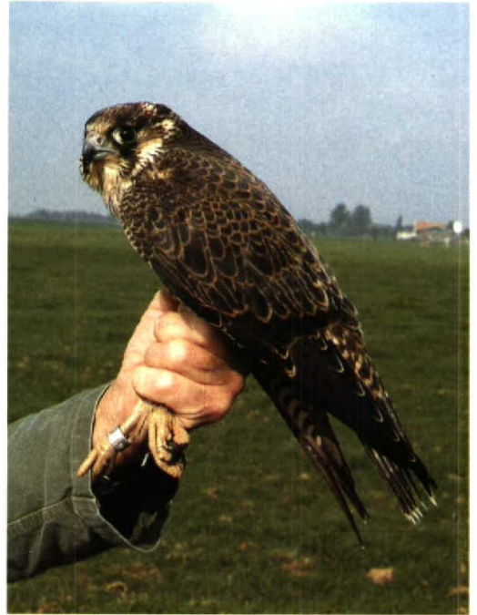
201 Grote Zilverreiger Egretta alba , Harkstede, Groningen, 11 september 1992 (Eric Koops) 202 Slechtvalk Falco peregrinus , eerstejaars met Finse ring (D148773 Museum Zool Helsinki), Dronrijp, Friesland, 19 september 1992 (Joop Jukema) 203 Zwarte Zeekoet Cephus grylle , Terschelling, 18 oktober 1992 (René van Rossum) 204 Kortteenleeuwerik Calandrella brachydactyla , eerstejaars, Eemshaven, Groningen, 29 september 1992 (Arnoud B van den Berg)