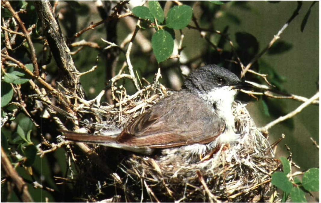
192 Hume's Lesser Whitethroat Sylvia curruca althaea , western Tien Shan, Kazakhstan, June 1983 (Algirdas J Knyštautas) 193 White-browed Tit Warbler Leptopoecile sophiae , male, northern Tien Shan, Kazakhstan, June 1989 (Oleg Belialov)