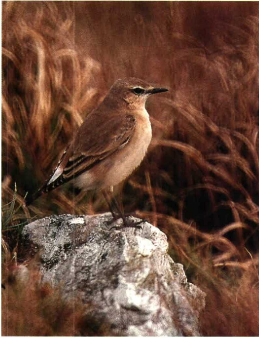
199 Isabelline Wheatear Oenanthe isabellina , Cork, Ireland, October 1992

Saudi Arabia, seven Great Knots Calidris tenuirostris were present in October. The juvenile Western Sandpiper C mauri at North Slob, Wexford, Ireland, on 3 September stayed until 6 September, constituting the first record for Ireland and the seventh for the British Isles (cf Birding World 5: 341-343, 1992; Dutch Birding 14: 187, 1992). In October, a Pintail Snipe Gallinago stenura was discovered at Tarut. In the second week of November, five Slender-billed Curlews Numenius tenuirostris were reported from Albania. On 20 November, one was seen 15 km north of Kairouan, Tunisia. In France, the annual numbers of Marsh Sandpipers Tringa stagnatilis have been increasing significantly during the 1980s, and more than 70 individuals were reported in 1990 (all French records are dated between 18 March and 19 November); as a consequence, this species is no longer considered by the French rarities committee. A Solitary Sandpiper T solitaria was present on Fair Isle, Shetland, Scotland, on 13-15 September. The first Willet Catoptrophorus semipalmatus for Norway was a first-winter staying at Mølen, Vestfold, from 14 October. The only other WP records of this species in this century were one found long dead in Azores, on 12 March 1979 and a first-year photographed at Kemi, Lapland, Finland, c 20 km from the Swedish border, on 21 September 1983 (cf Lintumies 19: 161, 1984). During the night of 8-9 October, the largest influx since 1985 of Pomarine