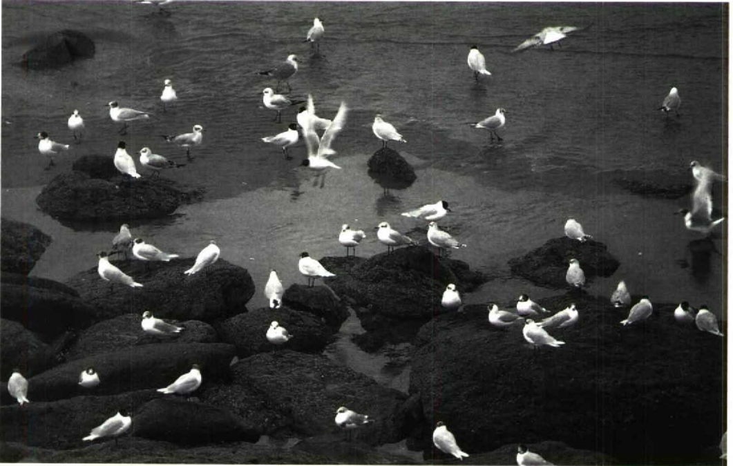
176 Mediterranean Gulls Larus melanocephalus , with Black-headed Gulls L. ridibundus and one Common Gull L. canus , Le Portel, Pas-de-Calais, France, 2 March 1991 ( Dirk J Moerbeek ) 177 Mediterranean Gull Larus melanocephalus , adult, showing HMS1 (see main text), winter head pattern, Le Portel, Pas-de-Calais, France, 26 January 1991 ( Ted Hoogendoorn ) 178 Mediterranean Gull Larus melanocephalus , adult, showing HMS1 (see main text), heavily blotched, Le Portel, Pas-de-Calais, France, 2 March 1991 ( Dirk J Moerbeek )