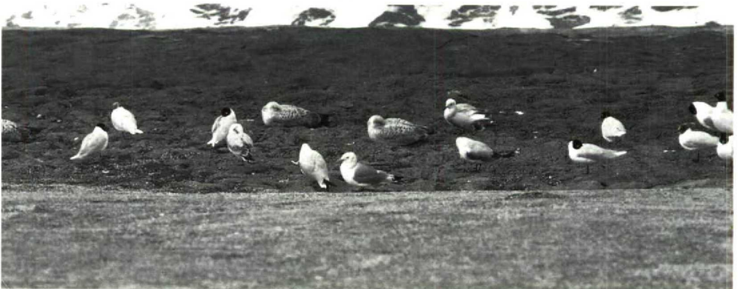
175 Mediterranean Gulls Larus melanocephalus , with Herring Gulls L. argentatus and one Kittiwake Rissa tridactyla , Le Portel, Pas-de-Calais, France, 16 March 1991

In most first-year birds at Le Portel, hardly any head-moult seems to occur, even in April-May; their winter head pattern is basically retained (cf Hume & Lansdown 1974). Grant (1986) stated 'hood sometimes developed to variable extent' and 'a few acquire full hood'. 45 birds observed at Le Portel on 9 May 1992 were all HMS1-patterned and of 64 birds on 1 June 1991, only two had attained HMS2. One of these was very close to a full hood but still had minor white spotting scattered around the base of the bill, on the forehead and the right ear-coverts. Elsewhere, of 19 first-year birds observed by WH at Lido degli Estensi, Ferrara, Italy, on 7 May 1991, none had