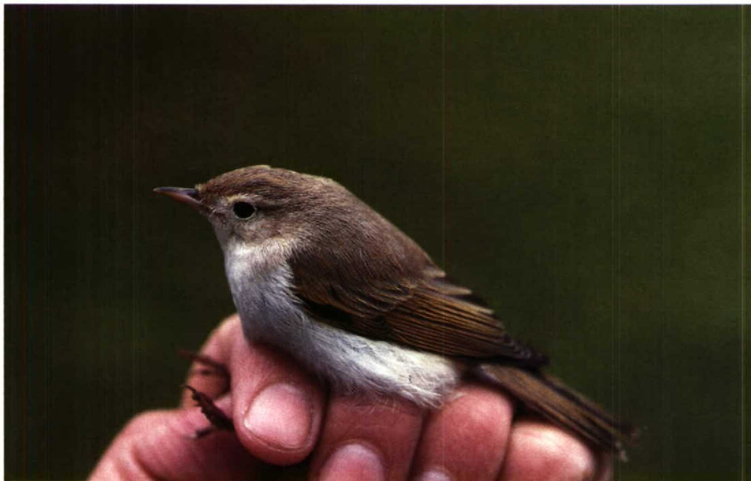
209 Bergfluit Phylloscopus bonelli bonelli , eerstejaars, Texel, Noordholland, 8 oktober 1992 (Arnoud B van den Berg)

gouwen), Leo Janssen (Zeetrekellingen in het Oost-ende), Dirk Symens (VLAVICO), Willy Verschueren (Linkeroever) en Frederik Willemyns (Mergus). Ook de