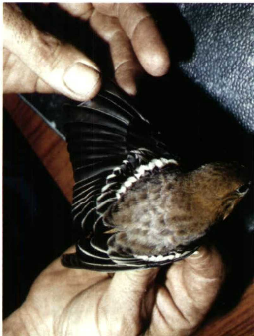
174 Noordelijke Troepiaal Icterus galbula , Vlieland, Friesland, 14 oktober 1987 (loop B Buker)

buitenvlag (genummerd van buiten naar binnen). Mate van verbening van schedel niet erg goed te zien, waarschijnlijk ongeveer half verbeend.