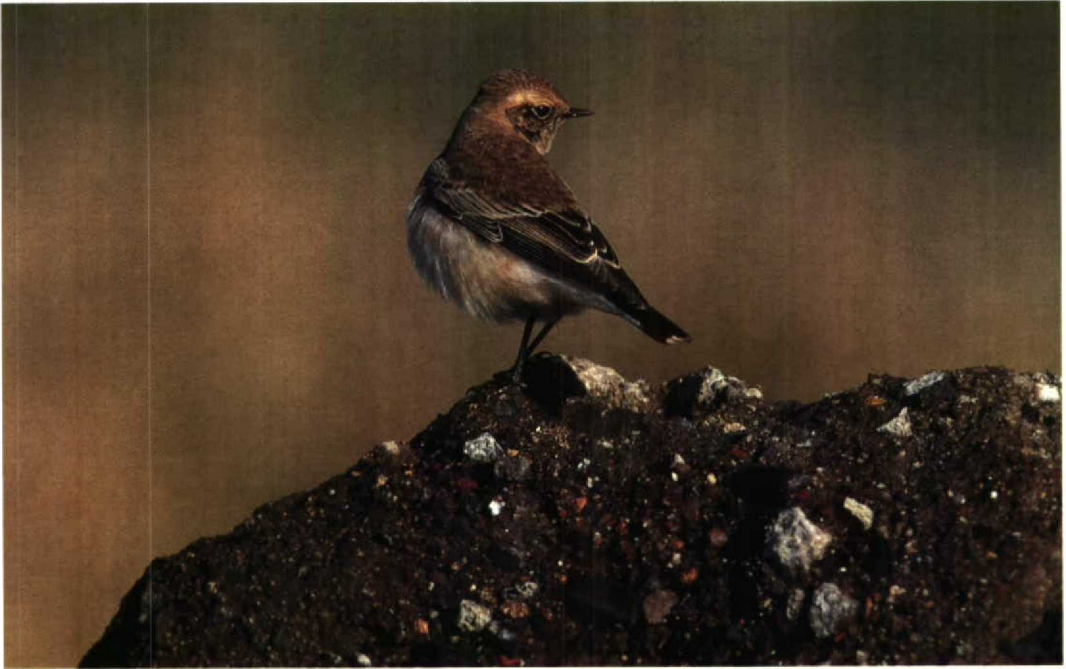
205 Bonte Tapuit Oenanthe pleschanka , eerstejaars mannetje, Petten, Noordholland, 26 oktober 1992