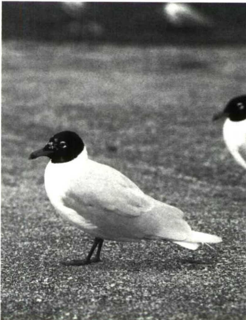
181 Mediterranean Gull Larus melanocephalus , adult, showing HMS2 (see main text), nearly full hood, Le Portel, Pas-de-Calais, France, 16 March 1991 (Ted Hoogendoorn)