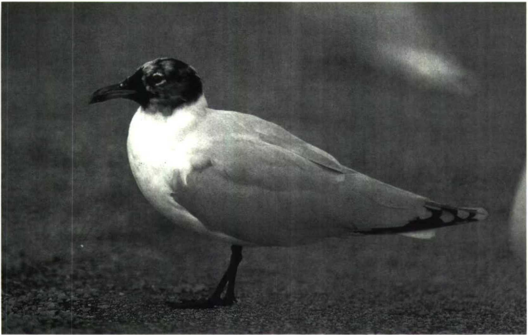
183 Mediterranean Gull Larus melanocephalus , second-year, showing HMS2 (see main text), solid black areas, with black predominantly concentrated around base of bill, Le Portel, Pas-de-Calais, France, 16 March 1991 184 Mediterranean Gull Larus melanocephalus , first-summer, showing HMS2 (see main text), nearly full hood, Budel-Dorplein, Noordbrabant, Netherlands, 28 April 1991