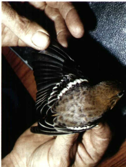
174 Noordelijke Troepiaal Icterus galbula , Vlieland, Friesland, 14 oktober 1987 (loop B Buker)

buitenvlag (genummerd van buiten naar binnen). Mate van verbening van schedel niet erg goed te zien, waarschijnlijk ongeveer half verbeend.