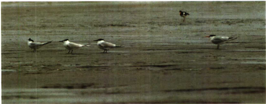
142-143 Sierlijke Stern Sterna elegans , Zeebrugge, Westvlaanderen, België, 12 juni 1988 ( Peter Boesman ) 144 Sierlijke Stern Sterna elegans , Zeebrugge, Westvlaanderen, België, 12 juni 1988 ( Patrick Beirens ) 145 Sierlijke Stern Sterna elegans , Zeebrugge, Westvlaanderen, België, 12 juli 1988 ( Arnoud B van den Berg ) 146 Sierlijke Stern Sterna elegans en Grote Sterns S sandvicensis , Zeebrugge, Westvlaanderen, België, 12 juni 1988 ( Peter Boesman )