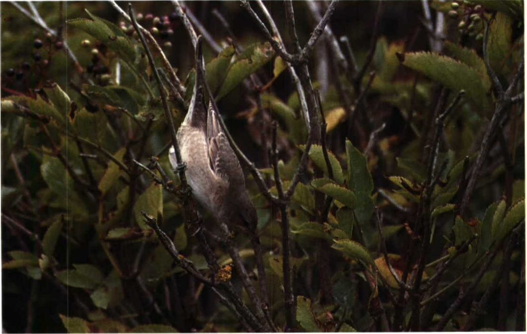
168 Sperwergrasmus Sylvia nisoria , Texel, Noordholland, augustus 1992 (Hans Gebuis)

Ovl. Eén exemplaar met kleurring pleisterde van 9 tot 16 augustus bij Saint-Sauveur H. Niet minder dan 31 Ooievaars trokken op 23 augustus over Sint-Agatha-Rode B. Bij Tertre H zaten er drie op 24 augustus. Het (ontsnapte) mannetje Blauwvleugeltaling Anas discors , dat reeds vanaf december in het Molsbroek te Lokeren verblijft, was nu in eclipskleed en werd in augustus weer geregeld waargenomen. Op 17 en 18 augustus zwom een juveniele Witoegeend Aythya nyroca bij Doornzele. Een vrouwtje Ijseend Clangula hyemalis