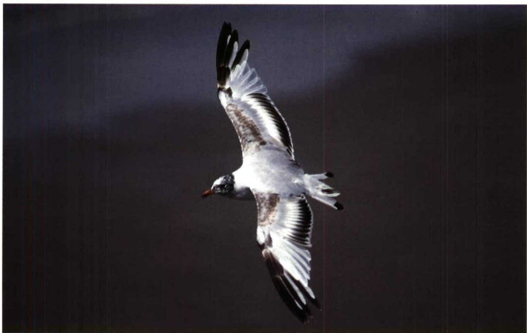
157 Zwartkopmeeuw Larus melanocephalus , ruiend van eerste zomer- naar tweede winterkleed, Le Portel, Pas-de-Calais, Frankrijk, 25 juli 1992 (Nikon F-801S, in de hand gehouden; Sigma 500 mm APO f7,2 AF; Kodachrome 64; 1/250, f8)

ervaring. Uiteindelijk zal men tot dezelfde positieve conclusie komen als Paul Doherty die bij het fotograferen van foeragerende sterns met een Nikon 300 mm f4 AF met handinstelling 20% scherpe foto's maakte en met autofocus 40% (Birding World 3: 324-325, 1990). Er zijn maar weinig lenzen langer dan 300 mm die een autofocus-functie hebben. Wel kan men lenzen (ook niet-AF) van kwaliteitsmerken combineren met een AF-converter om zo een autofocus-telelens te verkrijgen. Nadelig is dat daarbij in de regel meer dan een stop licht verloren gaat en dat de autofocus over een beperkt traject werkzaam is hetgeen met handinstelling moet worden gecompenseerd. Een voorbeeld van een goede Nikon-combinatie is de 300 mm AF lens met een 1,6 AF-converter resulterend in een 480 mm AF.