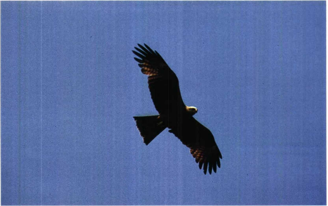
163 Zwarte Wouw Milvus migrans , Carel Coenraadpolder, Groningen, 24 mei 1992 164 Vale Pijlstormvogel Puffinus yelkouan , Hondsbossche Zeewering, Noordholland, 25 juli 1992 165 Vale Pijlstormvogel Puffinus yelkouan , Hondsbossche Zeewering, Noordholland, 25 juli 1992