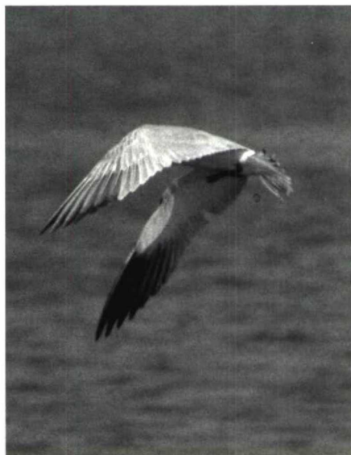
156 Caspian Tern Sterna caspia , Texas, USA, 26 February 1982 (Arnoud B van den Berg)

48 Last issue's mystery bird can be recognized as a gull or tern due to pale grey upperparts, whitish underparts and dusky wingtip. Colour and shape of bill, important identification features in gulls and terns, can not be seen. Large appearance and rather long legs may suggest a gull: the tail is spread which makes it difficult to see whether it is forked or not. Therefore, it is perhaps not surprising that 39% of the participants of the Dutch Birding mystery-bird competition in October 1989 on Texel, Noordholland, identified this bird as a Larus gull (with no less than 11 species being mentioned). However, the bird has narrower pointed wings and slightly shorter tail than a gull. The underwing shows extensive dusky tips to five outer primaries which appears a clue to identification since, apart from Caspian Tern Sterna caspia , all large pale tern species should show less contrast in underwing with more whitish at base of outer primaries. The photograph shows dark tips on rectrices and coverts which identify it as a first-year bird. This Caspian Tern was photographed on 26 February 1982 in Texas, USA.