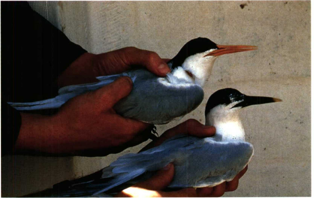
148 Sierlijke Stern Sterna elegans en Grote Stern S. sandvicensis , Banc d'Arguin/Arcachon, Gironde, Frankrijk, 10 juni 1987 (Philippe J Dubois) 149 Bengaalse Sterns Sterna bengalensis torresii , Karan, Arabische Golf, Saudiarabië, 4 juni 1991 (Arnoud B van den Berg)