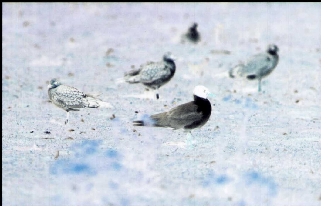
170 Adulte Zwartkopmeeuw Larus melanocephalus met twee juvenielen, Maasvlakte, Zuidholland, augustus 1992 171 Duinpieper Anthus campestris , Maasvlakte, Zuidholland, september 1992