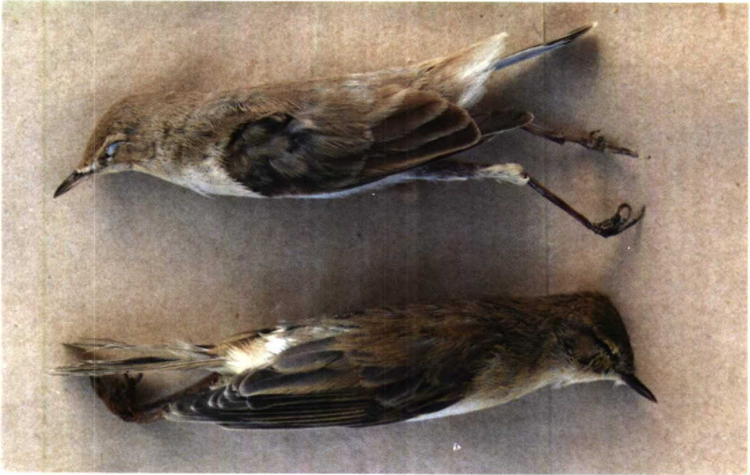
153 Booted Warbler Hippolais caligata (upper) and Willow Warbler Phylloscopus trochilus , Rosetta, Egypt, September 1991 (Sherif Baha el Din)

Meinertzhagen, R 1930. Nicoll's birds of Egypt 1. London. Paz, U 1987. The birds of Israel. London.