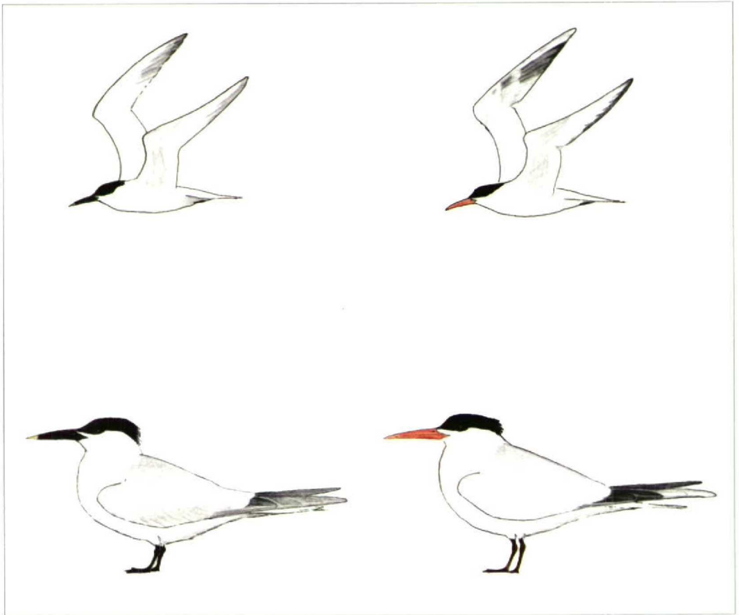
FIGUUR 1 Sierlijke Stern Sterna elegans (rechts) en Grote Stern Sterna sandvicensis , Zeebrugge, Westvlaanderen, België, 12 juni 1988 (Peter Boesman)

147 Sierlijke Stern Sterna elegans en Grote Sterns Sterna sandvicensis , Zeebrugge, Westvlaanderen, België, 12 juni 1988 (Peter Boesman)