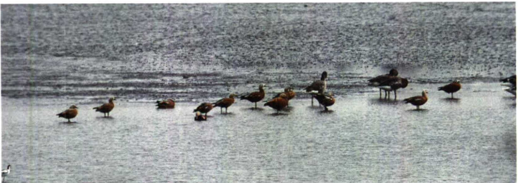
169 Casarca's Tadorna ferruginea , Lepelaarsplassen, Flevoland, augustus 1992 (René Pop)

verbleef op 4 juli te Kallo Ovl. Een overzomerend mannetje Nonnetje Mergus albellus (aanwezig sinds 18 mei) bleef tot ten minste 29 augustus present bij Diepenbeek L. Op 15 juli zat het mannetje Rosse Stelstaart Oxyura jamaicensis nog steeds op De Gavers te Harelbeke Wvl. Op 2 augustus kreeg het mannetje van De Kuifeend (dat heel die periode aanwezig was) gezelschap van een tweede exemplaar. Waarschijnlijk één van deze twee mannetjes was op 9 augustus op Blokkesdijk. Op 29 augustus was er een waarneming