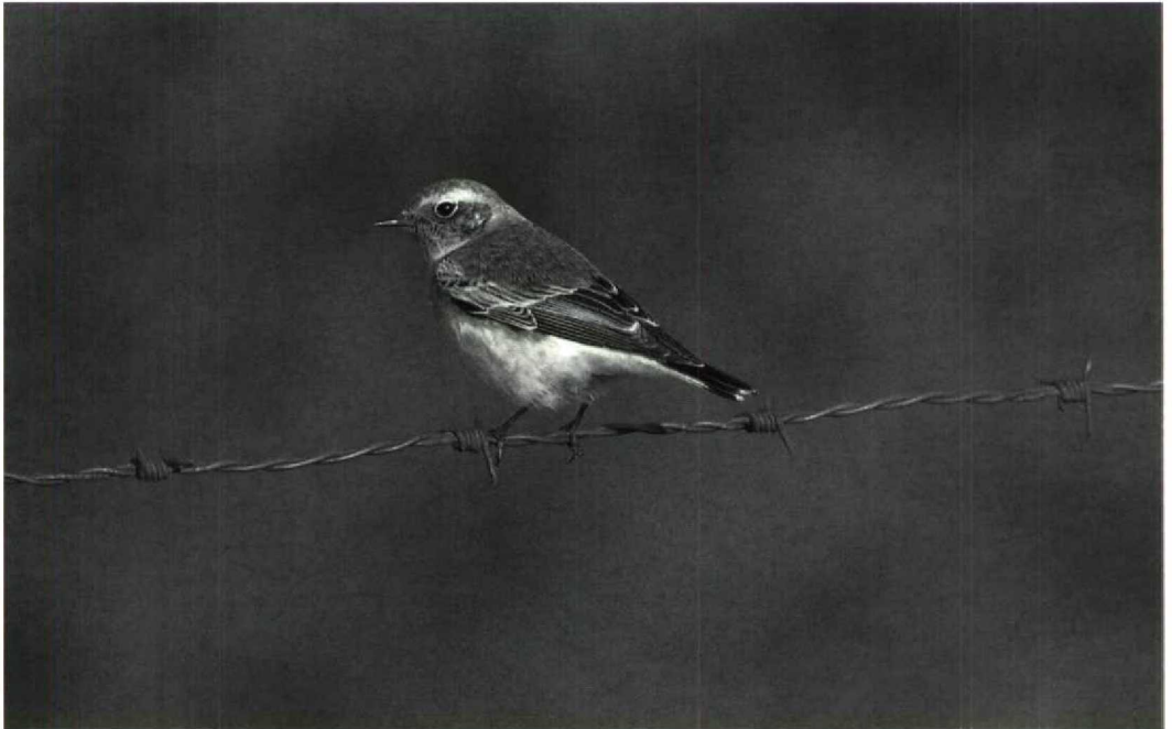
172 Bonte Tapuit Oenanthe pleschanka , Petten, Noordholland, 26 oktober 1992

tografeerde 'Blonde Tapuit' staat nog ter discussie.) Vanaf 27 september werden meer dan 10 Bosgorzen Emberiza rustica gemeld; indien alle waarnemingen worden ingediend en aanvaard, zou dit najaar beter zijn dan dat van het recordjaar 1980 toen er negen gevallen waren. Bovendien werden soorten gemeld als, bijvoorbeeld, Steppekievit Chettusia gregaria , Orpheus-spotvogel Hippolais polyglotta , Pallas' Boszanger P. proregulus (drie), Bruine Boszanger P. fuscatus en Roze Spreeuw Sturnus roseus zodat het najaar van 1992 veel hoogtepunten opleverde. ARNOUD B VAN DEN BERG