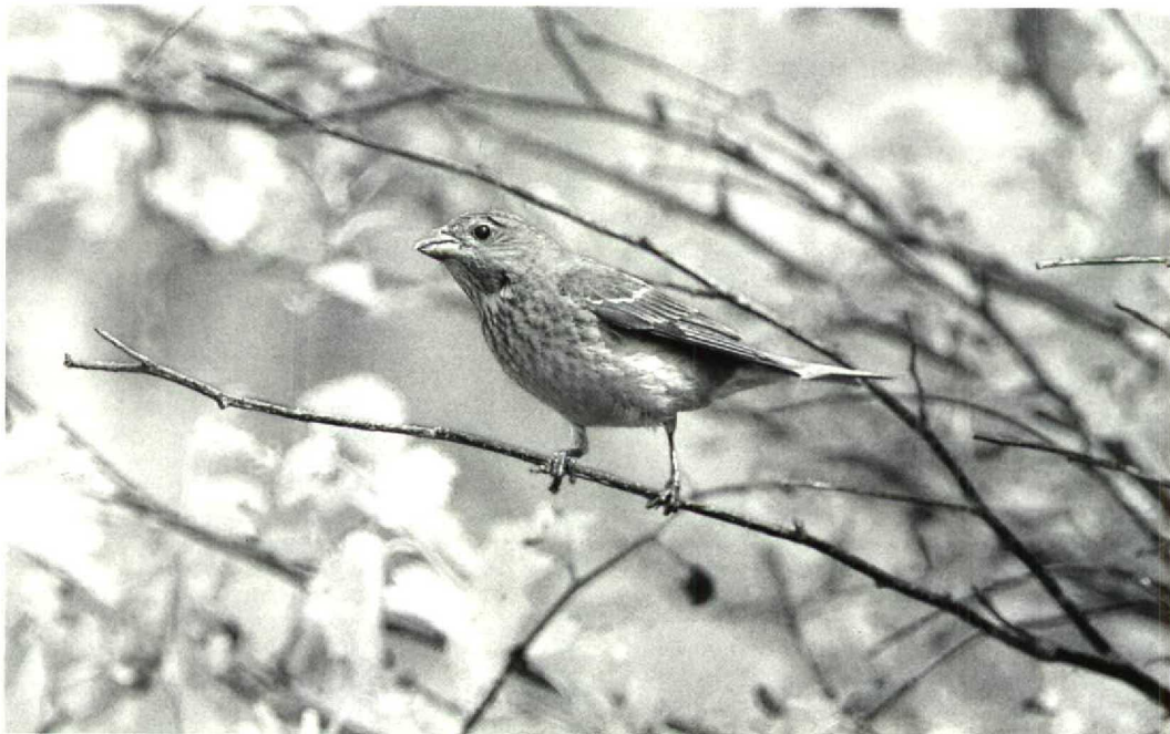
135 Roodmus Carpodacus erythrinus , vrouwtje, Schiermonnikoog, Friesland, juni 1992 (Leo J R Boon)