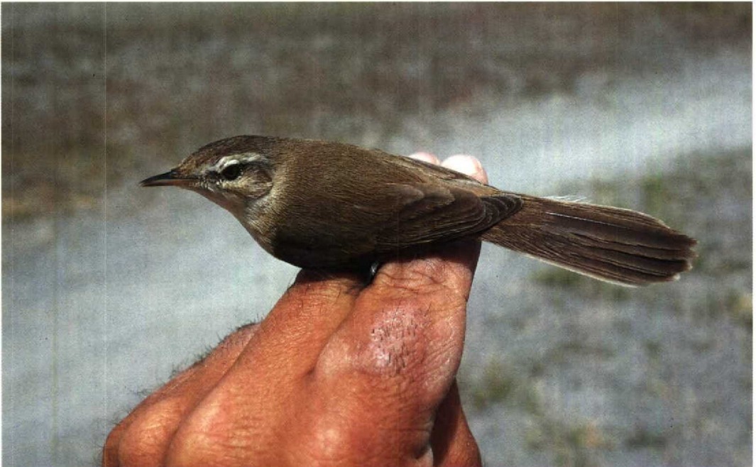
110 Veldrietzanger Acrocephalus agricola , Van, Turkije, 8 mei 1987