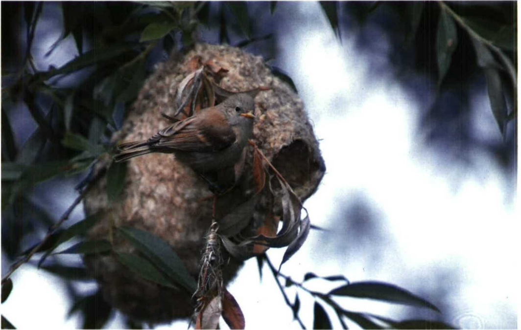
138 Buidelmees Remiz pendulinus , juveniel, Amsterdam, Noordholland, 23 juni 1992 (Arnoud B van den Berg)