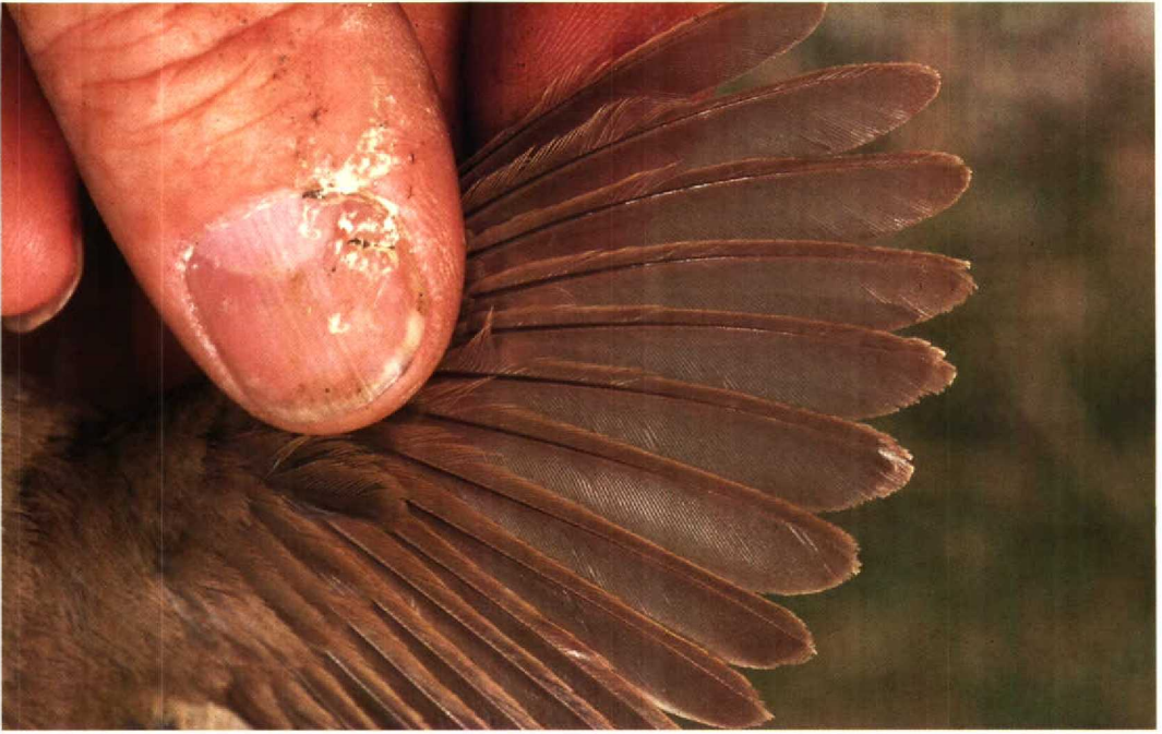
109 Struikrietzanger Acrocephalus dumetorum , Lelystad, Flevoland, 26 juni 1990