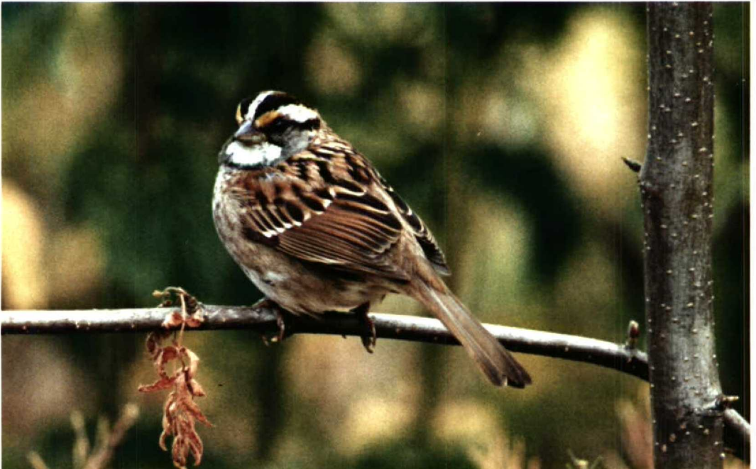
132 White-throated Sparrow Zonotrichia albicollis , Felixstowe, Suffolk, England, June 1992 (George Reszeter)