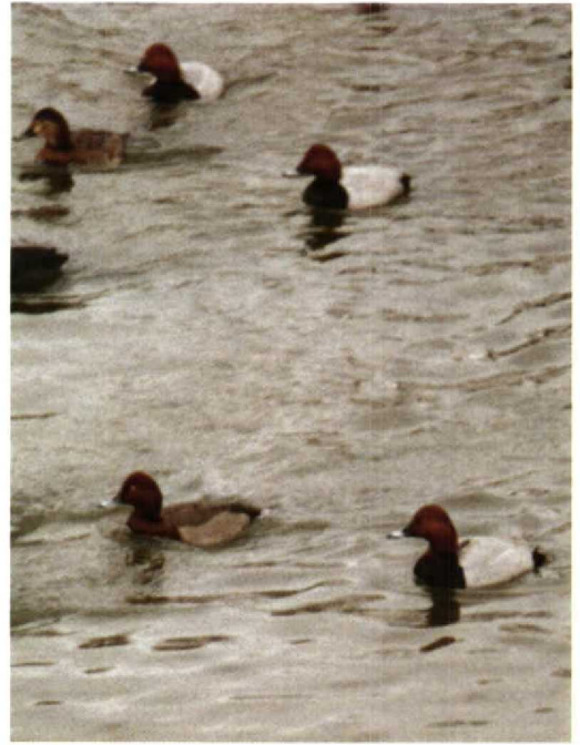
118-119 Hybride Tafeleend x Witoogeend Aythya ferina x nyroca , mannetje, Utrecht, Utrecht, 15 februari 1991 (Enno B Ebels)