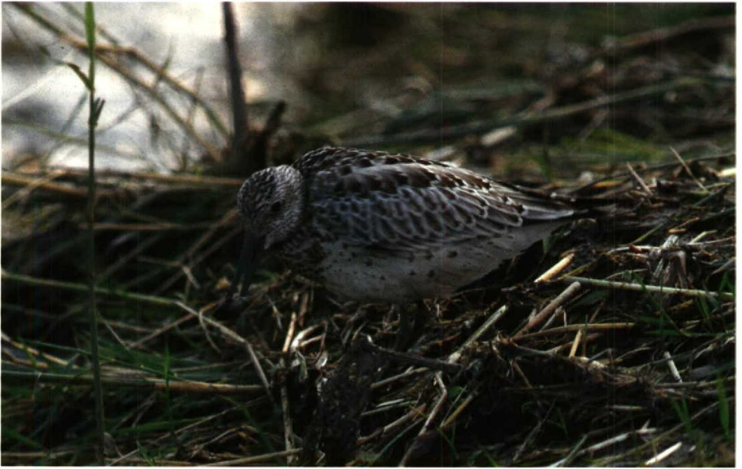
112 Grote Kanoet Calidris tenuirostris , De Putten bij Camperduin, Noordholland, oktober 1991 (Arnoud B van den Berg)