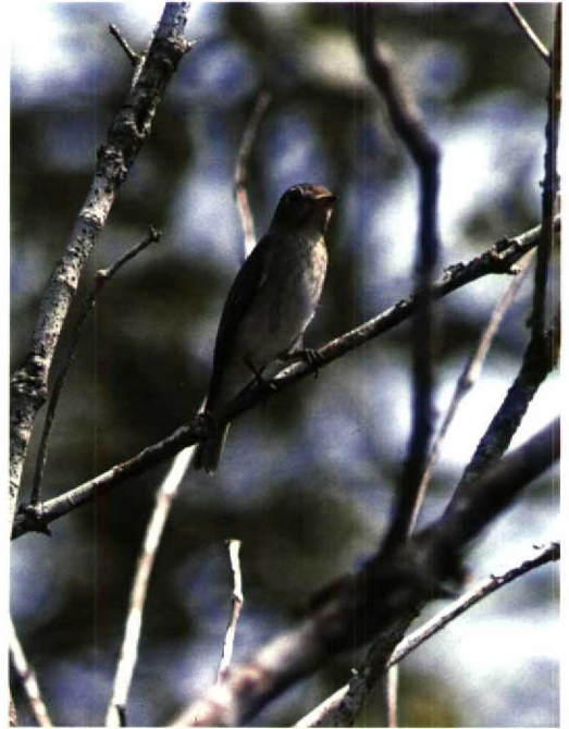
128 Brown Flycatcher Muscicapa dauurica , Kuala Selangor, Malaysia, 3 November 1991