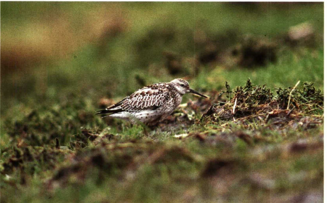
113 Grote Kanoet Calidris tenuirostris , De Putten bij Camperduin, Noordholland, oktober 1991 (René van Rossum)