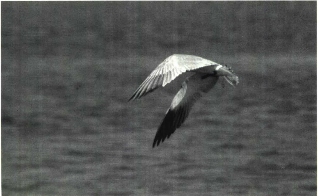
Mystery photograph 48. Solution in next issue

Colin Bradshaw, 9 Tynemouth Place, North Shields, Tyne and Wear NE30 4BJ, UK