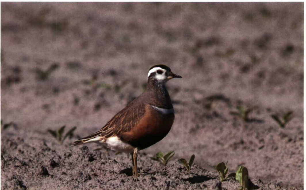
139 Morinelplevier Charadrius morinellus , Zoutkamp, Groningen, 16 mei 1992