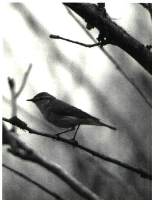
134 Grauwe Fitis Phylloscopus trochiloides , Rottumeroog, Groningen, 2 juni 1992