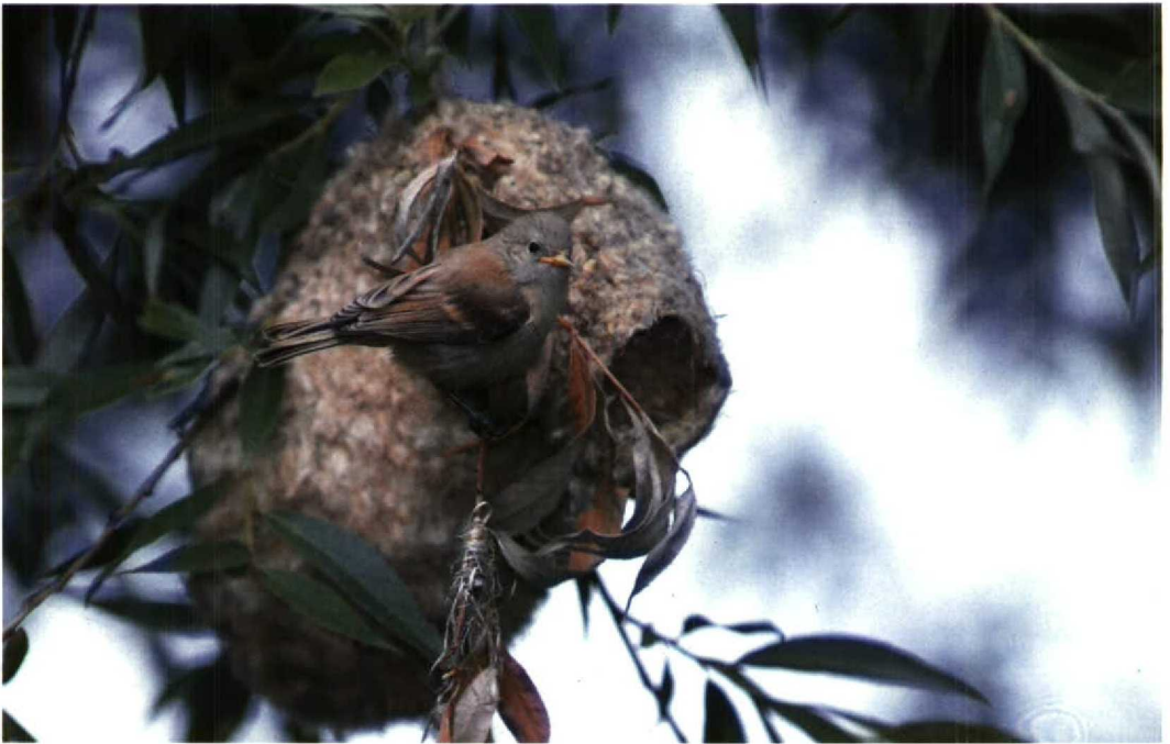
138 Buidelmees Remiz pendulinus , juveniel, Amsterdam, Noordholland, 23 juni 1992 (Arnoud B van den Berg)