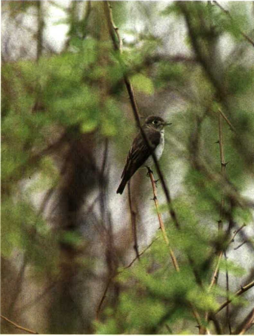
127 Brown Flycatcher Muscicapa dauurica , Beidaihe, China, May 1990