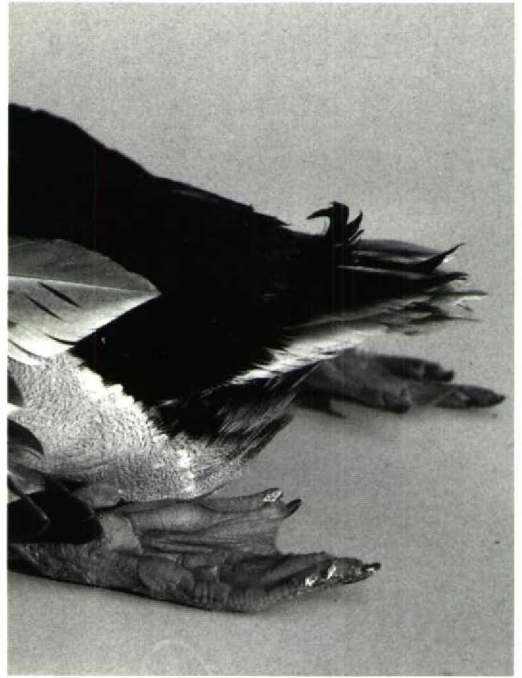
114 Wilde Eend Anas platyrhynchos , vrouwtje, op 4-jarige leeftijd ( Dini Marks-Maarschalkerwaard ) 115 Krul in staart als typerend mannelijk kenmerk van zelfde vrouwtje Wilde Eend Anas platyrhynchos als in plaat 114, op 14-jarige leeftijd ( Frans van Bommel ) 116 Typerende mannelijke kop- en halstekening van zelfde vrouwtje Wilde Eend Anas platyrhynchos als in plaat 114, op 14-jarige leeftijd ( Frans van Bommel )