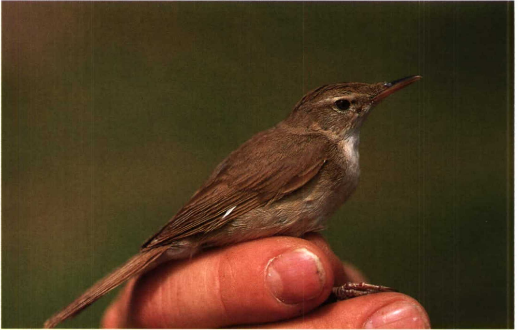
107-108 Struikrietzanger Acrocephalus dumetorum , Lelystad, Flevoland, 26 juni 1990