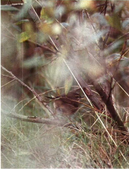
75 Radde's Warbler Phylloscopus schwarzi , Maasvlakte, Zuidholland, November 1990 (Hans Gebuis)