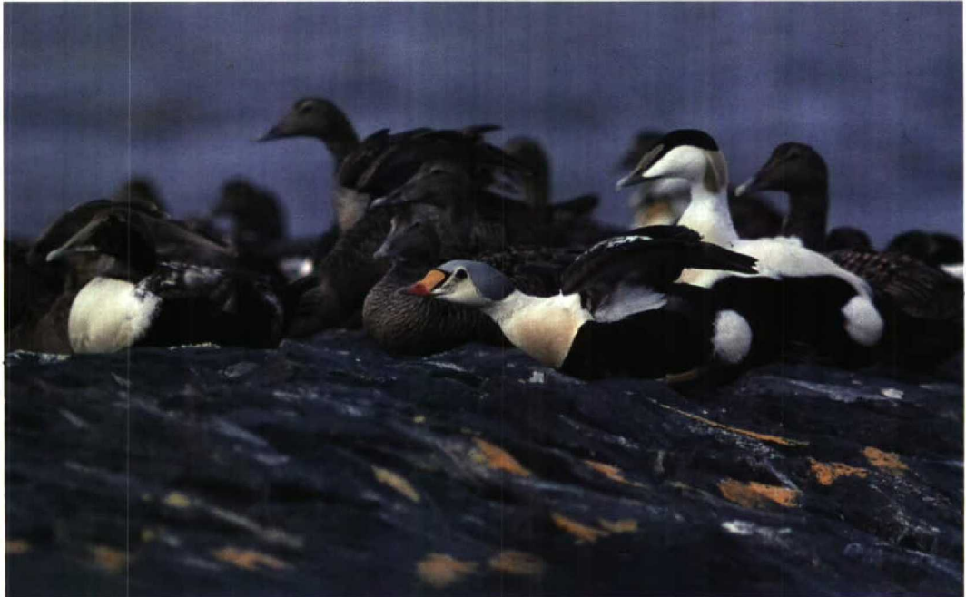
71 King Eider Somateria spectabilis , male, Roptazijl, Harlingen, Friesland, 17 April 1990 (Arnoud B van den Berg)