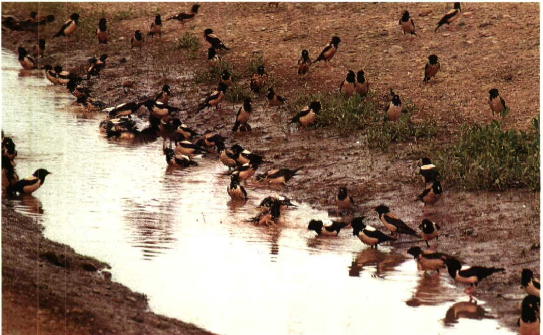
89 Rose-coloured Starlings Sturnus roseus , Chimkent region, Kazakhstan, June 1988