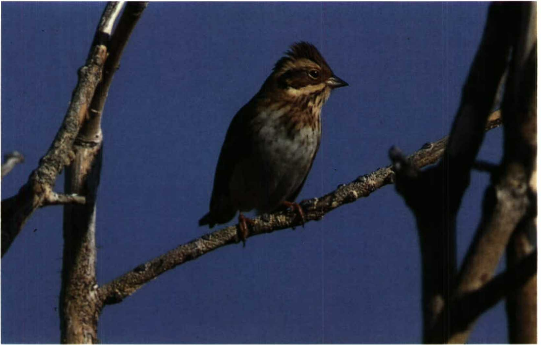
82 Rustic Bunting Emberiza rustica , Westkapelle, Zeeland, September 1990