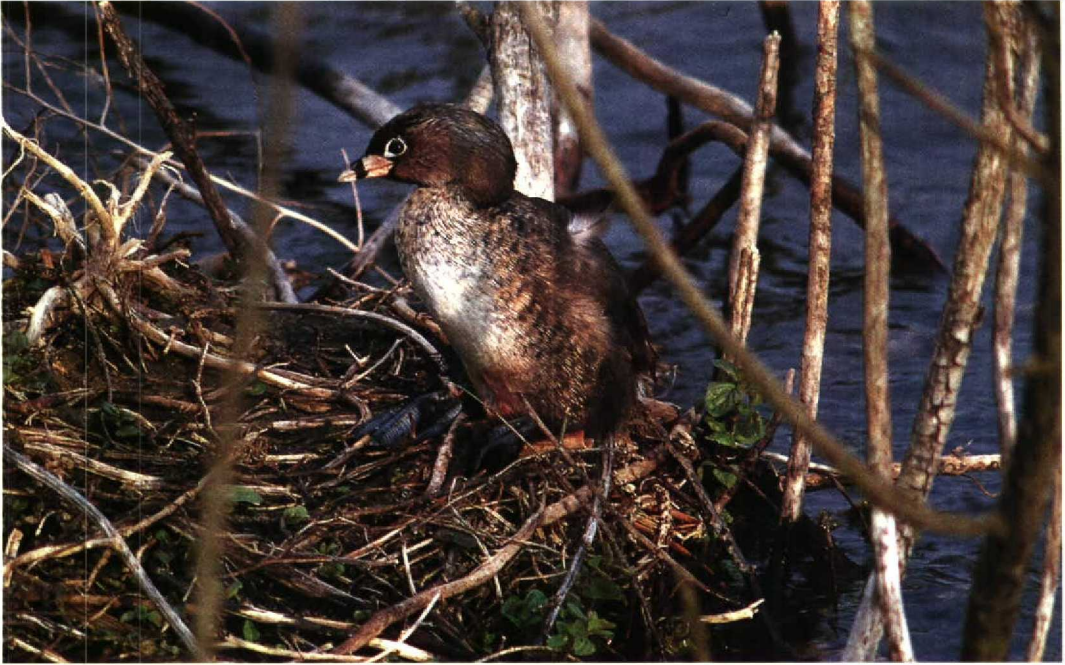
97 Pied-billed Grebe Podilymbus podiceps , Radley, Oxfordshire, England, April 1992