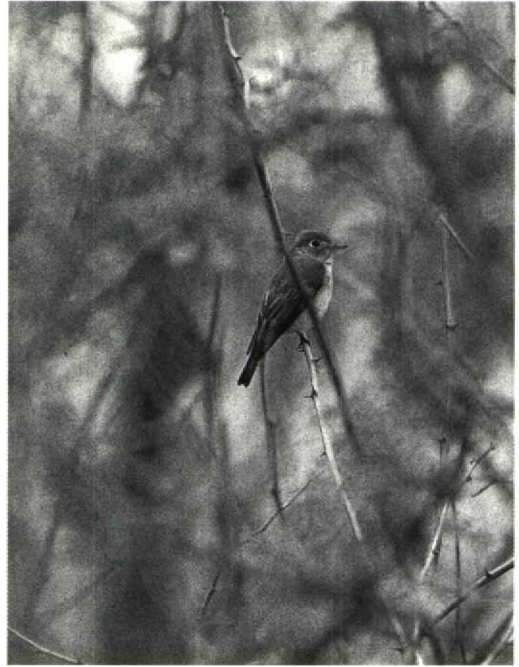
Mystery photograph 47. Solution in next issue

The bird is then either Green Sandpiper T ochropus or the Nearctic Solitary Sandpiper T solitaria . The photograph shows well the clinching field-mark of the colour of the rump which is black in our bird, as in Solitary Sandpiper, and white on Green Sandpiper. In addition, the central rectrices of Solitary Sandpiper are uniformly black whereas they are banded in Green Sandpiper. There are other, less obvious characteristics. The bill of Green Sandpiper is quite heavy and does not seem to droop, the legs tend to look relatively shorter and, in general, Green Sandpiper is a stockier bird than Solitary Sandpiper. Green Sandpiper also usually has an eye-ring less prominent than shown by this bird and I have yet to see one with the 'spectacled' look usually present on Solitary Sandpiper. This may be because the supercilium of Green Sandpiper tends