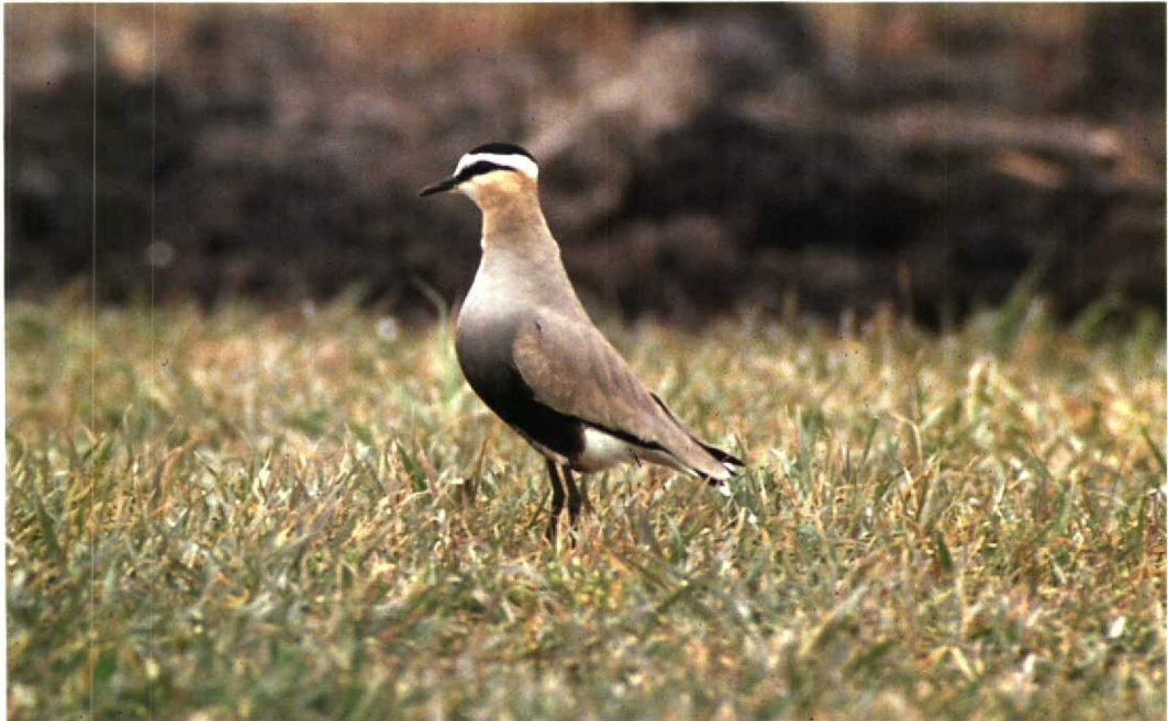
77 Sociable Plover Chettusia gregaria , adult summer, IJsselstein, Utrecht, April 1990