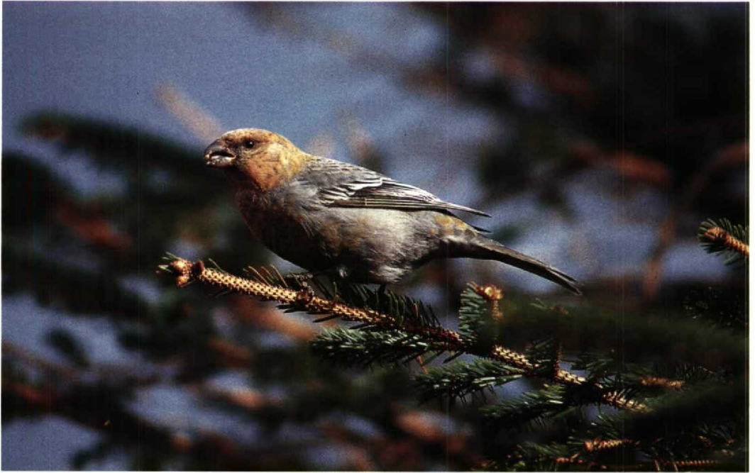
99 Pine Grosbeak Pinicola enucleator , Lerwick, Shetland, Scotland, March 1992