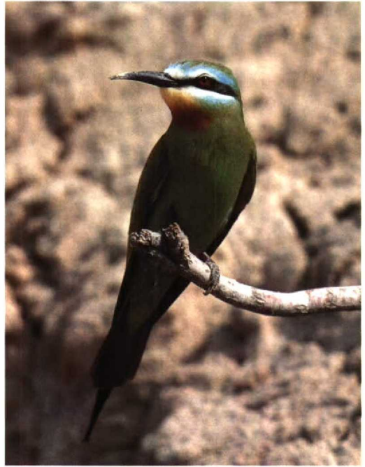
88 Blue-cheeked Bee-eater Merops superciliosus , Sary Ishikotrau desert, Kazakhstan, June 1986 ( Oleg Belialov )