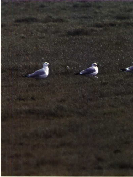
103 Ringsnavelmeeuw Larus delawarensis (links) en Kokmeeuw L. ridibundus , Begijnenmoeren, Antwerpen, België, april 1992 (Arnoud B van den Berg)

ters van 24 tot 27 april bij Rhenen, op 26 en 27 april bij Deventer O en twee op het Beuven. Op 18 april verbleef een Grauwe Franjepoot Phalaropus lobatus op de Molenplaat. Meer dan 100 Zwartkopmeeuwen Larus melanocephalus werden doorgegeven. Op exact dezelfde plaats waar in juni 1987 een Franklins Meeuw L. pipixcan verbleef ontdekten twee vogelaars, tijdens het zoeken naar Zwartkopmeeuwen, een adulte Ringsnavelmeeuw L. delawarensis . Ook deze Amerikaanse meeuw werd gezien ten zuiden van Achtmaal Nb, echter voornamelijk aan de Belgische kant van de grens. Het aantal gemelde Geelpootmeeuwen L. cachinnans bleef beperkt tot vijf, die, behalve een exemplaar bij Waspik Nb, alle aan de kust werden gezien. Er was een melding van een Kleine Burgemeester L. glaucoides op 1 en 2 maart bij Broekhuizenvorst L. Langs de kust werden Kleine Burgemeesters gezien op 5 en 7 maart bij Katwijk Zh, op 11 maart en 3 en 16 april bij Scheveningen Zh, op 27 maart bij IJmuiden en op 14 april bij Egmond Nh. Tot 16 maart zat de adulte Grote Burgemeester L. hyperboreus van de Brouwersdam op zijn stek. Op 6 en 8 maart verbleef een onvolwassen exemplaar bij Middelbert Gr. Witwangsterns Chlidonias hybridus werden gezien op 26 april op Wieringen Nh en op 30 april bij Breskens. Op 24 april vloog minimaal één Witvleugelstern C. leucopterus tussen Zwarte Sterns C. niger langs de Oostvaardersdijk.