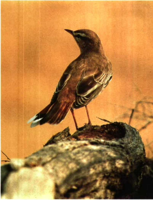
87 Rufous Bush Robin Cercotrichas galactotes , Repetek NR, Turkmenistan, June 1984