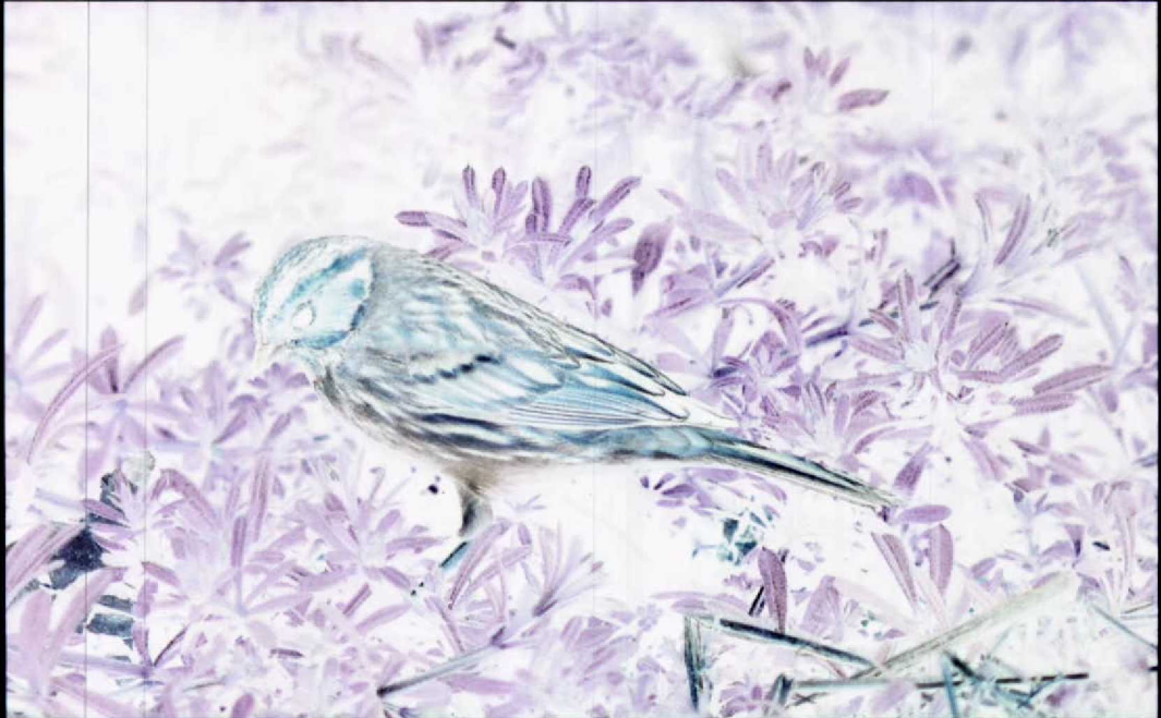
81 Little Bunting Emberiza pusilla , Katwijk aan Zee, Zuidholland, 5 April 1990