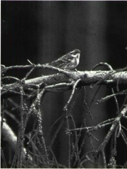
106 Bosgors Emberiza rustica , Logbiermé, Luik, België, 21 maart 1992 (Chris Bradshaw)

een mannetje Rosse Stekelstaart Oxyura jamaicensis terwijl een (mak) adult vrouwtje van 2 maart tot 20 april bij Duffel A verbleef. Het onvolwassen vrouwtje Witkopeend O leucocephala bleef nog tot ten minste 31 maart present op de plas bij de Blauwe Toren te Brugge Wvl. Vanaf 1 april begon de doortrek van Zwarte Wouwen Milvus migrans . Er was een totaal van 19 exemplaren met waarnemingen te Angre H, Burcht A, Doel Ovl, Duffel, Etalle Lux, Frasnes-les-Buissenal, Genappe B, Heist o/d Berg A, Hoeke Wvl, Kallo Ovl, Knokke Wvl, Latour Lux, Lier, Longchamps N, Maaseik L, Tessenderlo en Virton. Vanaf 26 april pleisterde er één bij Harchies-Hensies. De 22 gemelde Rode Wouwen M milvus kwamen van Baarle-Drongen Ovl, Blokkersdijk (zes), Booischot A, Bredene, De Haan Wvl, Geel A (twee), Heist o/d Berg, Kalmthout A, Kontich A (twee), Lier (twee), Muizen, Oud-Turnhout A, Sint-Pieters-Kapelle Wvl en Wuustwezel A. Vanaf 29 maart werden gespreid over de periode 12 Visarenden Pandion haliaetus gemeld, met waarnemingen te Duffel, Harchies (vier), Lier, Linkhout L, Mechelen A, Musson Lux, Neerijse B (drie), Testelt L en Zeebrugge. Over de hele periode waren 12 waarnemingen van Slechtvalken Falco peregrinus gespreid over Angre, Doel, Evergem-Kluizen Ovl, Leefdaal B, Lier, Mouscron H, Oostende (twee), Quévy H, Turnhout A, Wenduine Wvl en Wuustwezel.