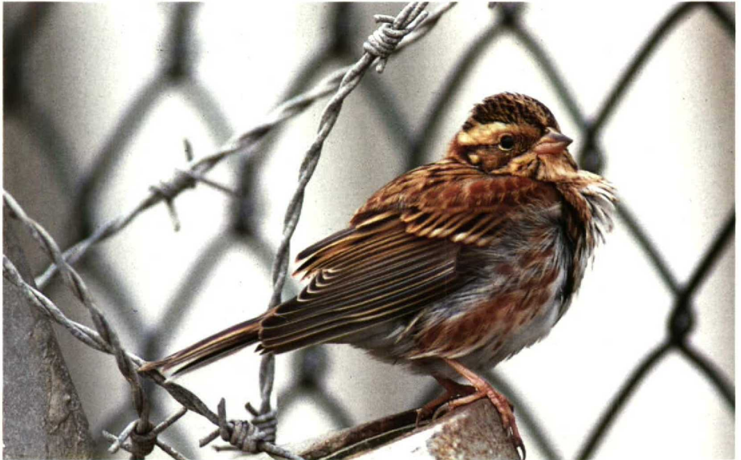
83 Rustic Bunting Emberiza rustica , Scheveningen, Zuidholland, 29 September 1990 (René van Rossum)