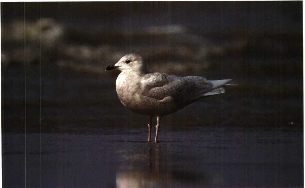
102 Kleine Burgemeester Larus glaucooides , Katwijk aan Zee, Zuidholland, maart 1992 (René van Rossum)