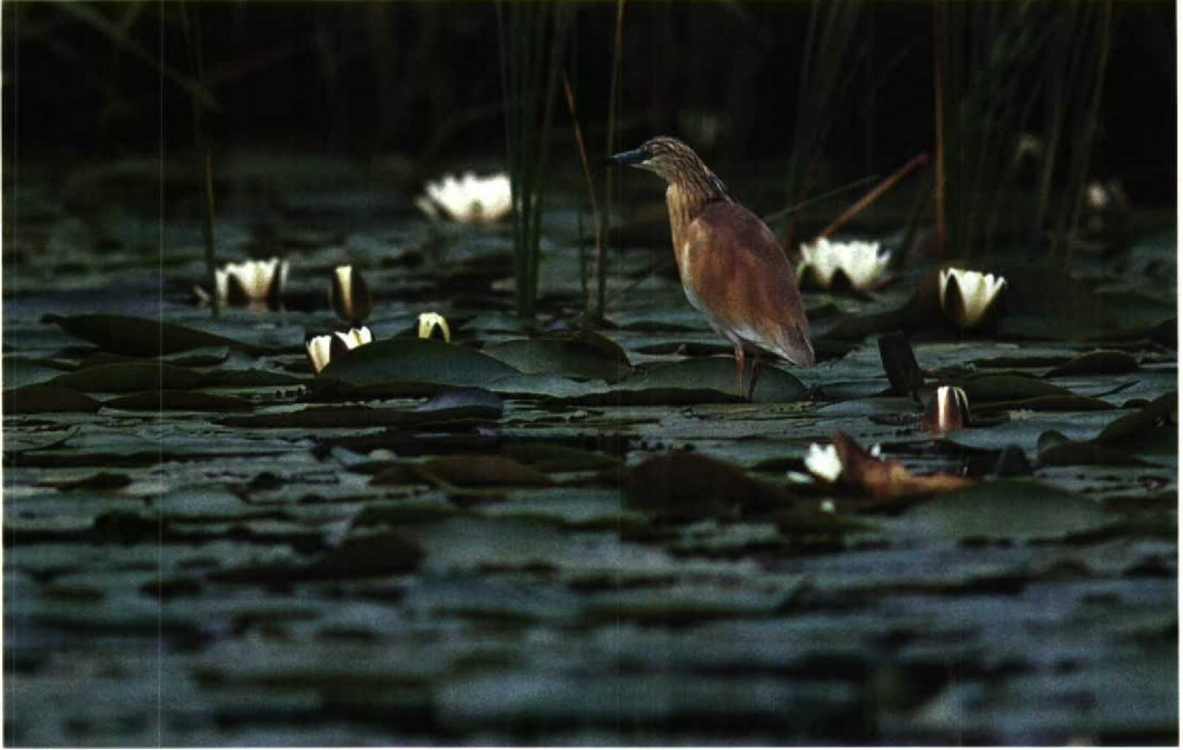
70 Squacco Heron Ardeola ralloides , Nieuwkoop, Zuidholland, June 1990 (Hans Gebuis)