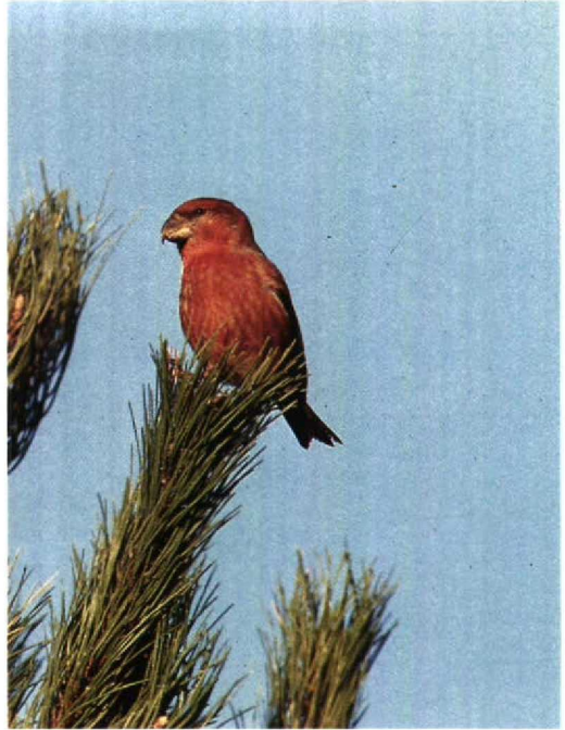
76 Parrott Crossbill Loxia pytyopsittacus , Noordwijk, Zuidholland, February 1990 (René van Rossum)