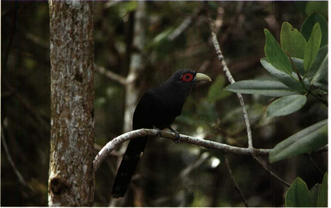
95 Roodbuikmalkoha Rhopodytes sumatranus , Kuala Selangor, Maleisië, 3 november 1991 (Arnoud B van den Berg)