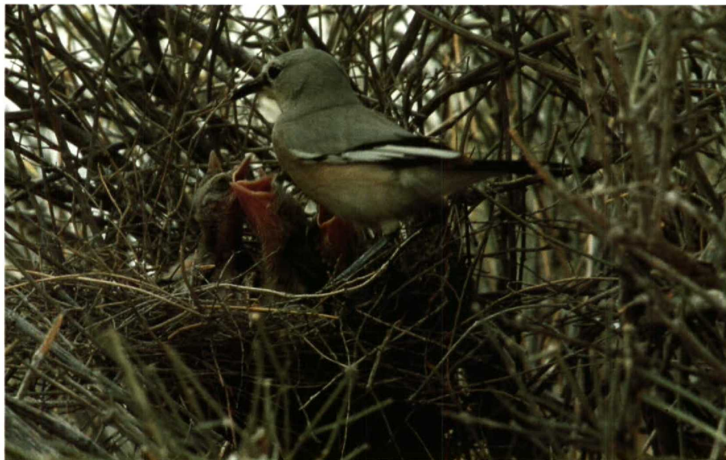
90 Pander's Ground Jay Podoces panderi , Repetek NR, Turkmenistan, June 1984