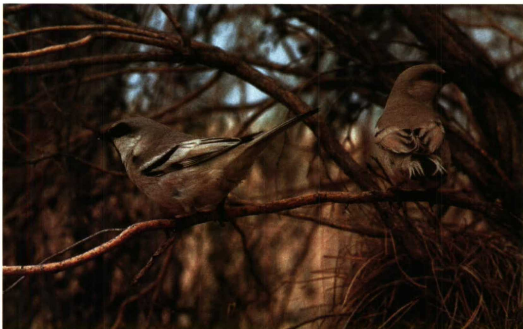
91 Desert Sparrow Passer simplex , Repetek NR, Turkmenistan, June 1984 (Henrikas Sakalauskas)