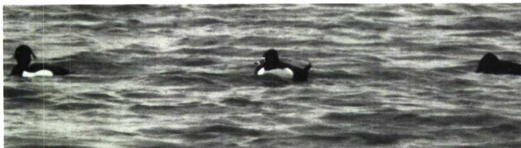
105 Ringsnaveleend Aythya collaris , Blokkersdijk, Antwerpen, België, april 1992 (Patrick Buys)

14 maart. Trekkende Ooievaarders vlogen op 6 maart over Essen-Heikant A, op 17 maart over Glabeek B en op 29 maart over Ronse Ovl (drie). Op 9 april waren er drie te Oostende en één te Zwijnaarde Ovl en op 10 april werd één exemplaar zowel te Oostende en te Bredene opgemerkt. Op 17 april vloog er één over Massenhoven A en op 19 april vlogen er drie over Zeebrugge. Op 22 en 23 april pleisterden er twee geringde Ooievaarders bij Gent Ovl. Op 26 april trokken er nog eens zeven over Korbeek-Lo B en één over Tessenderlo L en op 29 april trokken er nog eens vijf over Viersel A. Ook het wilde broedkoppel van Muizen A was weer aanwezig terwijl van het koppel bij Ravels A, net zoals vorig jaar, maar één vogel terugkeerde. Het mannetje Ringsnaveleend Aythya collaris liet zich nog de gehele periode – ook baltsend – bekijken op Blokkersdijk. Het overwinterende mannetje Witoogend A nyroca bleef nog bij Lier A aanwezig tot 8 april. De vogel van Beernem Wvl werd nog waargenomen tot 10 maart. In april dook zowel te Lier als te Blokkersdijk een hybride Kuifeend x Tafeleend A fuligula x ferina op. Een ver-binnenlands mannetje Ijseend Clangula hyemalis was van 7 maart tot ten minste 20 april aanwezig te Neerijse-Oud Heverlee B. Op de Gavers te Harelbeke Wvl zat tussen 1 en 26 maart weer