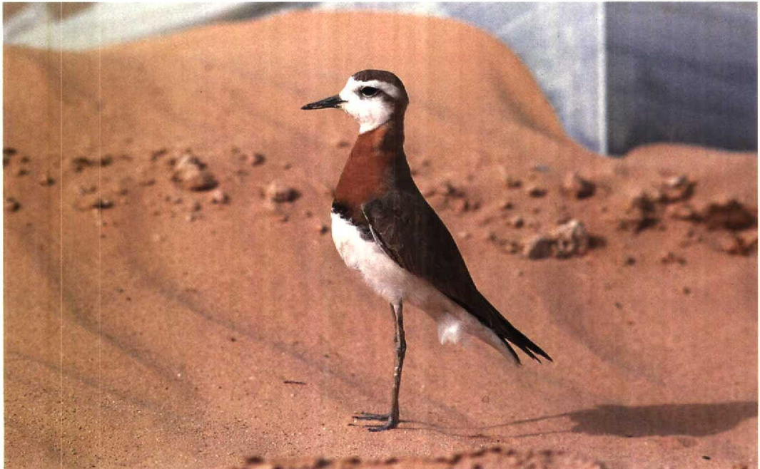
98 Caspian Plover Charadrius asiaticus , Yotvata, Israel, 19 March 1992