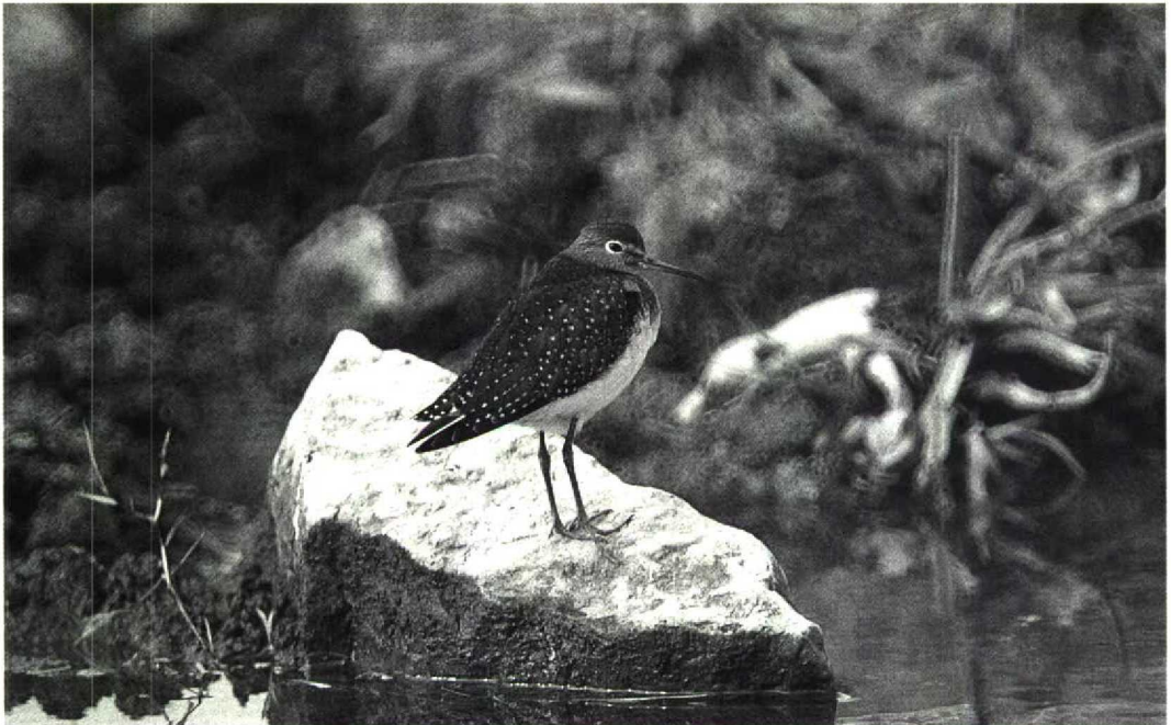
94 Solitary Sandpiper Tringa solitaria , Manitoba, Canada, August 1991

46 The bird in last issue's mystery photograph is obviously a wader and its smallish head, medium-length bill and relatively long green legs enable us to identify this as one of the smaller Tringa sandpipers of which five occur in the Western Palearctic. The bird is reasonably slim with a slightly thickened bill that decurves gently in the distal third, a startling white eye-ring joining a short pale supercilium only present in front of the eye and