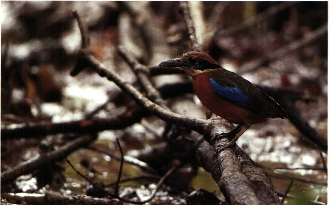
96 Mangrovepitta Pitta megarhyncha , Kuala Selangor, Maleisië, 13 april 1989 (Frank Rozendaal)