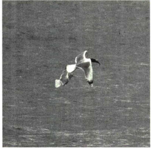
100 Great Black-headed Gull Larus ichthyaeetus , Spree-tausee Spremberg, Brandenburg, Germany, March 1992 (Jochen Dierschke)

many, remained until 4 April (cf Dutch Birding 14: 64, 1992). In Finland, up to three single Azure Tits Parus cyanus were staying from 19 April onwards. In Germany, a Wallcreeper Tichodroma muraria was present for the fourth winter in succession, from 29 December 1991 onwards, alternately on the seminary and the basilica in Trier, Rheinland Pfalz (10 km from the Luxembourg border). A first-winter male Pine Grosbeak Pinicola enucleator present in gardens at Lerwick, Shetland, from 25 March to at least 25 April was the first British record since May 1975. On 2 February, eight Snow Buntings Plectrophenax nivalis were seen at the delta of the Kizilirmak, on the Black Sea coast east of Balik Gölü, constituting the first record for Turkey since at least 1966. A Cirl Bunting Emberiza cirlus shortly seen and photographed at the Breskens observation post on 16 May was the first record since 1901 for the Netherlands. Unseasonal Rustic Buntings E rustica were found at Logbiermé, Liège, Belgium, on 21 March, and at New Saltfleetby, Lincolnshire, England, on 22 March.