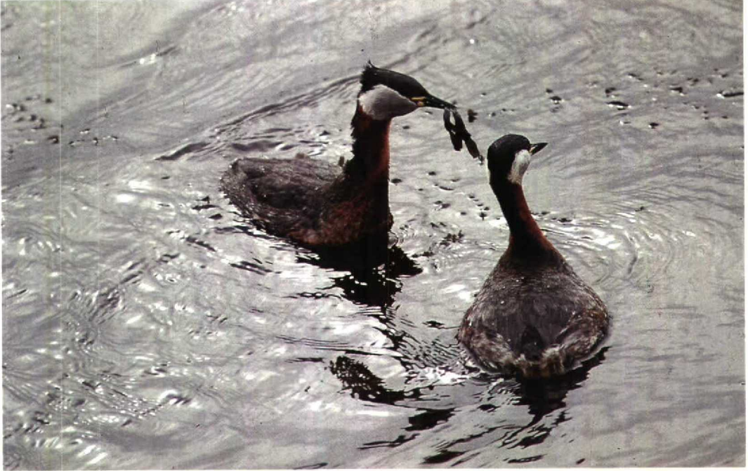
101 Roodhalsluten Podiceps grisegena , IJmuiden, Noordholland, maart 1992 (Piet Munsterman)