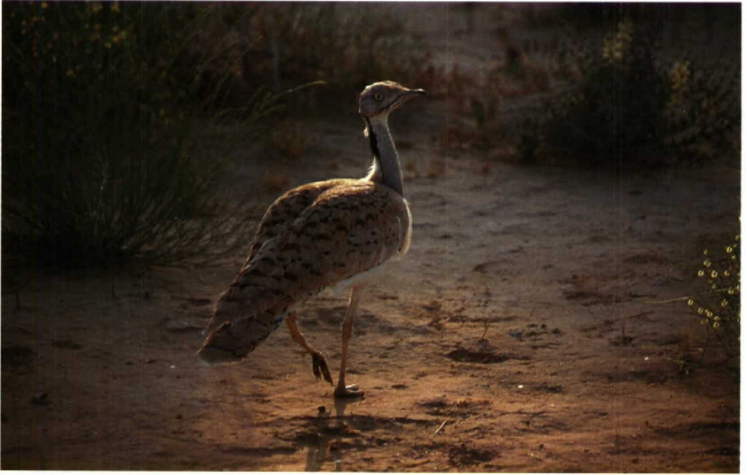
85 Houbara Bustard Chlamydotis undulata , southern Uzbekistan, May 1988