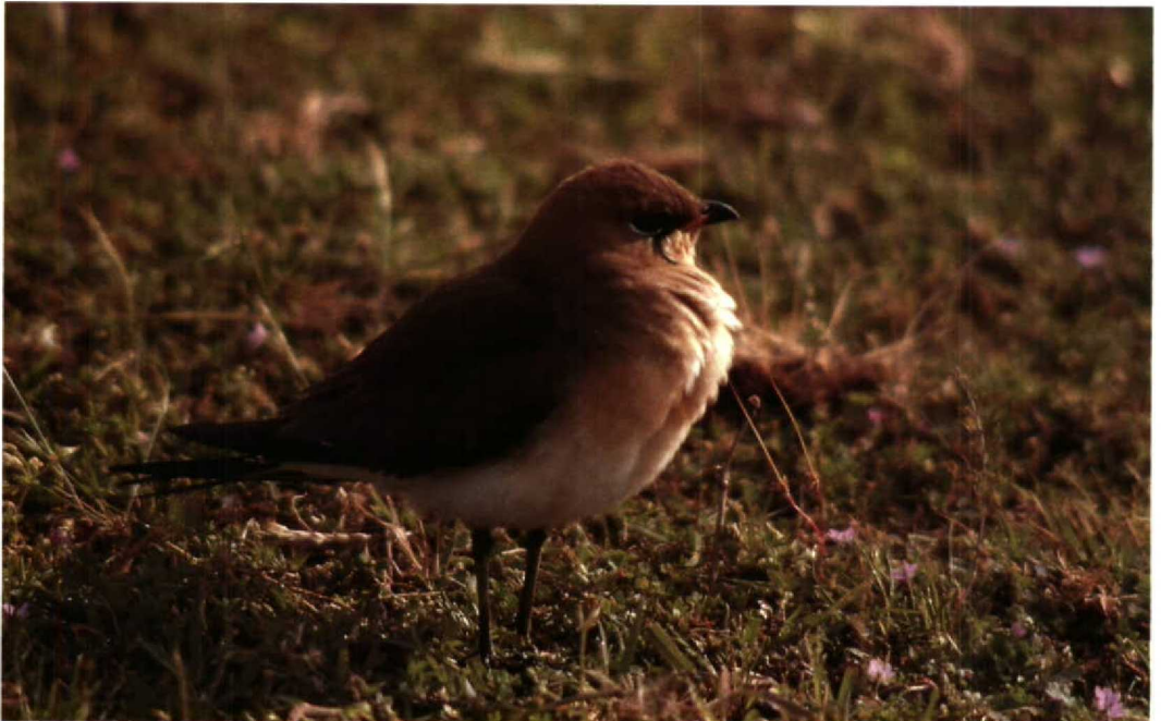
86 Black-winged Pratincole Glareola nordmanni , Lenkoran region, Azerbaydzhan, May 1988 (Henrikas Sakalauskas)