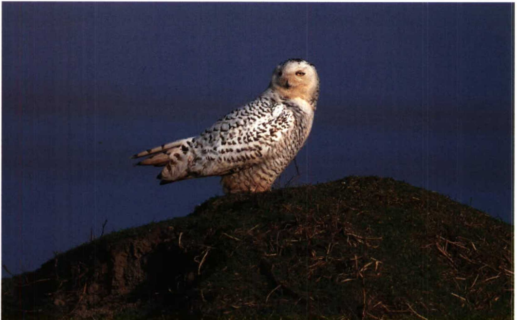
104 Sneeuwuil Nyctea scandiaca , Maasvlakte, Zuidholland, maart 1992 (Frank Dröge)

UILEN TOT GORZEN De Sneeuwuil Nyctea scandiaca die op 8 maart werd ontdekt op de Maasvlakte bleef daar aanwezig tot 3 april. Op 5 april werd er één gezien bij