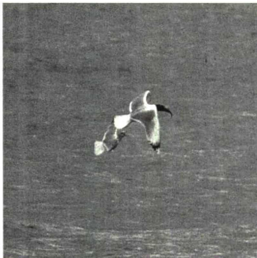
100 Great Black-headed Gull Larus ichthyaeetus , Spree-tausee Spremberg, Brandenburg, Germany, March 1992

many, remained until 4 April (cf Dutch Birding 14: 64, 1992). In Finland, up to three single Azure Tits Parus cyanus were staying from 19 April onwards. In Germany, a Wallcreeper Tichodroma muraria was present for the fourth winter in succession, from 29 December 1991 onwards, alternately on the seminary and the basilica in Trier, Rheinland Pfalz (10 km from the Luxembourg border). A first-winter male Pine Grosbeak Pinicola enucleator present in gardens at Lerwick, Shetland, from 25 March to at least 25 April was the first British record since May 1975. On 2 February, eight Snow Buntings Plectrophenax nivalis were seen at the delta of the Kizilirmak, on the Black Sea coast east of Balik Gölü, constituting the first record for Turkey since at least 1966. A Cirl Bunting Emberiza cirlus shortly seen and photographed at the Breskens observation post on 16 May was the first record since 1901 for the Netherlands. Unseasonal Rustic Buntings E rustica were found at Logbiermé, Liège, Belgium, on 21 March, and at New Saltfleetby, Lincolnshire, England, on 22 March.