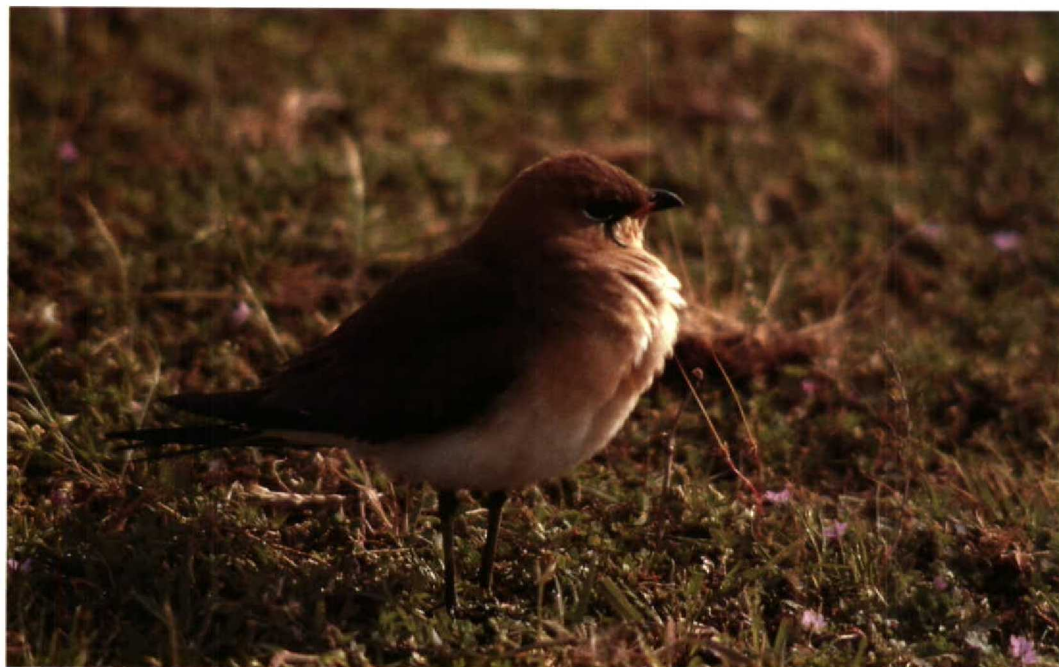
86 Black-winged Pratincole Glareola nordmanni , Lenkoran region, Azerbaydzhan, May 1988 (Henrikas Sakalauskas)