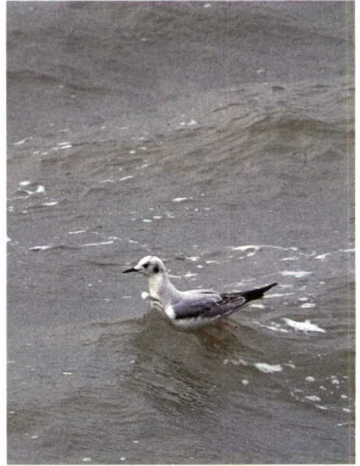
72 Iceland Gull Larus glaucooides , Ijmuiden, Noordholland, February 1990 (Hans Gebuis) 73 Bonaparte's Gull Larus philadelphia , first-winter, Ritthem, Zeeland, 19 February 1990 (Arnoud B van den Berg) 74 Ivory Gull Pagophila eburnea , first-winter (swimming!), Stellendam, Zuidholland, 17 January 1990 (Arnoud B van den Berg)