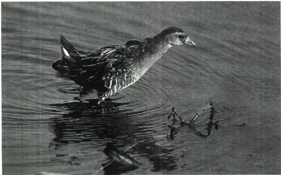
25 Sora Porzana carolina , St Mary's, Scilly, Britain, October 1991