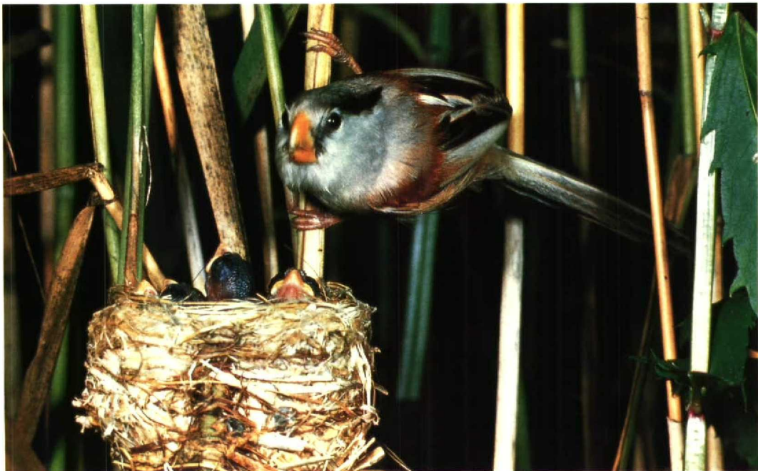
22 Polivanov's Parrotbill Paradoxornis polivanovi , Lake Khanka, Ussuriland, June 1982 (Yuri B Shibnev)