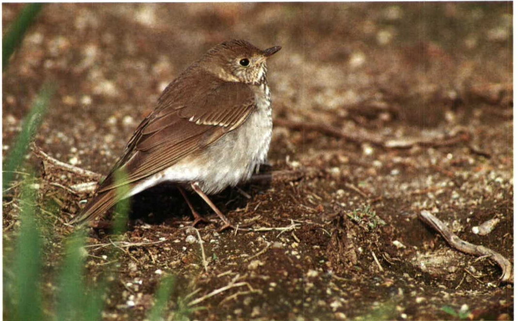
31 Gray-cheeked Thrush Catharus minimus , Scilly, Britain, October 1991