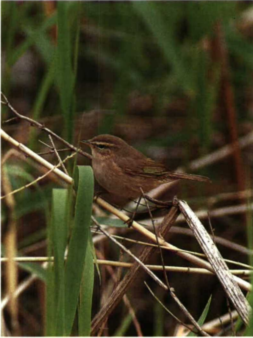
15 Dusky Warbler Phylloscopus fuscatus , Beidaihe, China, May 1990 (Colin Bradshaw)