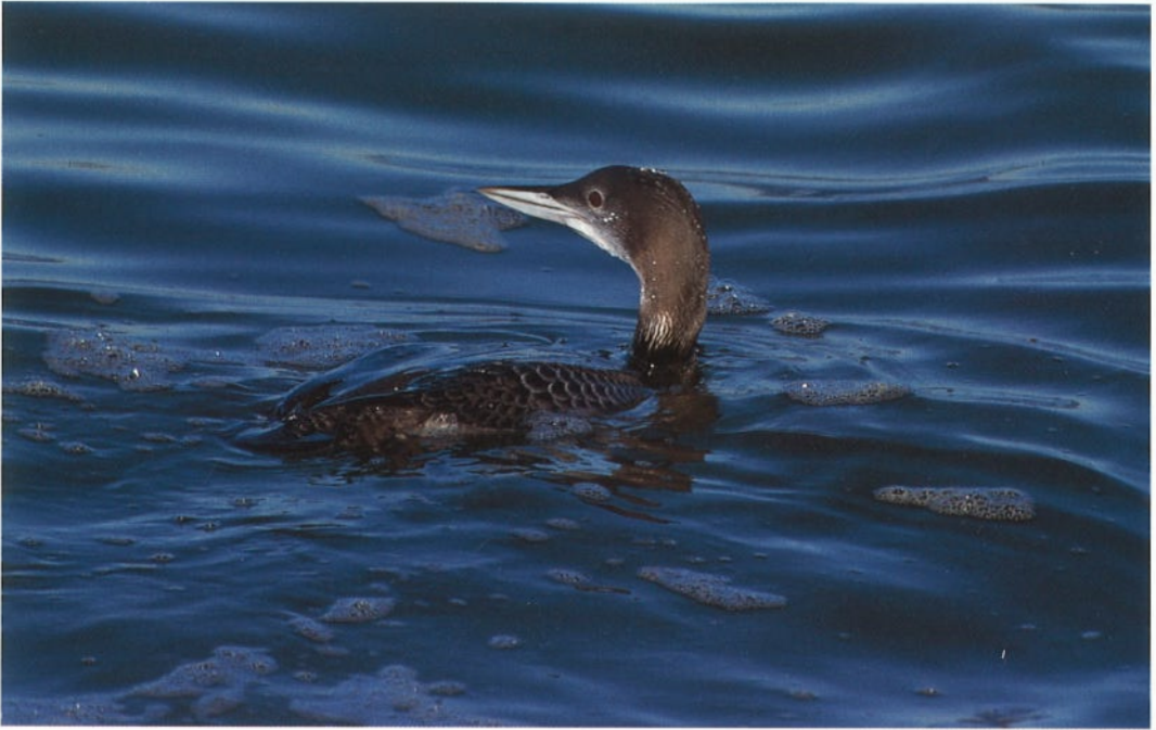
37 Ijsduiker Gavia immer , IJmuiden, Noordholland, maand 1991 (Henk Harmsen)