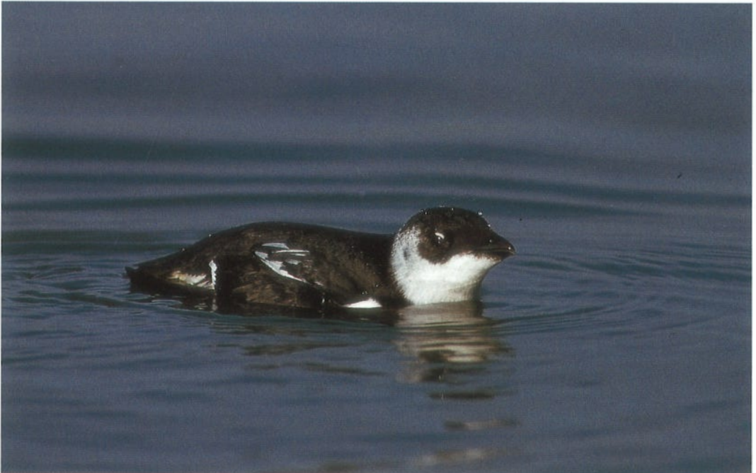
38 Kleine Alk Alle alle , Pampushaven, Flevoland, december 1991