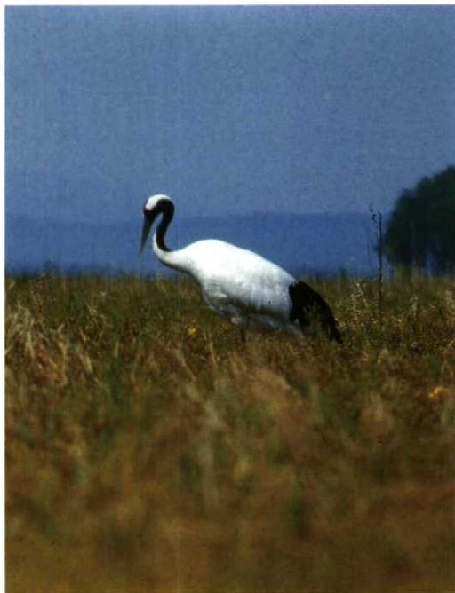
18 Japanese Crane Grus japonensis , lower reaches of Bikin river, Ussuriland, May 1983 (Yuri B Shibnev)