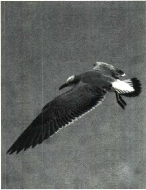
23 Laughing Gull Larus atricilla , Walcott, Norfolk, Britain, December 1991