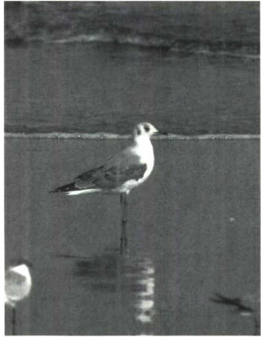
3-4 Grey-headed Gull Larus cirrocephalus , first-winter plumage, The Gambia, November 1988 ( Hadoram Shirihai )