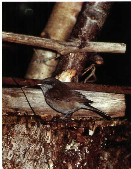
40 Braamsluiper Sylvia curruca , met kenmerken van S. c. blythi , Huizen, Noordholland, Nederland, 30 december 1991 (Arnoud B van den Berg)

Fr en de gehele periode bij de Brouwersdam. Uniek voor Noordwesteuropa was het verblijf van een Witwangstern Chlidonias hybridus bij Lelystad Fl vanaf 14 december. Later werd duidelijk dat het twee exemplaren betrof. Ook aardig buiten de normale tijd waren de waarnemingen van Witvleugelsterns C leucopterus op 6 en 7 november bij de Haven van Oude Zeug Nh en op 20 november langs de Oostvaardersdijk. Van dit laatste exemplaar is bekend dat het zich grotendeels in zomerkleed bevond. Tot de derde week van november werden nog zeker 140 Kleine Alken Alle alle gemeld. Vooral de Zuidpier van IJmuiden was een goede waarnemingsplaats. In de Pampushaven Fl liet een Kleine Alk zich van 14 november tot ver in december zien. In die periode werd te Rotterdam Zh een exemplaar aangetroffen onder een geparkeerde auto. In december verbleven naar verluid voor de kust van Westkapelle nog tientallen Kleine Alken in gezelschap van enkele Papegaaiduikers Fratercula arctica . Andere Papegaaiduikers werden langsvliegend gemeld bij Camperduin in november (zes) en december (één) en op 6 december bij Scheveningen.