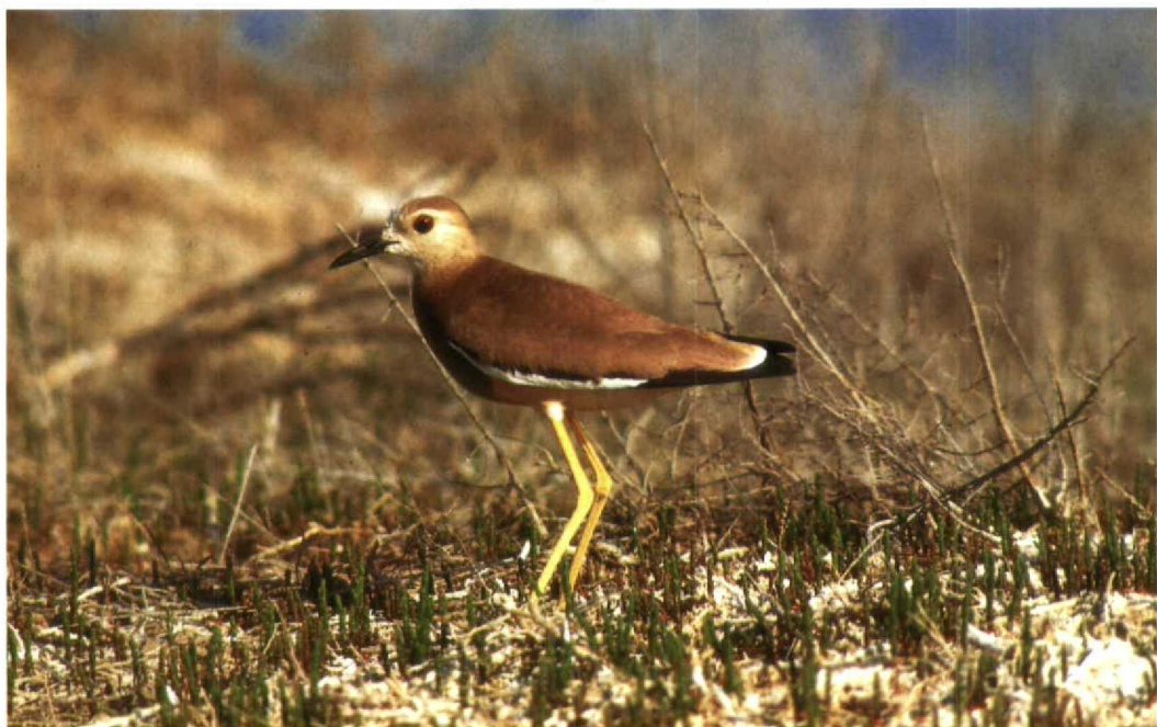
20 White-tailed Plover Chettusia leucura , Bukhara region, Uzbekistan, May 1988 (Algirdas J Knystautas)