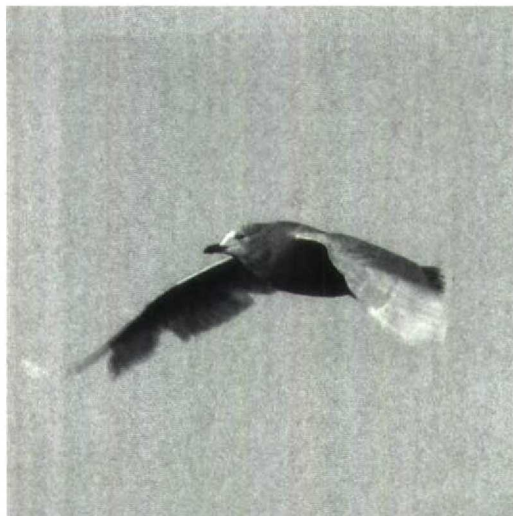
33 Kleine Burgemeester Larus glaucooides , Weurt, Gelderland, december 1991 (Carl Derks)

andere melding betreft een exemplaar tot 9 december in de Dordtse Biesbosch. In de periode werden c 25 pleisterende Slechtvalken Falco peregrinus gemeld.