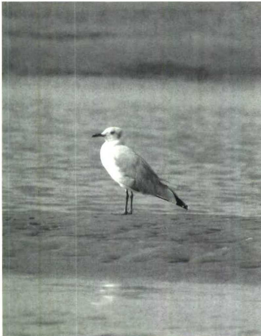
6 Grey-headed Gull Larus cirrocephalus , adult-summer plumage, The Gambia, November 1988