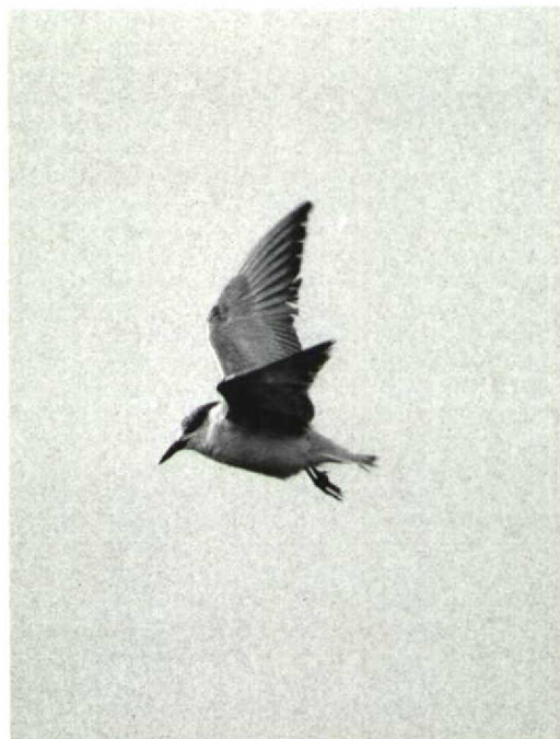
35 Witwangstern Chlidonias hybridus , Oostvaardersdijk, Flevoland, december 1991 (Arnold Meijer)