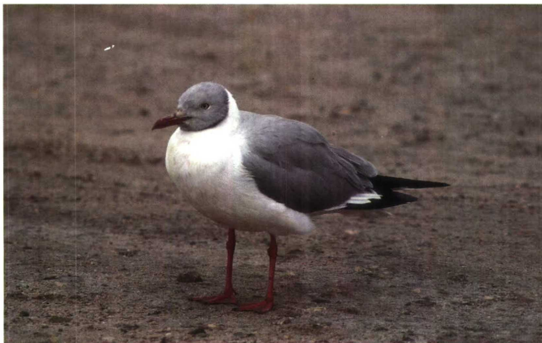
1 Grey-headed Gull Larus cirrocephalus , second-summer plumage, Eilat, Israel, 15 March 1989