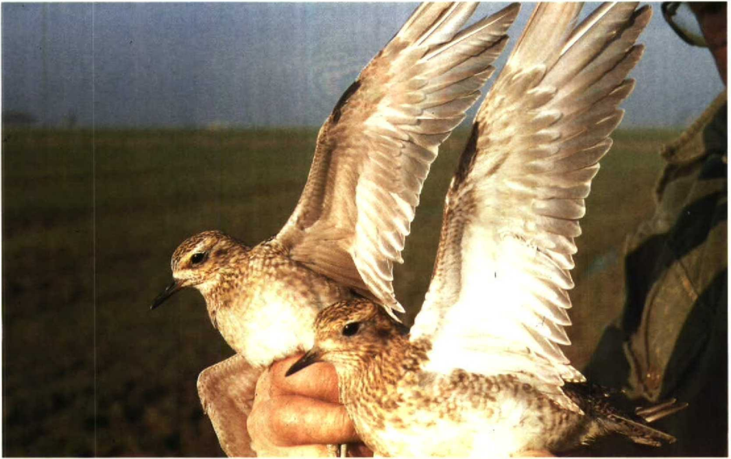
12-13 Kleine Goudplevier Pluvialis fulva (links) en Goudplevier P. apricaria , Abbega, Friesland, 9 november 1990 (loop Jukema)