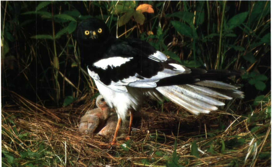
17 Pied Harrier Circus melanoleucus , Ussuriland, July 1985 (Yuri B Shibnev)

As for the birds of these areas, cranes and waders will come first. Almost all crane species live in