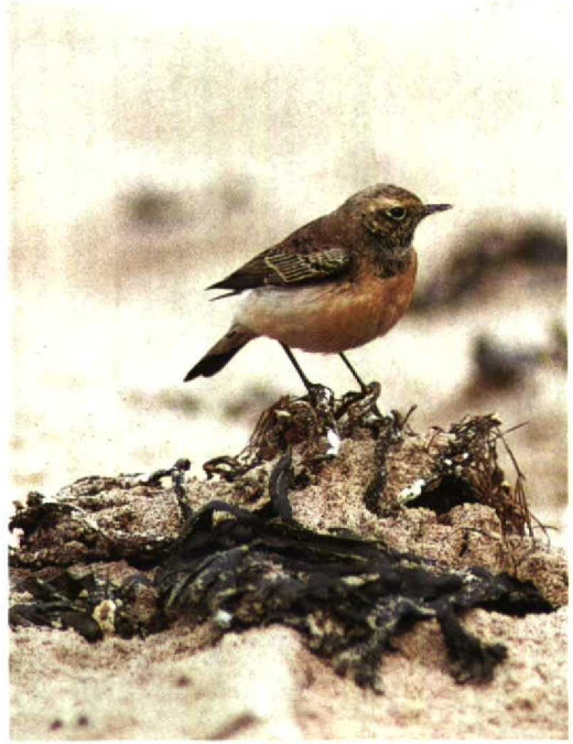
26 Red-wattled Plover Hoplopterus indicus , Eilat, Israel, December 1991 ( Hadoram Shirihai ) 27 Pied Wheatear Oenanthe pleschanka , Lothian, Britain, October 1991 ( Colin Bradshaw ) 28 Lanceolated Warbler Locustella lanceolata , Zeebrugge, Westvlaanderen, Belgium, 5 October 1991 ( Luc Verroken ) 29 Siberian Rubythroat Luscinia calliope , first-winter female, Norrskär, Finland, 15 October 1991 ( Jouni Riihimäki )