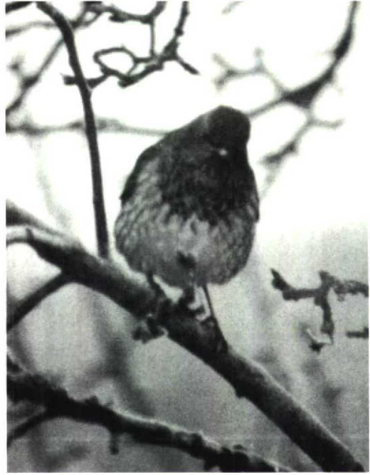
24 Black-throated Thrush Turdus ruficollis , first-winter male, Sjaelland, Denmark, December 1991 (Jens F Thomsen)