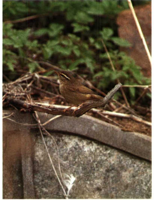
16 Radde's Warbler Phylloscopus schwarzi , Beidaihe, China, May 1990 (Colin Bradshaw)

Mystery photograph 45. Solution in next issue