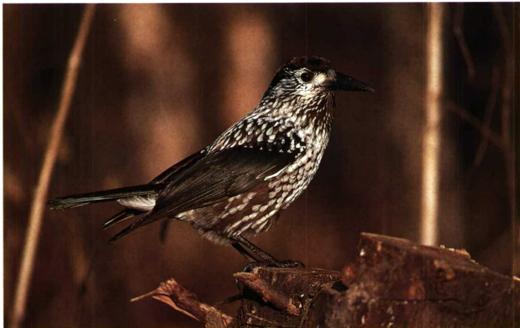
39 Notekraker Nucifraga caryocatactes , Vlaardingen, Zuidholland, december 1991