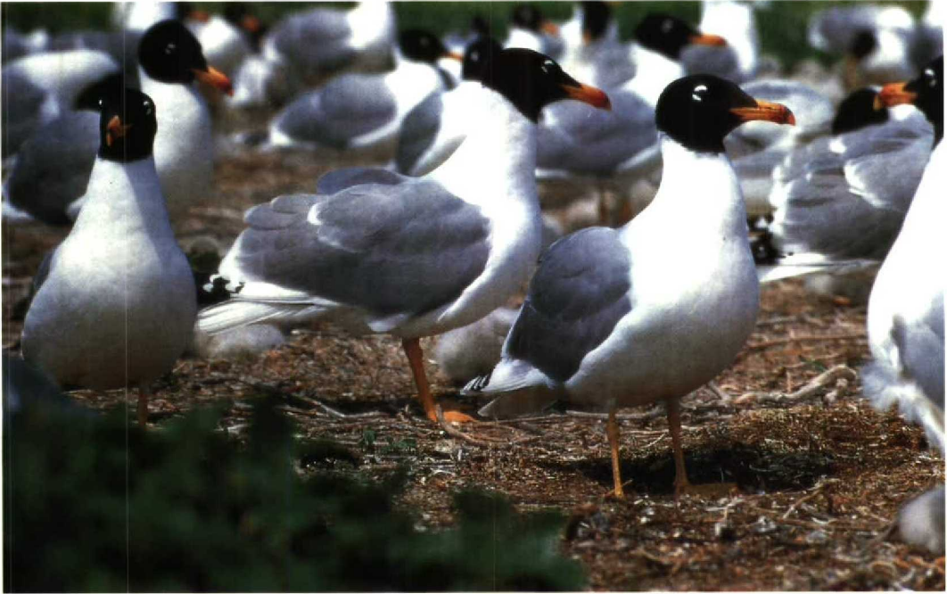
21 Great Black-headed Gulls Larus ichthyæetus , Bay of Sivash, Ukraine, May 1982 (V Siokhin)