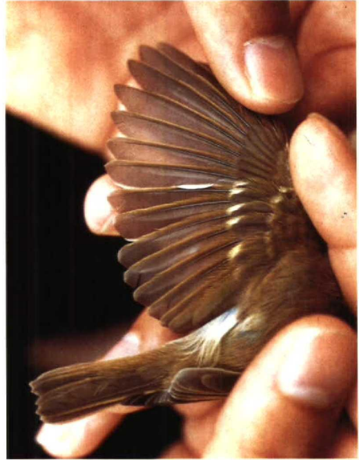
7-8 Swinhoes Boszanger Phylloscopus plumbeitarsus , Castricum, Noordholland, 17 september 1990 (Rieuwert Schekkerman)

beschouwen plumbeitarsus als een ondersoort van P. trochiloides .