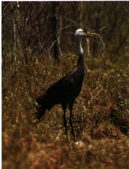
19 Hooded Crane Grus monacha , Bikin river valley, Ussuriland, May 1984 (Yuri B Shibnev)