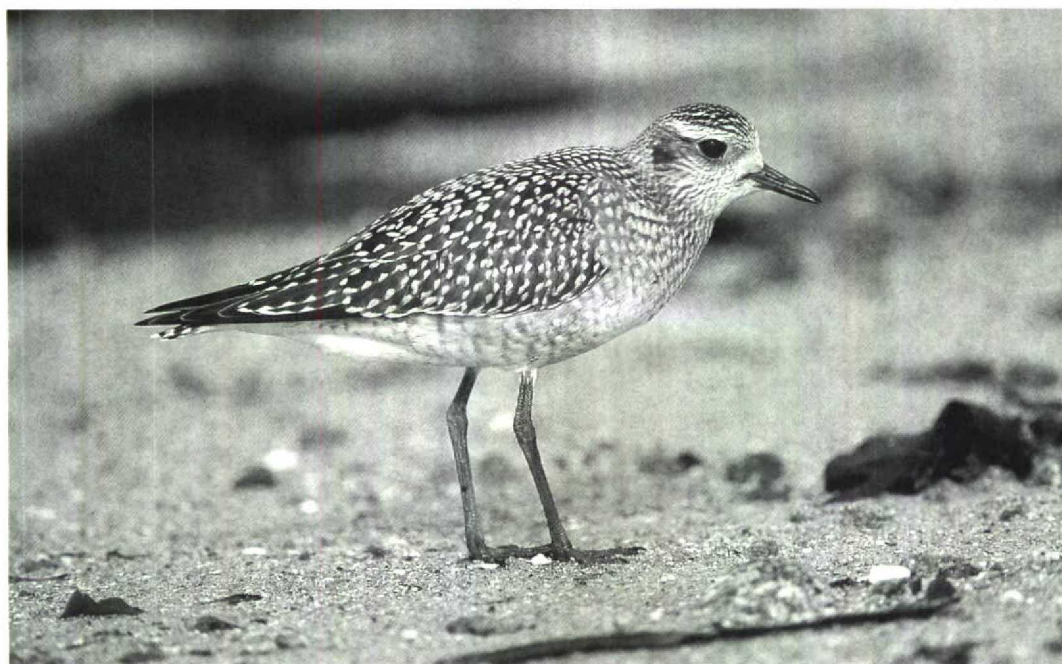
32 American Golden Plover Pluvialis dominica , juvenile, Scilly, Britain, October 1991