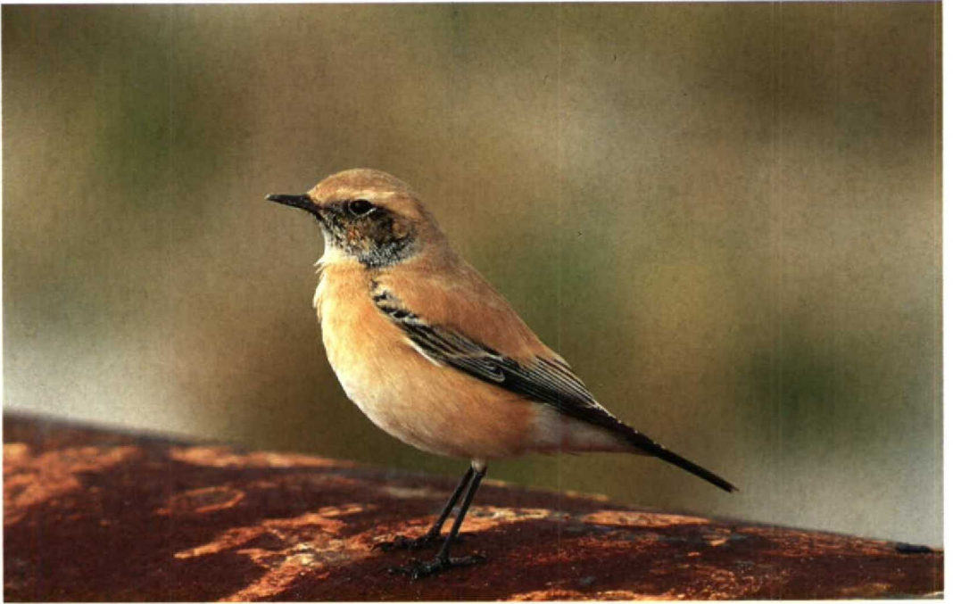
30 Desert Wheatear Oenanthe deserti , Zeebrugge, Westvlaanderen, Belgium, October 1991