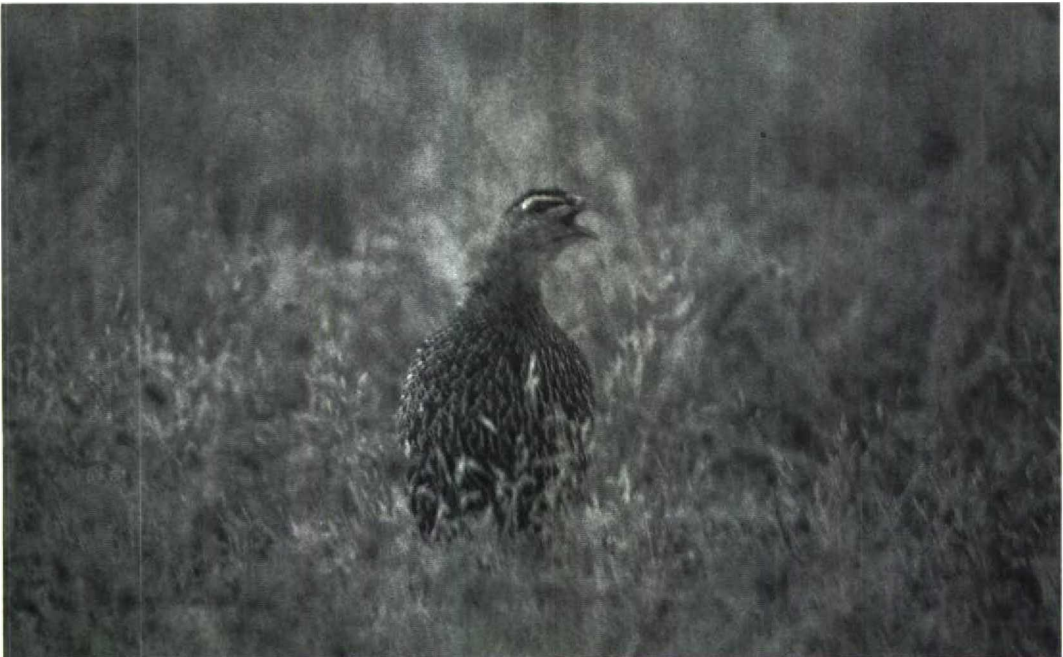
9 Moroccan Double-spurred Francolin Francolinus bicalcaratus ayasha , Rabat, Morocco, July 1987