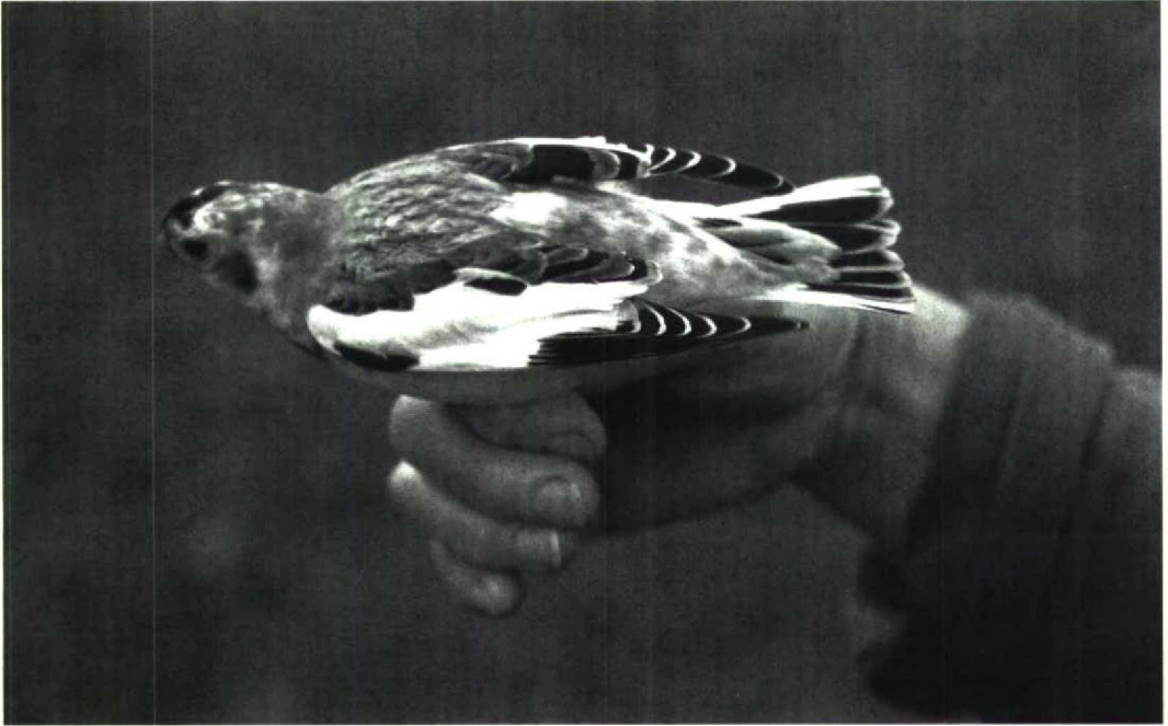
10-11 Sneeuwgors Plectrophenax nivalis , adult mannetje in winterkleed, Sint Jacobiparochie, Friesland, 13 november 1989 (Joop Jukema)