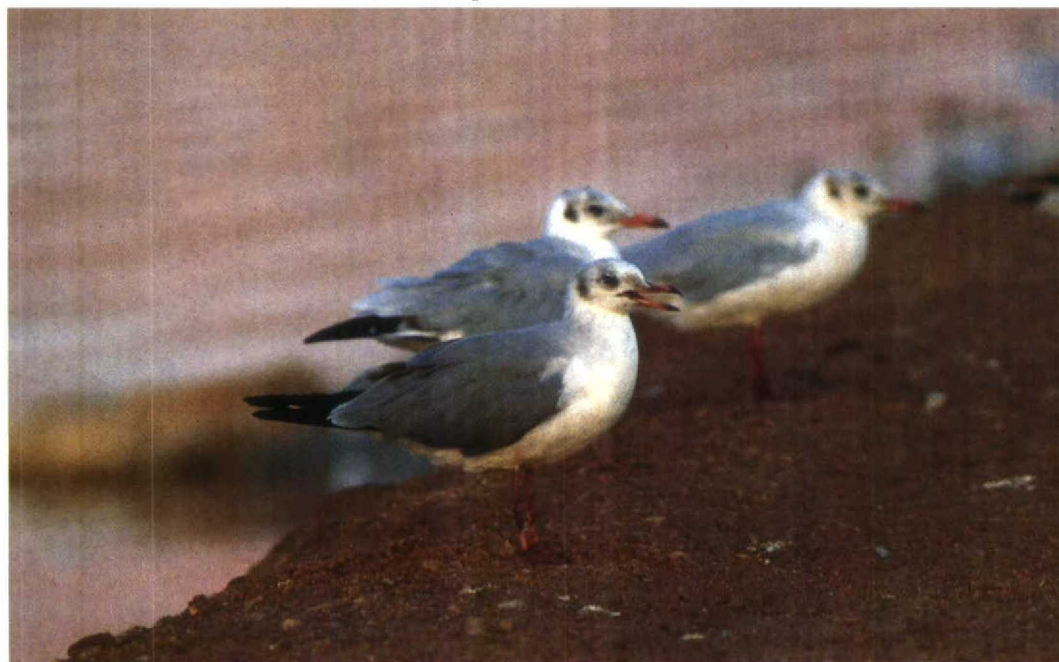
2 Grey-headed Gull Larus cirrocephalus , first-summer/second-winter plumage, and Black-headed Gulls L. ridibundus , Eilat, Israel, August 1989 (Hadoram Shirihai)