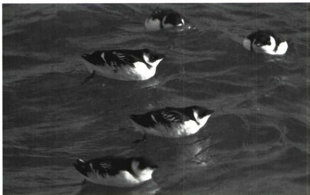
36 Kleine Alken Alle alle , Lauwersoog, Groningen, 9 november 1991 (Emo Klunder)