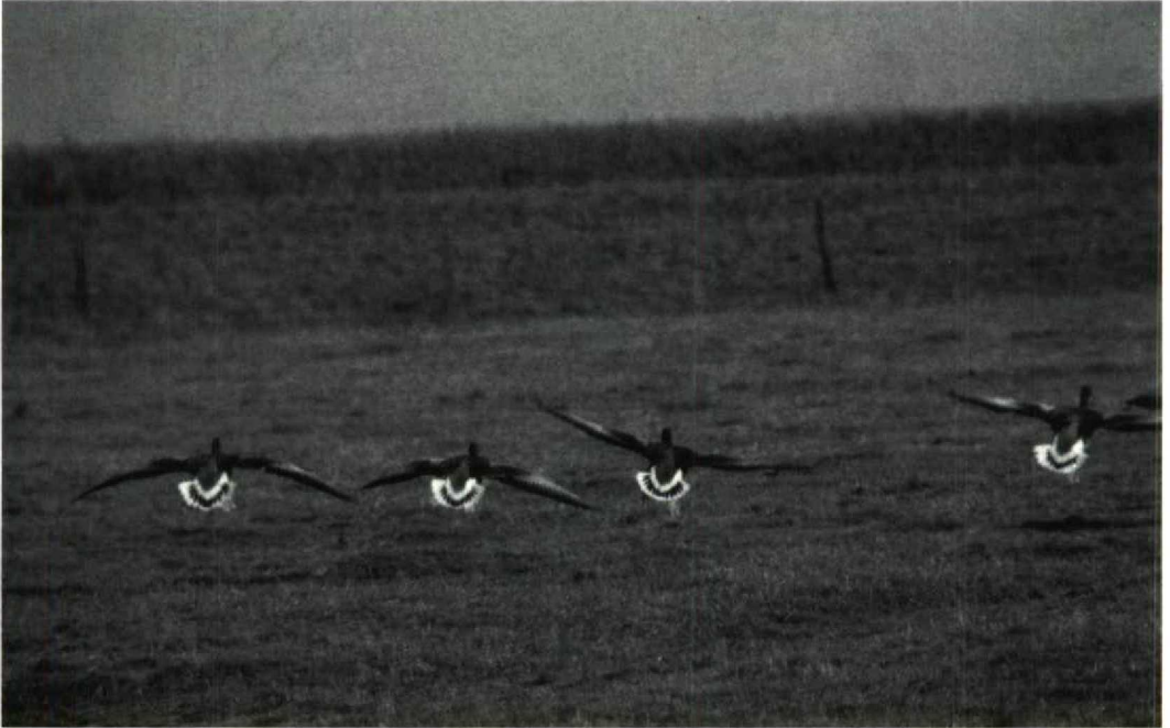
Mystery photograph 41. Solution in next issue

Arnoud B van den Berg, Duinlustparkweg 98, 2082 EG Santpoort-Zuid, Netherlands