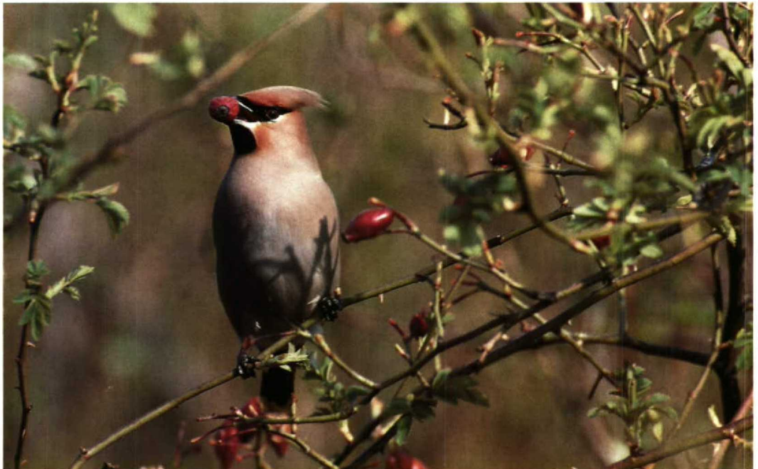
120 Pestvogel Bombycilla garrulus , Almere, Flevoland, april 1991 (Hans Gebuis)