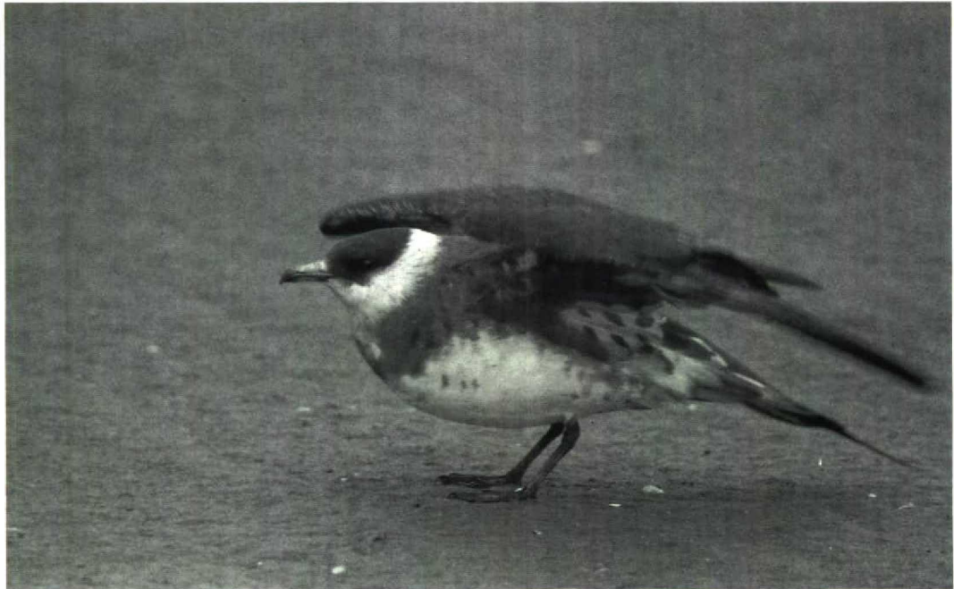
106 Arctic Skua Stercorarius parasiticus , Maasvlakte, Zuidholland, August 1981