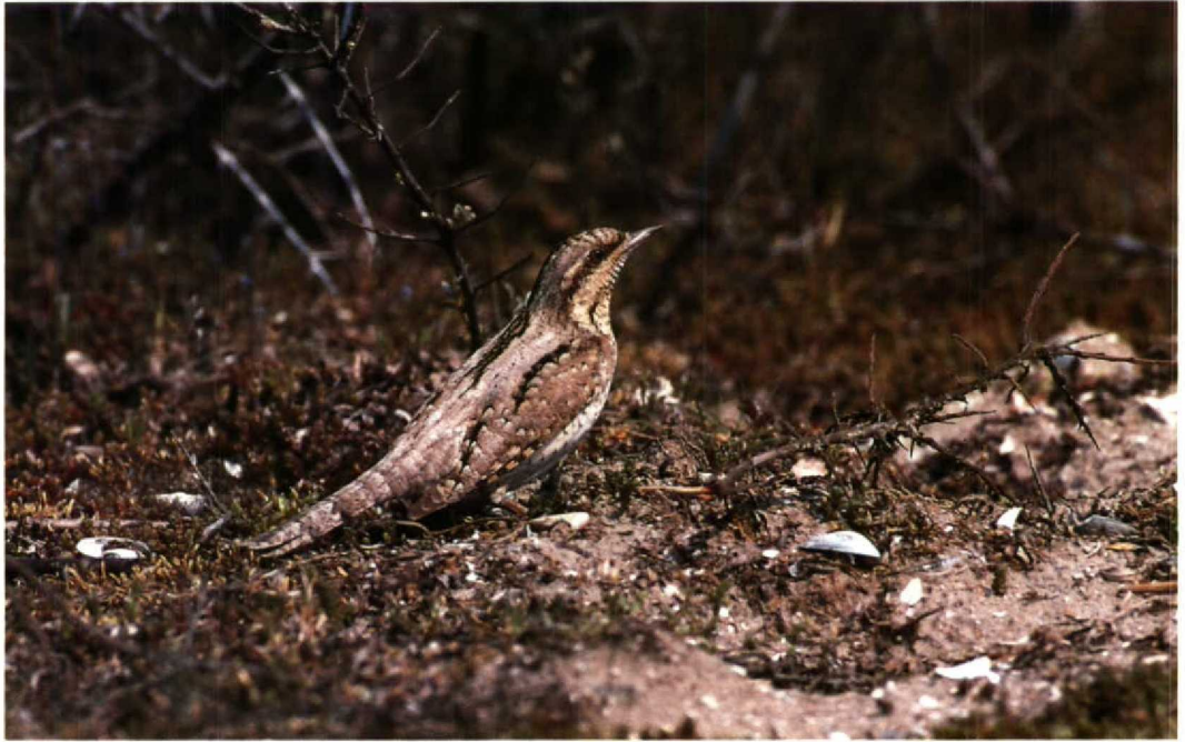
119 Draaihals Jynx torquilla , Maasvlakte, Zuidholland, april 1991 (Hans Gebuis)