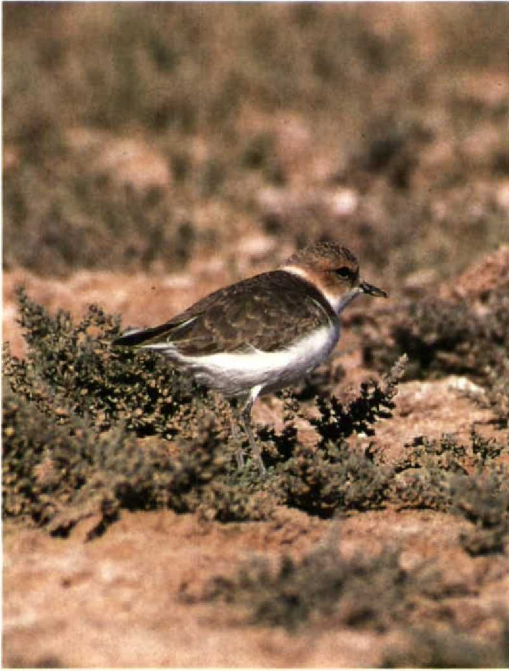
111 Kittlitz's Sand Plover Charadrius pecuarius , Lake Merzouga, Morocco, January 1991 ( Hans Gebuis )