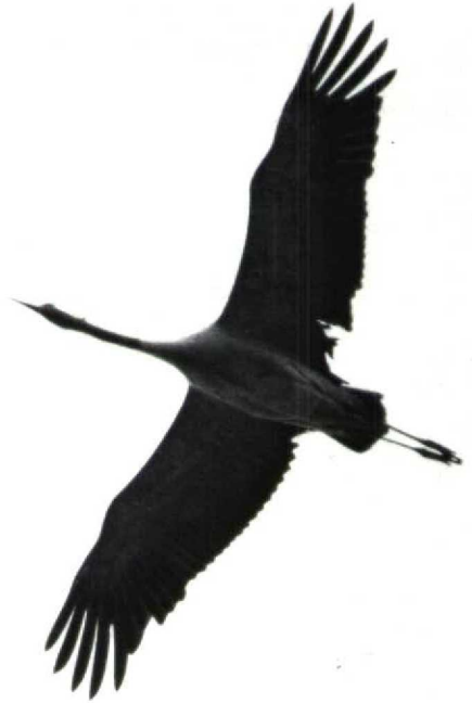
91 Demoiselle Crane Anthropoides virgo , Tselinograd, USSR, May 1989. Note proportions of wing, short tail and how far down black breast reaches 92 Crane Grus grus , sine loco, sine dato. Wing usually has more even width than in Demoiselle Crane (but variations occur). Regularly, wing narrows near body 93 Cranes Grus grus , Västervik, Sweden, May 1973. Note difficulty in assessing how far black of neck extends