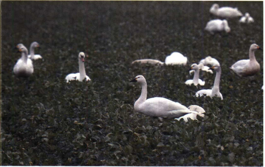
39 Kleine Zwaan Cygnus columbianus , met kenmerken van Fluitzwaan C. c. columbianus , Oostvaardersdijk, Flevoland, december 1990 (Arnoud B van den Berg) 40 Ross' Gans Anser rossii , Plaat van Scheelhoek, Zuidholland, december 1990 (Frank Dröge)