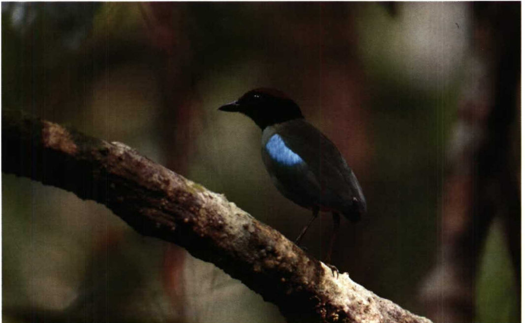
14 Hooded Pitta Pitta sordida cucullata, Ban Tieu, Khao Phra Bang Kham, Krabi province, Thailand, 5 May 1989