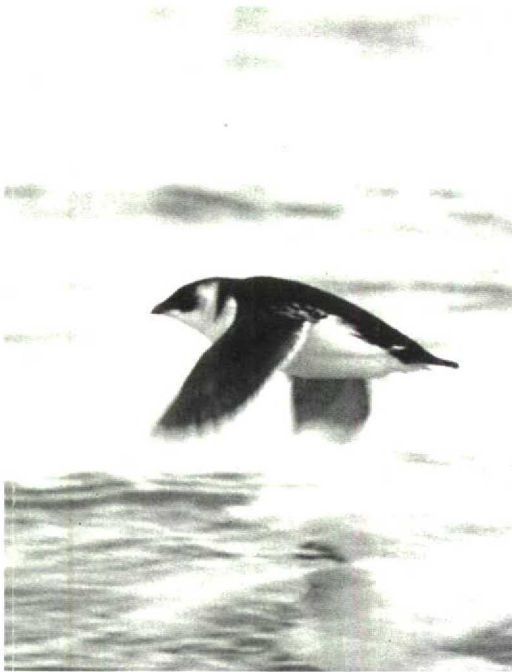
42 Kleine Alk Alle alle , Maasvlakte, Zuidholland, december 1990 (Arie Ouwerkerk)