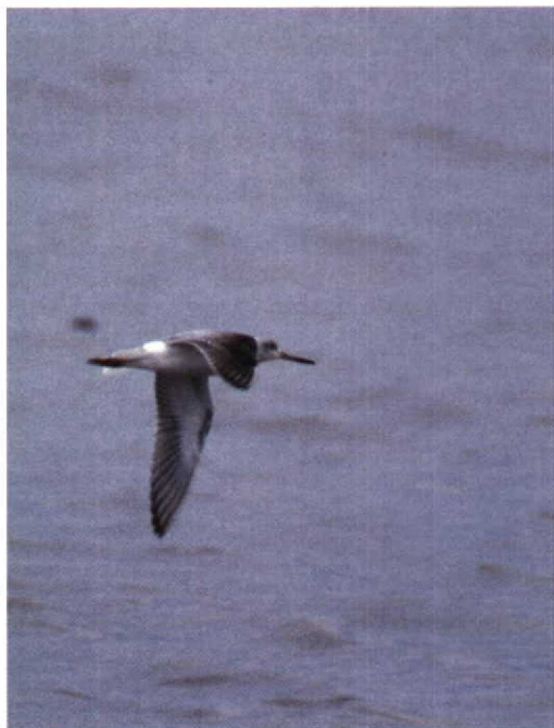
5 Nordmann's Greenshank Tringa guttifer , juvenile, Japan, September 6 Nordmann's Greenshank Tringa guttifer , in flight, showing white underwing-coverts and foot projection beyond tip of tail, Mai Po, Hong Kong, October 1988

cularly noticeable towards the tip where the fringe becomes wider. However, the lesser coverts are darker and produce a dark carpal patch. As a result, the greater and median coverts appear paler than the mantle and scapulars which are similar in colour but display a narrower notched fringe. The tertials resemble those of an adult in summer plumage but are brown instead of dark grey and the notches are smaller but more numerous. As in adult birds, usually two or three primaries are visible beyond the longest tertial.