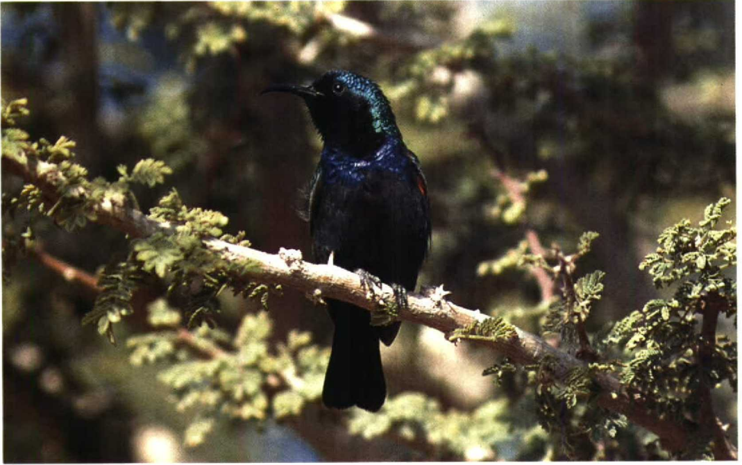
23 Palestine Sunbird Nectarinia osea , Eilat, Israel, March 1990 (René Pop) 24 Caspian Plover Charadrius asiaticus , Eilat, Israel, March 1990 (René van Rossum) 25 Cyprus Warbler Sylvia melanothorax , Eilat, Israel, March 1990 (René Pop)