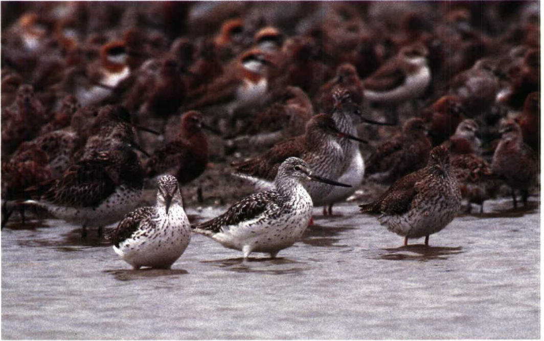
1 Nordmann's Greenshank Tringa guttifer , two (in foreground) very strongly marked adults in summer plumage with blackish centres to scapulars and tertials, Mai Po, Hong Kong, April 1990 (Ray Tipper) 2 Nordmann's Greenshank Tringa guttifer , strongly marked adult in summer plumage, Mai Po, Hong Kong, April 1990 (Ray Tipper)