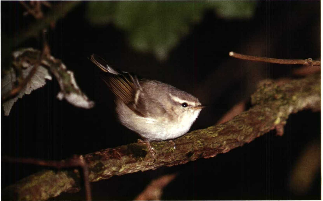
37 Hume's Yellow-browed Warbler Phylloscopus humei , De Blocq van Kuffeler, Flevoland, December 1990 (Arnoud B van den Berg)

From 29 November to 5 December, a confiding first-winter female Desert Wheatear O deserti remained on Southwold beach, Suffolk, Britain. Finland produced a Black-throated Thrush Turdus rufo-collis atrogularis at Nurmijärvi on 20 November. A Lanceolated Warbler Locustella lanceolata was reported on Ouessant, Finistère, on 28 October (the third record for France if accepted). A male Sardinian Warbler Sylvia melanocephala was seen at Porthgwarra, Cornwall, Britain, on 3 November. In November, there was an influx of Hume's Yellow-browed Warblers Phylloscopus humei , affecting Britain (at least one bird), the FRG (one bird) and the Netherlands (no less than four birds). This coincided with an apparent influx of other eastern warblers such as Pallas's Proregulus , Yellow-browed P inornatus , Radde's P schwarzi and Dusky Warblers P fuscatus . A Dusky Warbler in the HW-duinen, Zuidholland, from 29 November to 4 December meant the first December record for the Netherlands. Three Siberian Nuthatches Sitta europaea asiatica were caught at Pape on 27 and 28 October and 5 November, respectively, being the second to fourth records for Latvia. A Wallcreeper Tichodroma muraria returned to winter in Amsterdam-Buitenveldert, Noordholland, the Netherlands, on 27 November, again roosting behind the