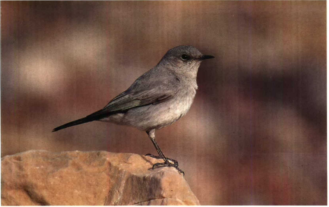
28 Blackstart Cercomela melanura , Eilat, Israel, March 1990 (René Pop) 29 Rüppell's Warbler Sylvia rueppelli , Eilat, Israel, March 1990 (René Pop)