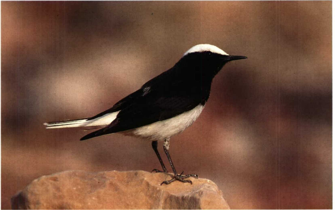
26 Hooded Wheatear Oenanthe monacha , Eilat, Israel, March 1990 (René Pop) 27 White-crowned Black Wheatear Oenanthe leucopyga , Eilat, Israel, March 1990 (René Pop)