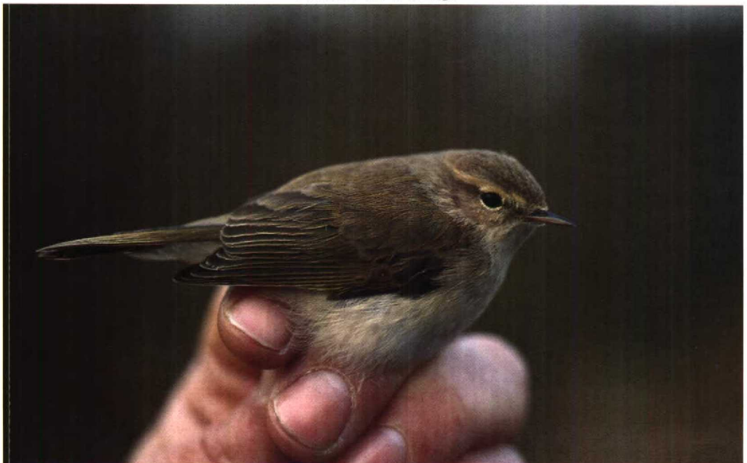
43 Scandinavische Tjiftjaf Phylloscopus collybita abietinus , De Blocq van Kuffeler, Flevoland, december 1990