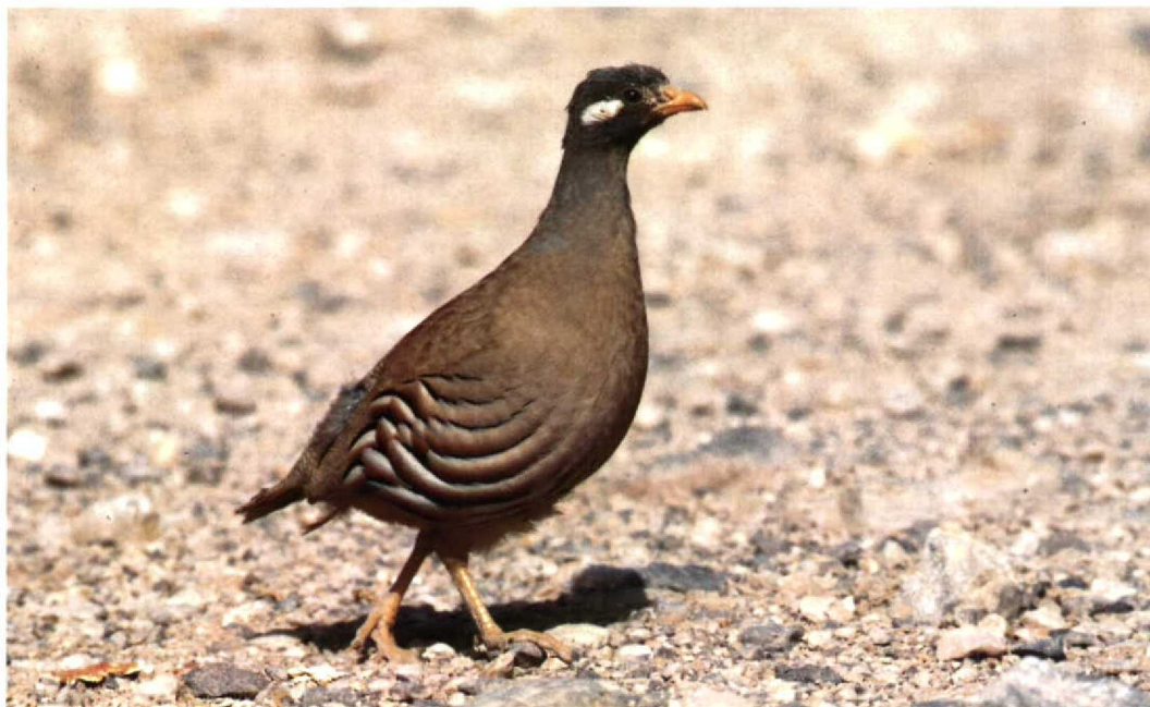
16 Sand Partridge Ammoperdix heyi , Eilat, Israel, March 1990 (René Pop) 17 Cream-coloured Courser Cursorius cursor , Yotvata, Israel, March 1990 (René Pop)