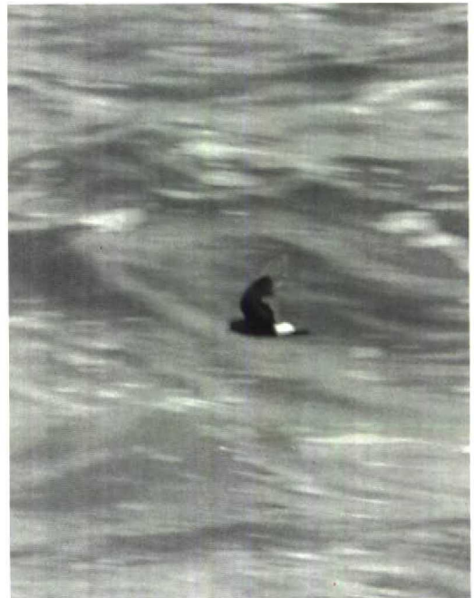
7 Wilson's Petrel Oceanites oceanicus , Spain, 30 July 1985 (Arnoud B van den Berg)

records of this species for France this century (Dubois & Comité d'Homologation National 1987). Our observations of no less than 18 Wilson's Petrels off the Egyptian Red Sea coast and in Suez Bay, Egypt, during 9-16 July 1985, including a flock of seven in the morning of 11 July 1985 (Ben Haase et al in Goodman & Meininger 1989, van den Berg et al 1991), suggest that July 1985 was an exceptional month for the northward movement of Wilson's Petrels. Normally, the species rarely reaches the northern shores of the Red Sea, and there were no previous records for Suez Bay and just one for Eilat, Israel (Shirihai 1987). Presumably, however, these birds originated from another population than the European birds, and it is more likely that the lack of French (and Western Palearctic) records is explained by the small number of observers participating in pelagic trips. This is also indicated by the increase of records since 1983 resulting from pelagic trips in August-September off Ireland and Cornwall, Great Britain (eg, Br Birds 81: 539-540, 1988; Harrison 1988).