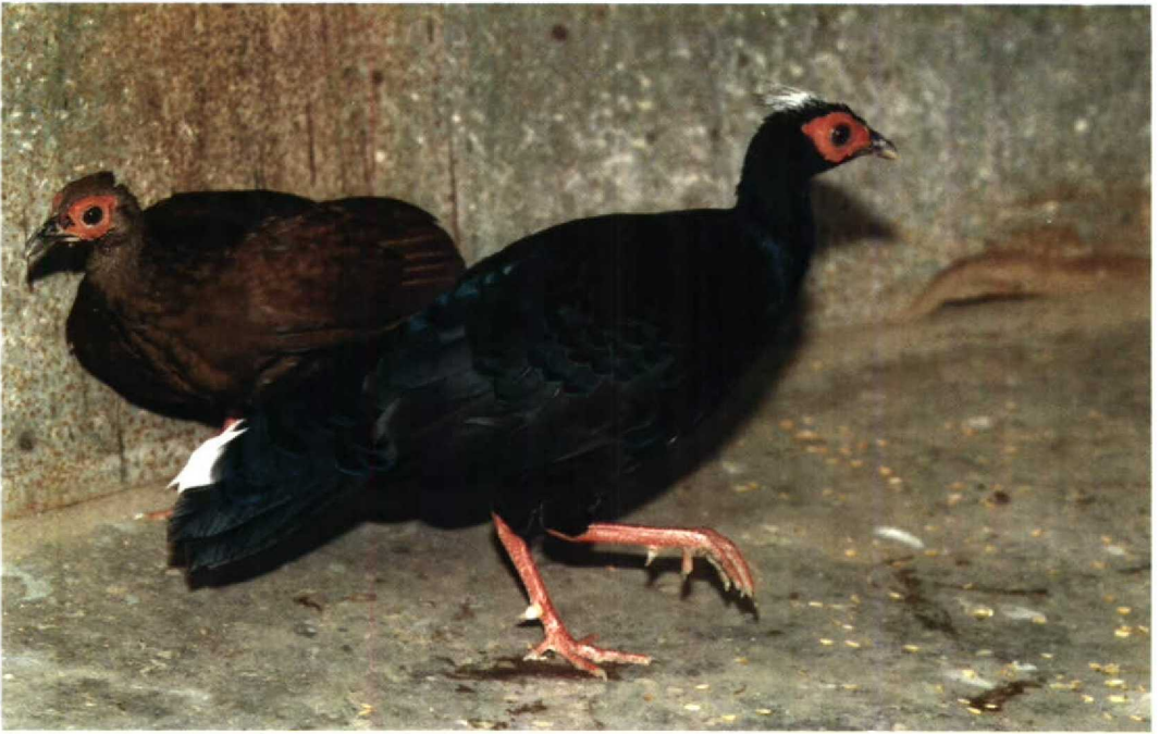
10 Vietnamese Pheasant Lophura hatinhensis , pair, trapped in Minh Hoa district, Quang Binh province, Viet Nam, c April 1990, in Ha Noi Zoological Garden, August 1990 ( Frank Rozendaal ) 11 Vietnamese Pheasant Lophura hatinhensis , female, trapped in Minh Hoa district, Quang Binh province, Viet Nam, c April 1990, in Ha Noi Zoological Garden, August 1990 ( Frank Rozendaal )