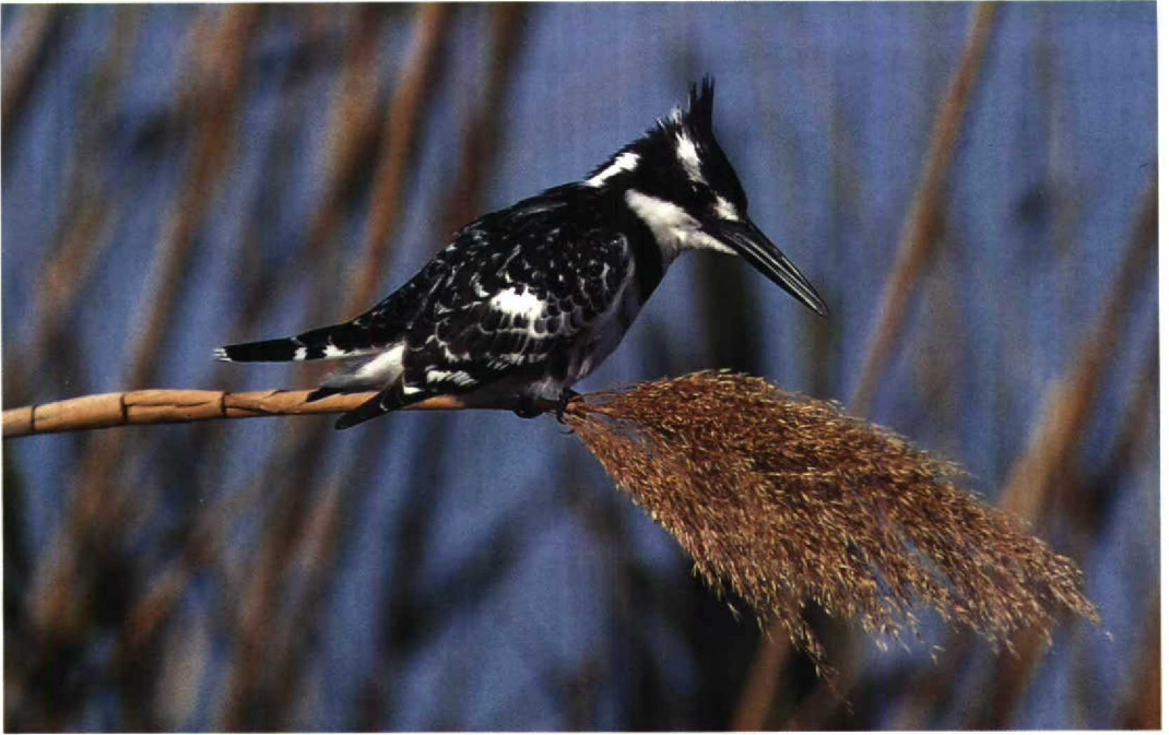
18 Pied Kingfisher Ceryle rudis , Ma'gan Mikhael, Israel, March 1990 19 Namaqua Dove Oena capensis , Eilat, Israel, March 1990