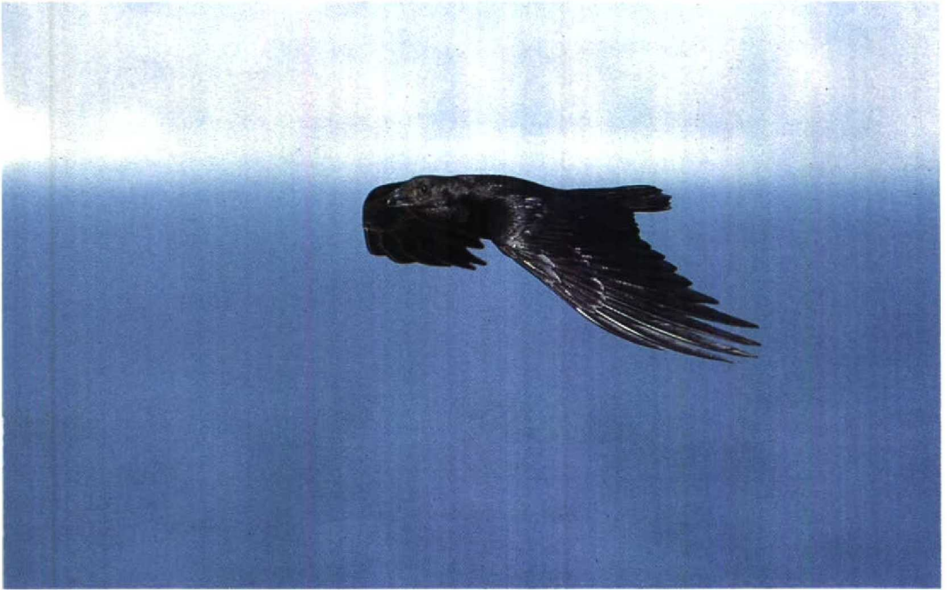
32 Fan-tailed Raven Corvus rhipidurus , Ein Gedi, Israel, March 1990 (René Pop) 33 Tristram's Grackle Onychognathus tristramii , Massada, Israel, March 1990 (René Pop)