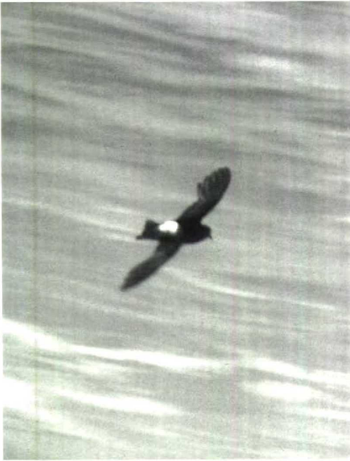
15 Wilson's Petrel Oceanites oceanicus , adult, Berlengas, Portugal, June 1984 (Arnoud B van den Berg)

post-breeding moult in May-August (when in the Northern Hemisphere) and often show old outer primaries projecting beyond growing new inner primaries (the complete post-juvenile moult of Wilson's Petrel takes place in tropical areas in October-May). In summer, juvenile Storm Petrels are in fresh plumage whereas adults moult in October-April. Thus, a Storm Petrel in active primary moult in June would be exceptional. Post-juvenile wing moult of Storm Petrel often already starts eight months after fledging, in June; however, the age of first breeding is 4 years, and it is to be expected that second calendar-year birds generally remain in African winter quarters.