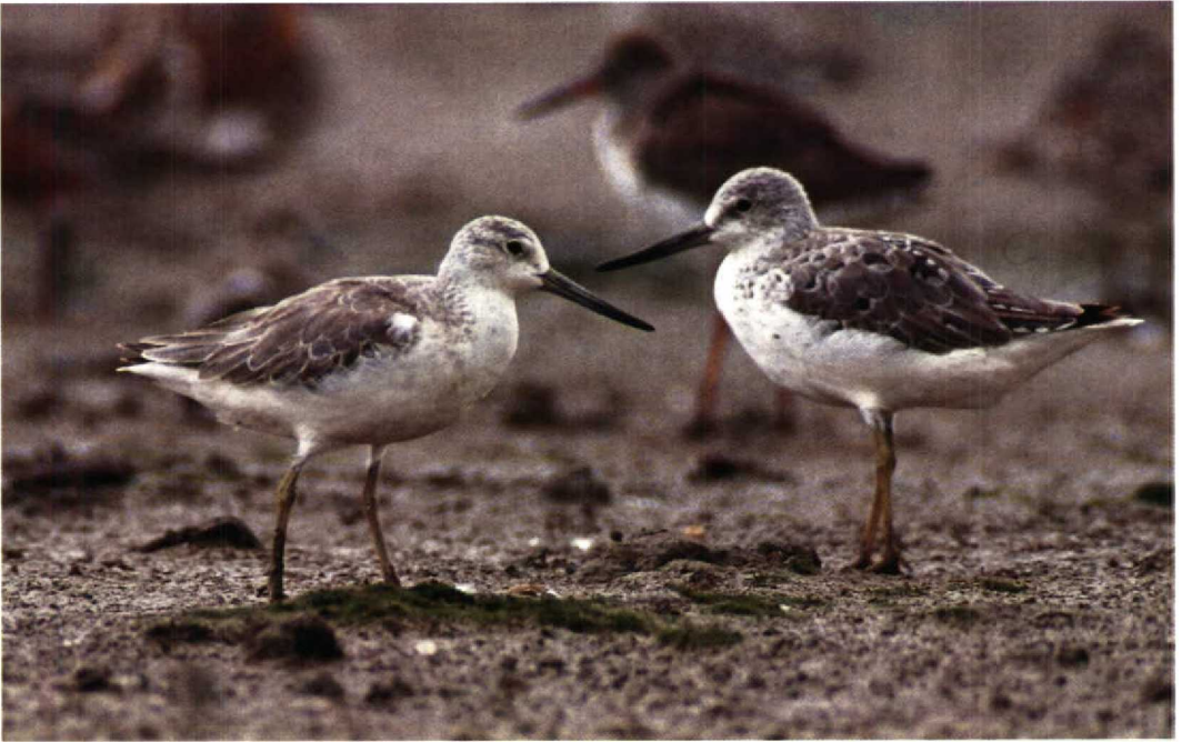
3 Nordmann's Greenshanks Tringa guttifer , right bird having commenced moult into summer plumage, left bird in winter plumage having not started moult, Mai Po, Hong Kong, April 1988 (Ray Tipper) 4 Nordmann's Greenshank Tringa guttifer , winter plumage, Mai Po, Hong Kong, April 1988 (Ray Tipper)