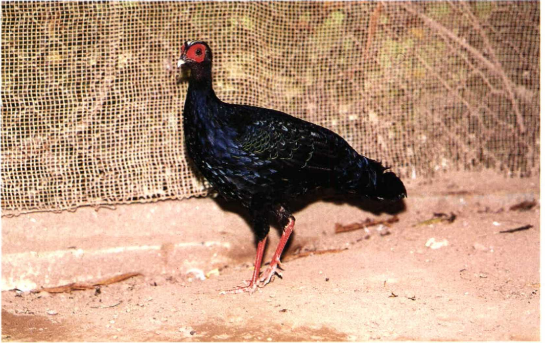
12 Vietnamese Pheasant Lophura hatinhensis , male, trapped in Minh Hoa district, Quang Binh province, Viet Nam, c April 1990, in Ha Noi Zoological Garden, August 1990 (Frank Rozendaal) 13 Holotype of Vietnamese Pheasant Lophura hatinhensis , male from Ky Son (Ky Anh district, Nghe Tinh province), Viet Nam (Frank Rozendaal)