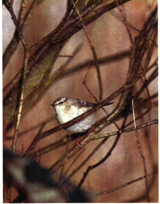
44 Humes Bladkoning Phylloscopus humei , De Cocksdorp, Texel, Noordholland, november 1990 (Arnaud B van den Berg) 45 Humes Bladkoning Phylloscopus humei , De Blocq van Kuffeler, Flevoland, december 1990 (Arnaud B van den Berg) 46 Siberische Boompieper Anthus hodgsoni , Noordwijk, Zuidholland, februari 1991 (René van Rossum)