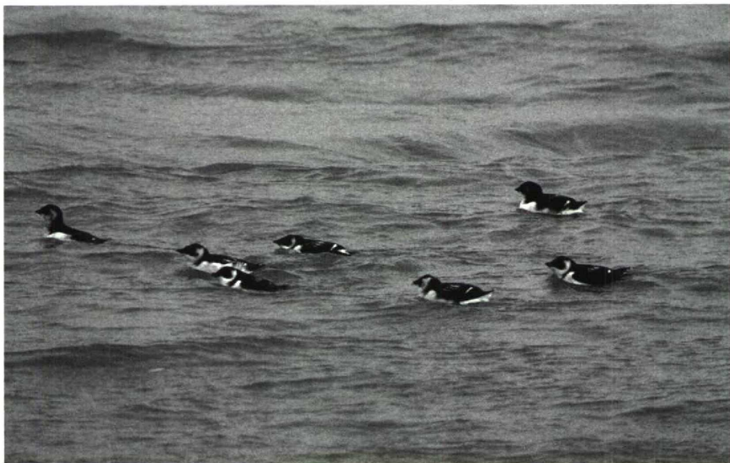
41 Kleine Alken Alle alle , IJmuiden, Noordholland, december 1990

Zh, op 12 en 13 december in Rijnsburg Zh en vanaf 24 december tot tenminste 22 januari 1991 bij De Blocq van Kuffeler Fl. Een Raddes Boszanger P. schwarzi verschool zich op de Maasvlakte van 6 tot 8 november. Bruine Boszangers P. fuscatus werden waargenomen op Terschelling van 7 tot 9 november en in de HW-duinen van 29 november tot 4 december. Tjiftjaffen P. collybita met kenmerken van de ondersoorten P. c. abietinus/tristis werden gezien bij De Blocq van Kuffeler vanaf 25 november, bij het Sneekermeer Fr op 4 december, in Rijnsburg op 14 en 17 december, in de HW-duinen van 14 tot 24 december (twee) en in de Delftse Hout Zh op 28 december (twee). De Rotskruiper Tichodroma muraria was vanaf 27 november weer terug op zijn stenige stek op het terrein van de Vrije Universiteit in Amsterdam-Buitenveldert Nh. Taigaboomkruipers Certhia familiaris werden gemeld bij Oost-Maarland L op 14 november, in de Broekmeden bij Hengelo op 6 december en in Meijndel op 15 december. Bij Hengelo werd op 6 december ook een Buidelmees Remiz pendulinus waargenomen. Het was weer eens tijd voor een Witstuitbarmsijs Carduelis hornemanni . Meldingen waren er op 6 november op Texel, op 9 en 10 november in de Kollumerwaard Gr