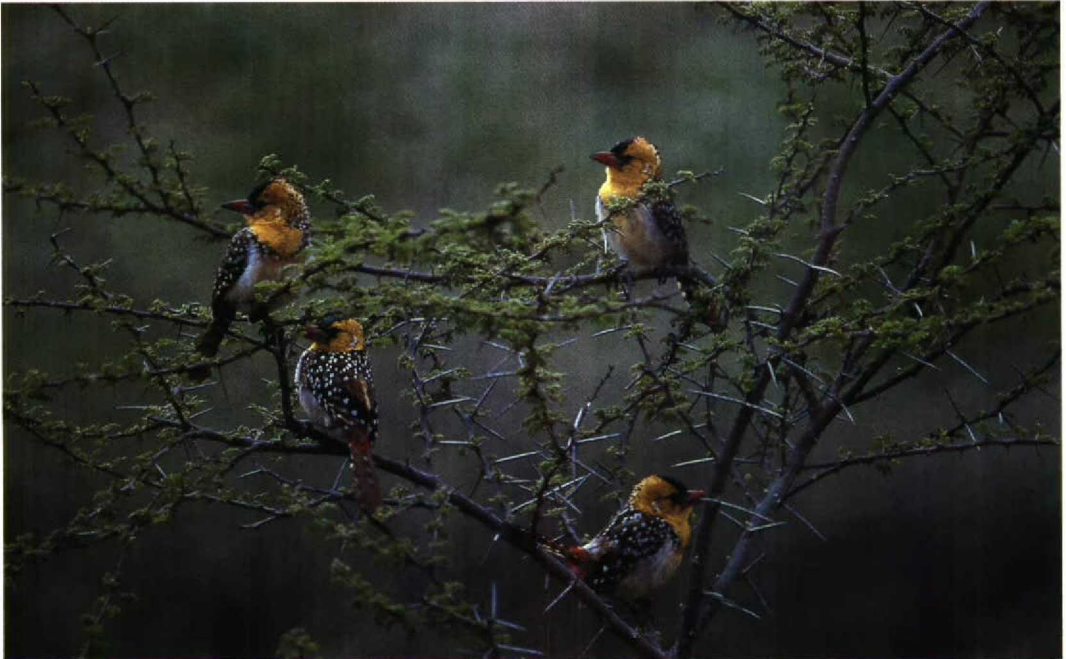
160 Yellow-breasted Barbet Trachyphonus margaritatus , Goda massif, Djibouti, February 1990 (Geoff Welch & Hilary Welch)

VOGELS IN DJIBOUTI Djibouti is gelegen in Oostafrika aan het zuidelijke, smalste gedeelte van de Rode Zee en vormt een verbinding tussen Afrika en het Arabische schiereiland. Een aantal goede vogelplaatsen langs de kust (roofvogels, steltlopers) en in het binnenland worden besproken. Naast allerlei Palearctische doortrekkers biedt Djibouti uiteraard een verscheidenheid aan Afrikaanse soorten. Ondanks de hoge verblijfskosten en het