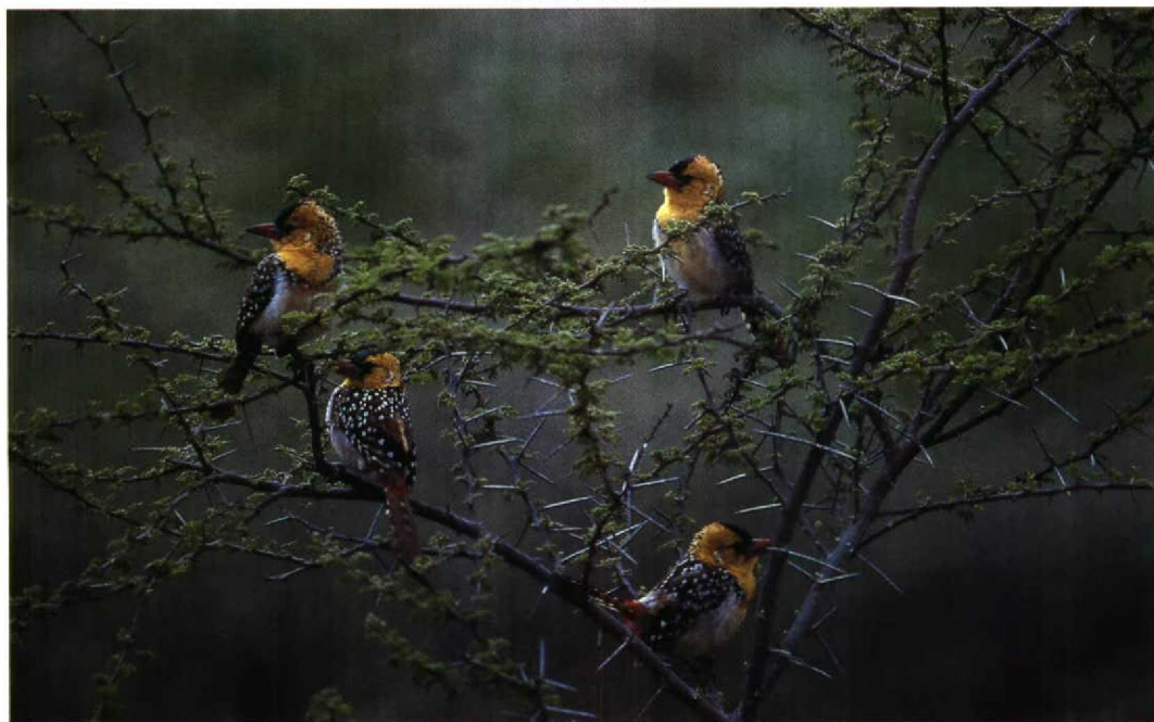
160 Yellow-breasted Barbet Trachyphonus margaritatus , Goda massif, Djibouti, February 1990 (Geoff Welch & Hilary Welch)

VOGELS IN DJIBOUTI Djibouti is gelegen in Oostafrika aan het zuidelijke, smalste gedeelte van de Rode Zee en vormt een verbinding tussen Afrika en het Arabische schiereiland. Een aantal goede vogelplaatsen langs de kust (roofvogels, steltlopers) en in het binnenland worden besproken. Naast allerlei Palearctische doortrekkers biedt Djibouti uiteraard een verscheidenheid aan Afrikaanse soorten. Ondanks de hoge verblijfskosten en het