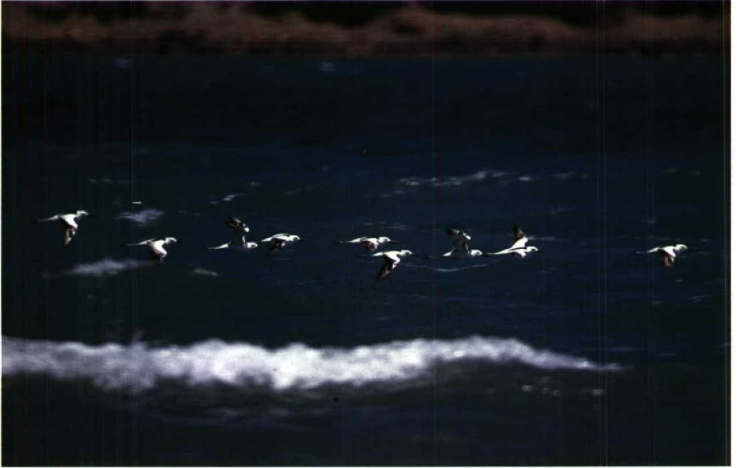
161 Crab Plovers Dromas ardeola , Doumeira, Djibouti, November 1987 (Geoff Welch & Hilary Welch)