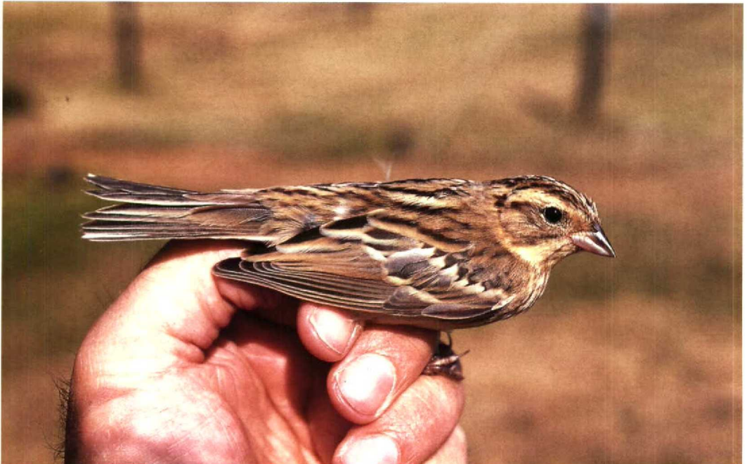
181 Wilgegors Emberiza aureola , Westenschouwen, Zeeland, 29 augustus 1991 (Arnoud B van den Berg, VRS Nebularia )

RALLEN TOT STERNS Een roepende Kwartelkoning Crex crex op 14 juli in de Wieringermeer Nh is het vermelden waard. Zomerse Kraanvogels Grus grus werden gezien bij Goedereede Zh op 22 juli en bij 't Harde Gld op 11 augustus. Broedende Steltkluten Himantopus himantopus waren er dit jaar in ieder geval bij Bergen op Zoom Nb. Op 5 augustus zat er één exemplaar bij Vlissingen en op 12 en 13 augustus twee ontsnapte exemplaren van de Amerikaanse ondersoort H h mexicanus bij Tiel Gld.