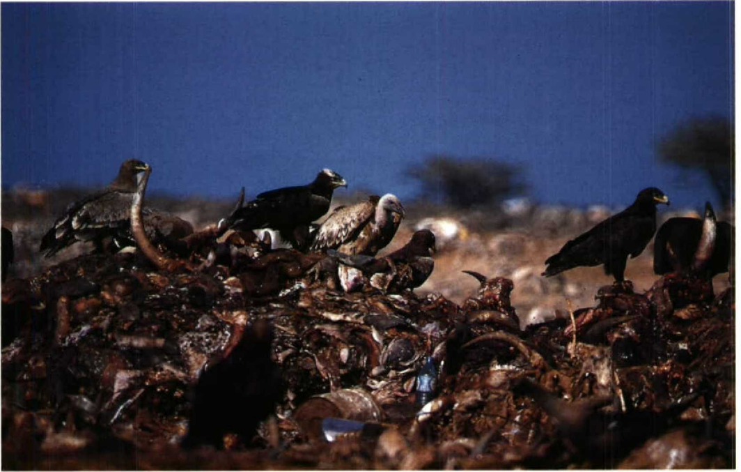
158 Steppe Eagles Aquila nipalensis and Rüppell's Vultures Gyps rueppellii , Djibouti rubbish dump, Djibouti, December 1985