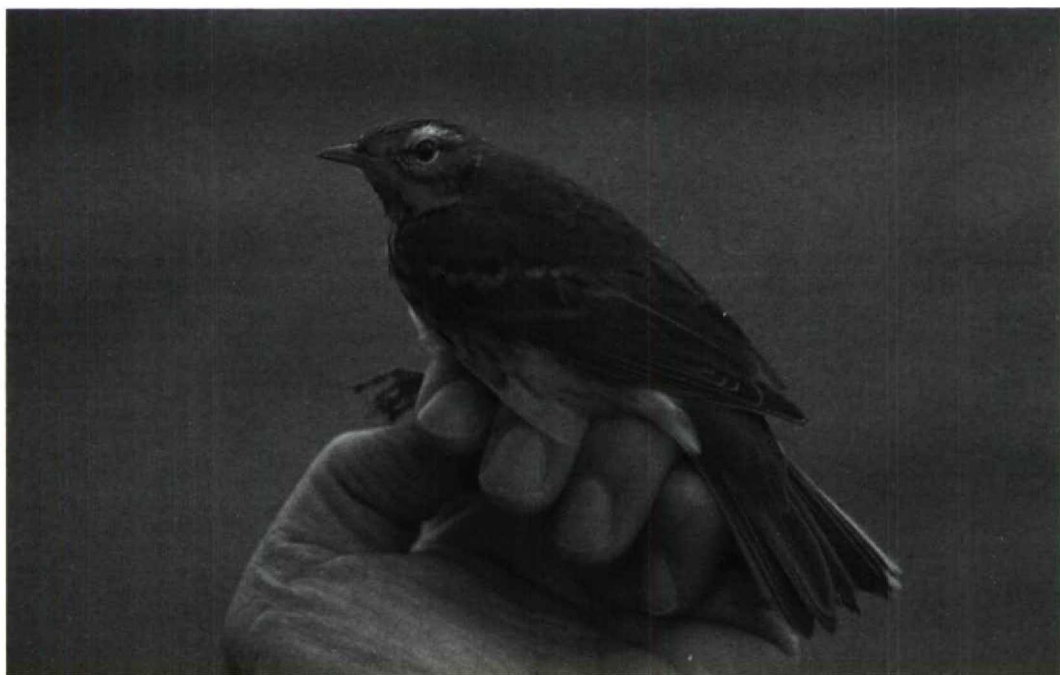
169 Siberische Boompieper Anthus hodgsoni , Bloemendaal, Noordholland, 25 oktober 1990 (Arnoud B van den Berg, VRS Cornelis van Lennep)

De beschrijving werd door TE en FdM gemaakt met de vogel in de hand en voor een deel aangevuld met kenmerken die op de dia's te zien zijn.