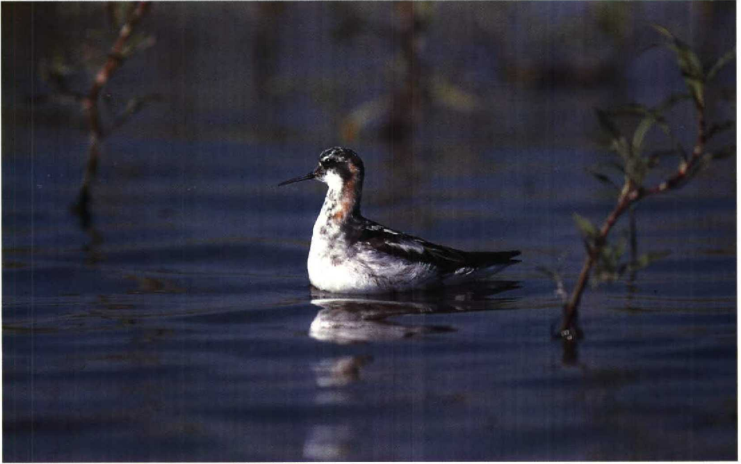
178 Grauwe Franjepoot Phalaropus lobatus , Almere, Flevoland, 28 juli 1991