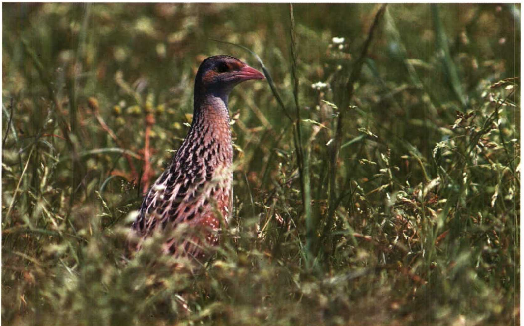
177 Kwartelkoning Crex crex , Wulpweg, Flevoland, 7 juli 1991 (Karel Mauer)