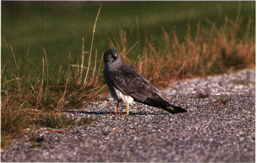
176 Grauwe Kiekendief Circus pygargus , Kluutweg, Flevoland, 31 juli 1991 (Karel Mauer)