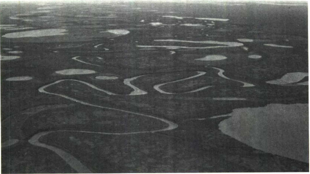
164 Aerial view of typical tundra landscape, Kolyma delta, Siberia, USSR, July 1990 (Michael Densley)

lakes, both within and beyond the tree-line. Buturlin also learned of large numbers of breeding Ross's Gulls at Malaya on the upper Alazeya river and on the tundra to the west as far as the Indigirka river. From this he concluded that the main breeding grounds of Ross's Gull comprised the whole of the northern Kolyma plain.