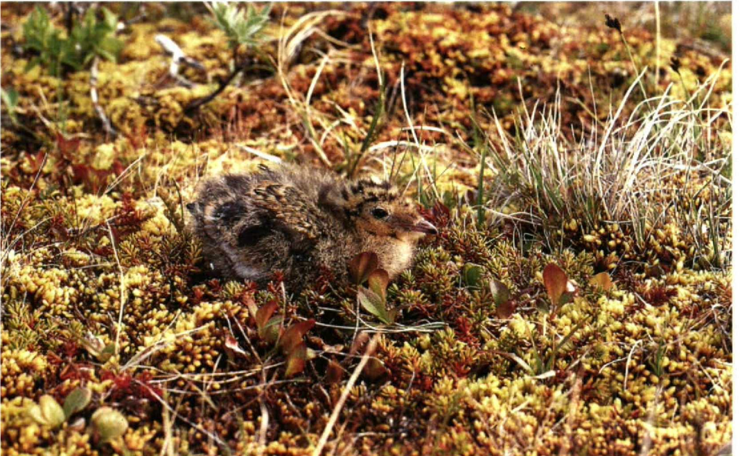
167 Ross's Gull Rhodostethia rosea , 9-11-day-old chick, Kolyma plain, Siberia, USSR, July 1990 (Michael Densley)