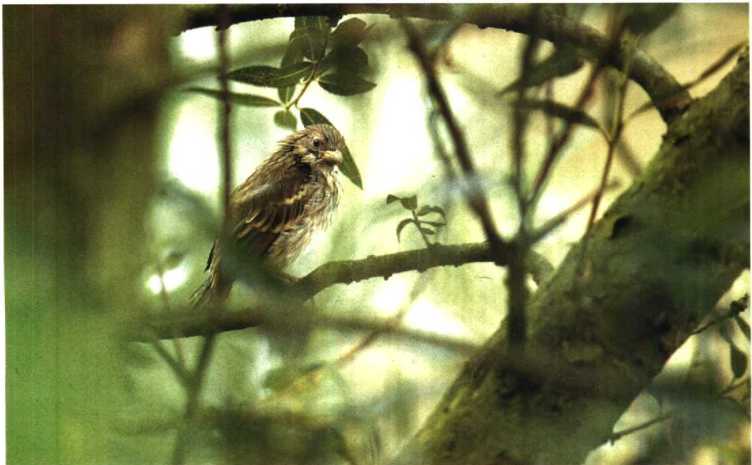
179 Roodmus Carpodacus erythrinus , juveniel, Knardijk, Flevoland, 20 juli 1991