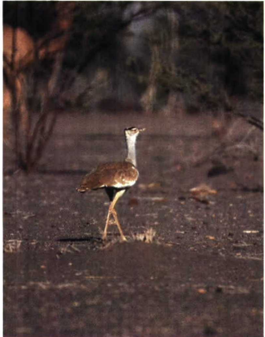
157 Arabian Bustard Ardeotis arabs , Dorra region, Djibouti, March 1990

The market gardens at Ambouli are accessible by bus or taxi but can be frustratingly difficult to work. The vegetation of the gardens provides ample cover for a wide range of residents and migrants and boasts several 'firsts' for Djibouti such as White-throated Robin Irania gutturalis , Paradise Whydah Vidua paradisaea , Collared Pratincole Glareola pratincola and Starling Sturnus vulgaris ! Ambouli's true importance for migrants will not be known until an extensive ringing study is carried out but its proximity to the centre of the city offers great scope