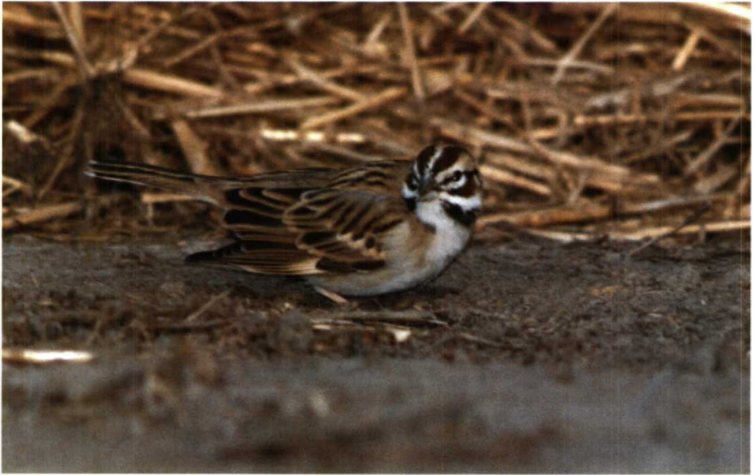
175 Lark Sparrow Chondestes grammacus , Waxham, Norfolk, Britain, May 1991 (David Tipling)