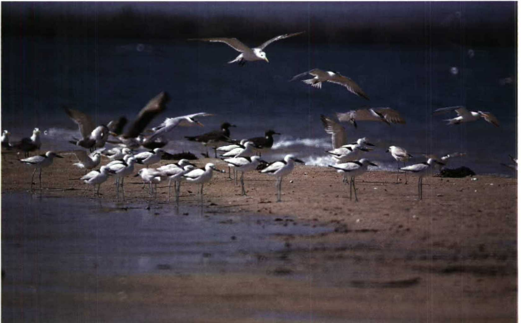
162 Crab Plover Dromas ardeola , Sooty Gull Larus hemprichii , Crested Tern Sterna bergii and Lesser Crested Tern S. bengalensis , Ras Siyan, Djibouti, October 1985