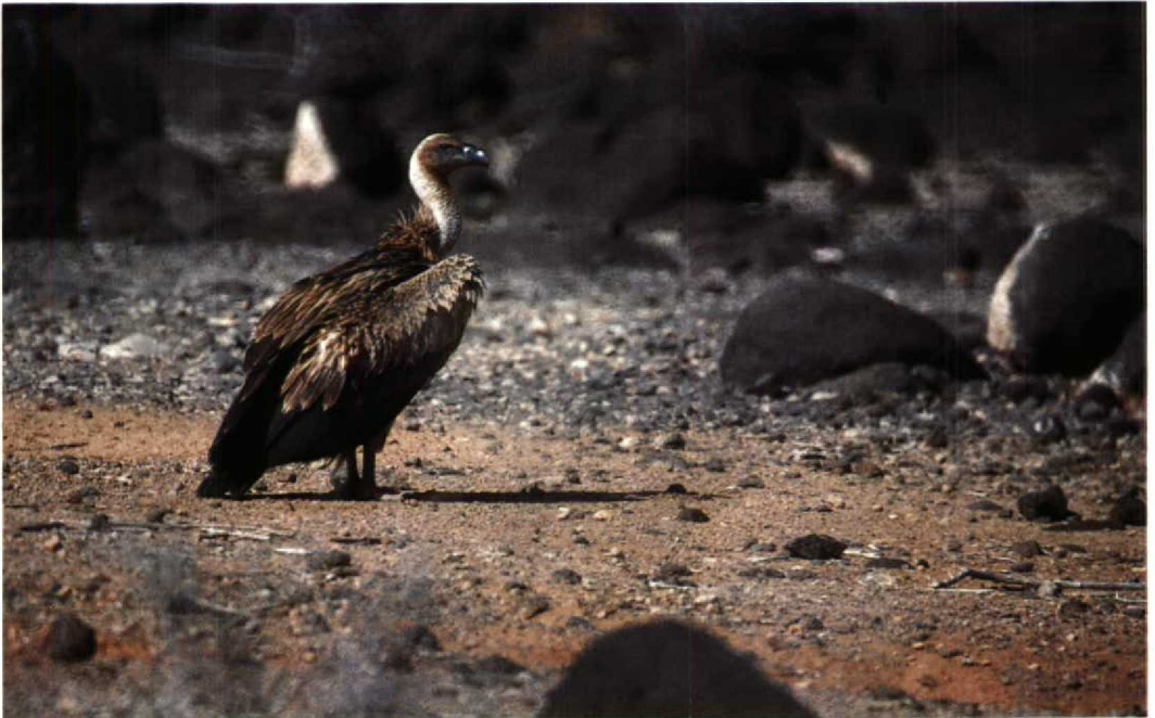
159 Rüppell's Vulture Gyps rueppellii , between Djibouti city and Arta, Djibouti, February 1989 (Geoff Welch & Hilary Welch)