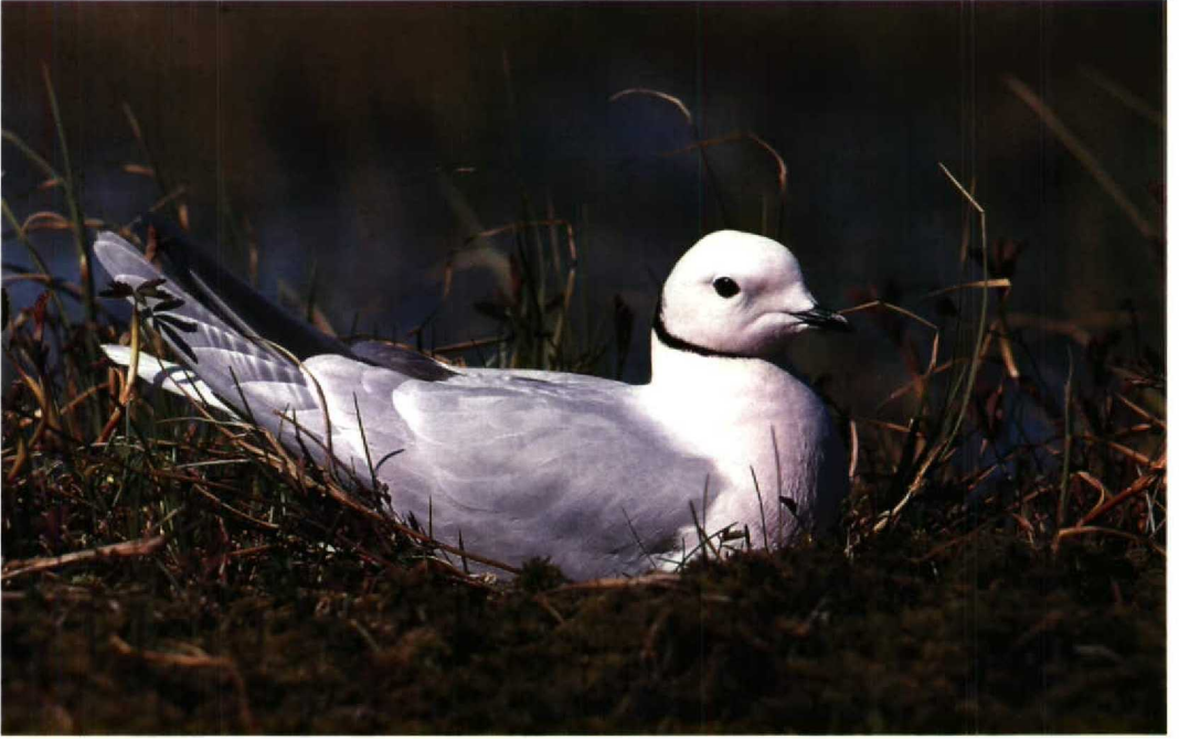
166 Ross's Gull Rhodostethia rosea at nest, Yana Indigirka lowlands, Siberia, USSR, June 1978 (Vladimir E Flint)