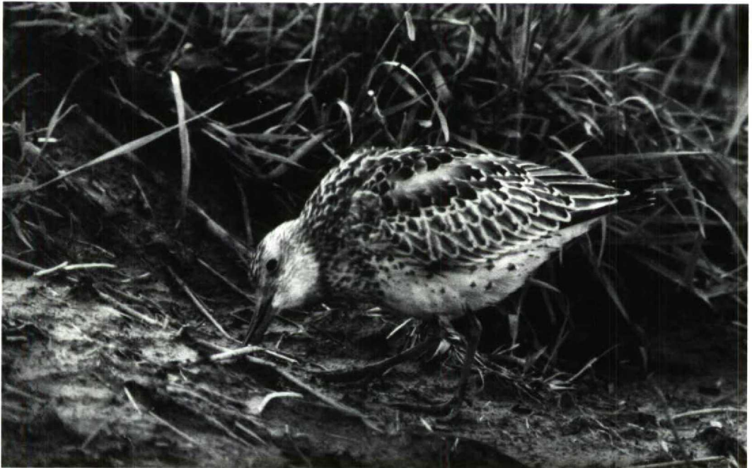
182 Grote Kanoet Calidris tenuirostris , Camperduin, Noordholland, 1 oktober 1991 (Arnoud B van den Berg)

Het lijkt zeker dat het hier dezelfde vogel betreft die van 17 tot 27 september 1991 op de Shetlands, Britannië, verbleef. Deze was op vrijdag 27 september om c 12:00 in zuidoostelijke richting weggevlogen en heeft waarschijnlijk ruim 24 uur doorgevlogen, tot grote blijdschap van vogelend Nederland. MAX BERLIJN