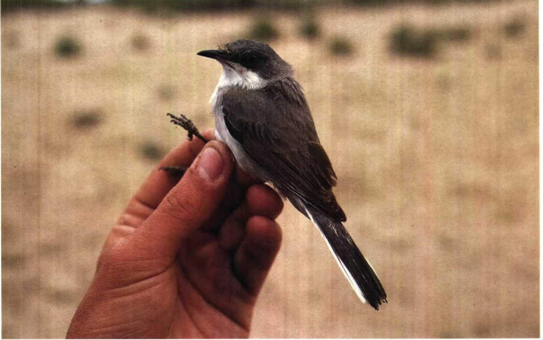
173 Orphean Warbler Sylvia hortensis crassirostris , female, Yumurtalik, Turkey, 11 April 1987

Mystery photograph 43. Solution in next issue