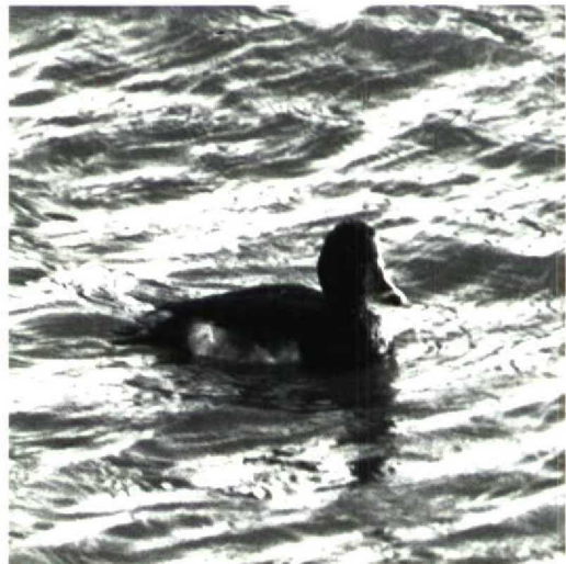
168 Ring-necked Duck x Tufted Duck hybrid A collaris x fuligula , first-year male, Goedereede, Zuidholland, 6 January 1991

Whilst studying the bird, a number of possibilities were considered. It was probably not a first-summer male Ring-necked Duck because of the rounded head and the short forward extension of the flanks, caused by the broad black breast (Gillham 1986). First-summer male Tufted Duck can be excluded by the sharp white subterminal band on the bill. The bill pattern of Paget's Pochard- or Ferruginous Duck-type hybrid A ferina x nyroca (Gillham et al 1966) could possibly fit but neither the black upperparts nor the white brown-dashed flanks match this hybrid type. According to Gillham et al (1966), Baer's Pochard-type hybrid A fuligula x nyroca very much resembles a male Ring-necked Duck. The bill tip, however, shows less black and the flanks are clouded brown all-over. The bird also differed notably from the presumed hybrid between Ring-necked and Tufted Ducks A collaris x fuligula that was observed by Vinicombe (1982)