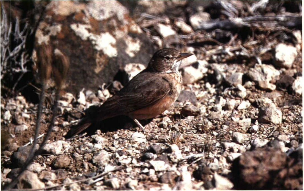
163 Desert Lark Ammomanes deserti assabensis , Forêt de Day, Djibouti, March 1984 (Geoff Welch & Hilary Welch)

hete klimaat is een bezoek zeer de moeite waard; bovendien zijn nog veel gegevens en waarnemingen nodig voor een betere ornithologische kennis van dit kleine land op de grens tussen Afrika en het Midden-Oosten.