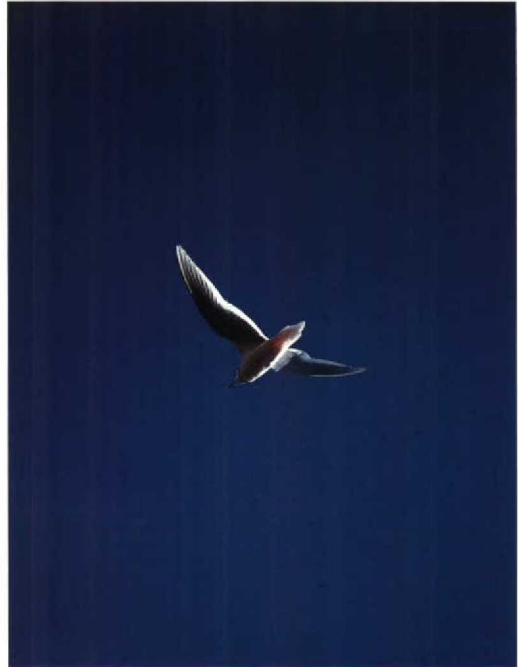
165 Ross's Gull Rhodostethia rosea , Kolyma plain, Siberia, USSR, July 1990 (Michael Densley)

Shortly after hatching, as soon as they are mobile, young Ross's Gulls leave the nest but remain in the vicinity and hide in the vegetation or feed on the nearest area of open water. At this stage, they are still attended by their parents. Newly hatched chicks