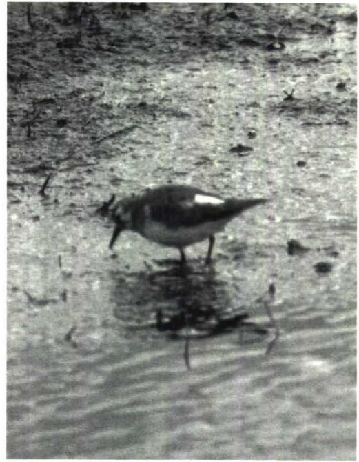
138 Gedeeltelijk albinistische Temmincks Strandloper Calidris temminckii , Oudega, Smallingerland, Friesland, 12 mei 1991 (Thijmen de Groot)

PARTIALLY ALBINISTIC TEMMINCK'S STINT NEAR OUDEGA IN MAY 1991 On 12 May 1991, a partially albinistic Temminck's Stint Calidris temminckii was observed and photographed near Oudega, Smallingerland, Friesland.