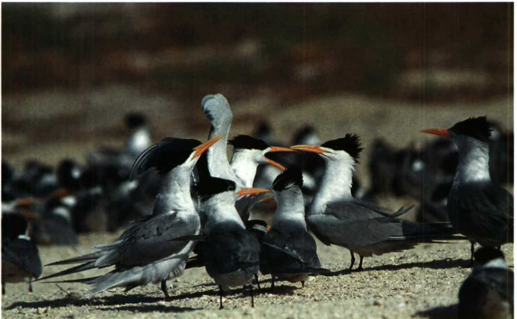
145 Lesser Crested Terns Sterna bengalensis , Karan, Arabian Gulf, Saudi Arabia, June 1991 (Arnoud B van den Berg)

Arnoud B van den Berg, Michael I Evans & Peter Symens, c/o Duinlustparkweg 98, 2082 EG Santpoort-Zuid, Netherlands