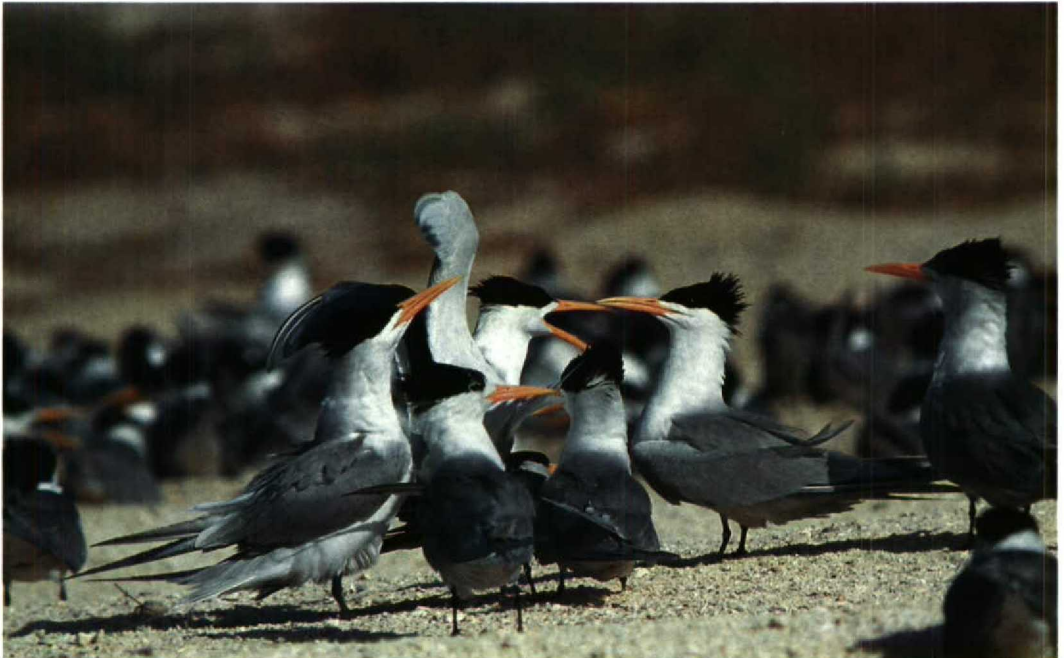
145 Lesser Crested Terns Sterna bengalensis , Karan, Arabian Gulf, Saudi Arabia, June 1991

Arnoud B van den Berg, Michael I Evans & Peter Symens, c/o Duinlustparkweg 98, 2082 EG Santpoort-Zuid, Netherlands