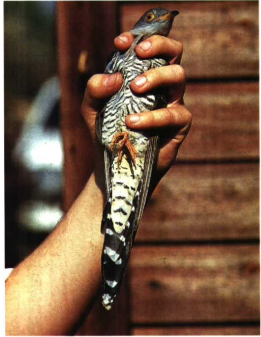
139 Cuckoo Cuculus canorus canorus , adult female, showing broad barring on underparts, particularly on flanks, and also ochre-tinged undertail-coverts, Rye Meads, Hertfordshire, Britain, May 1990 140 Oriental Cuckoo Cuculus saturatus horsfieldi , adult female, showing underwing pattern, Talaud Islands (north of Sulawesi), Indonesia, February 1985

Information on the field identification of Oriental Cuckoos is limited and little progress has been made in recent years. Redman (1985) drew attention to complex problems of both field and museum identification. He did, however, consider the width of the barring on the underparts of Oriental Cuckoo to be broader than in Cuckoo and