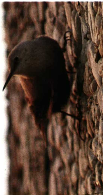
132 Rotskruiper Tichodroma muraria , VU-hoofdgebouw, Amsterdam-Buitenveldert, Noordholland, 15 november 1989 (Arnoud B van den Berg)

opnieuw op het VU-terrein en omgeving aangetroffen. De vogel vertoonde hetzelfde gedrag als in de voorafgaande winter en was aanwezig tot 5 april 1991.