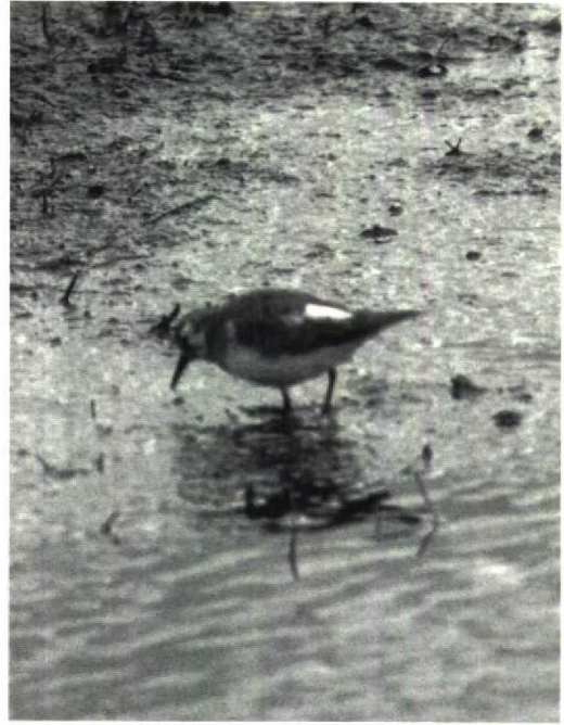
138 Gedeeltelijk albinistische Temmincks Strandloper Calidris temminckii , Oudega, Smallingerland, Friesland, 12 mei 1991

PARTIALLY ALBINISTIC TEMMINCK'S STINT NEAR OUDEGA IN MAY 1991 On 12 May 1991, a partially albinistic Temminck's Stint Calidris temminckii was observed and photographed near Oudega, Smallingerland, Friesland.