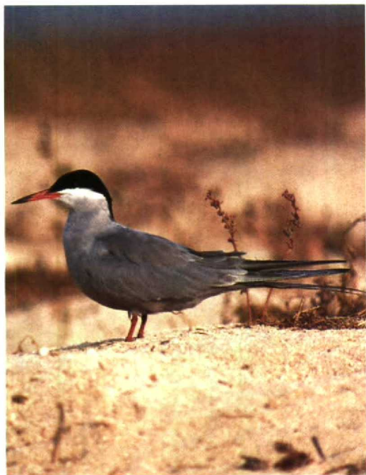
146 White-cheeked Tern Sterna repressa , Karan, Arabian Gulf, Saudi Arabia, June 1991 (Arnoud B van den Berg)