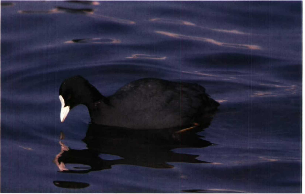
124 Coot Fulica atra , IJmuiden, Noordholland, Netherlands, 3 March 1986 (Arnoud B van den Berg)