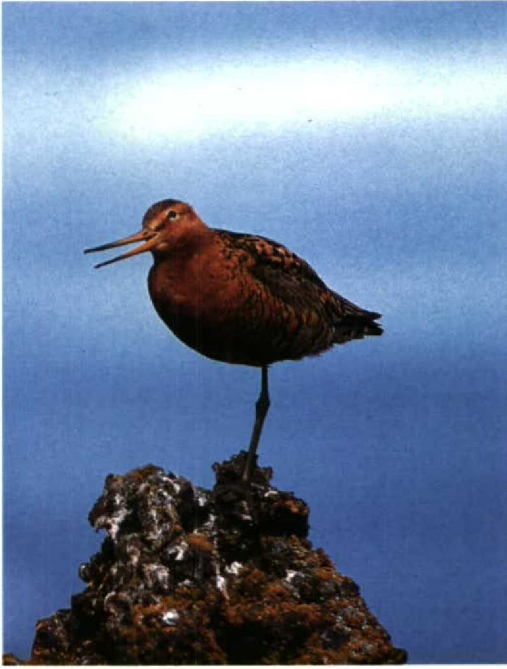
130 Icelandic Godwit Limosa limosa islandica , Myvatn, Iceland, 22 July 1990

all) from the Netherlands are bleached to pale cinnamon. Fresh limosa can look very bright rusty-rufous in April and can easily be mistaken for islandica when no direct comparison is possible; a few birds maintain such a bright plumage until June when they stand out among duller companions. The subtle differences in rufous coloration between limosa and islandica are useful in the hand but generally not in the field, except perhaps in a mixed flock of both subspecies.