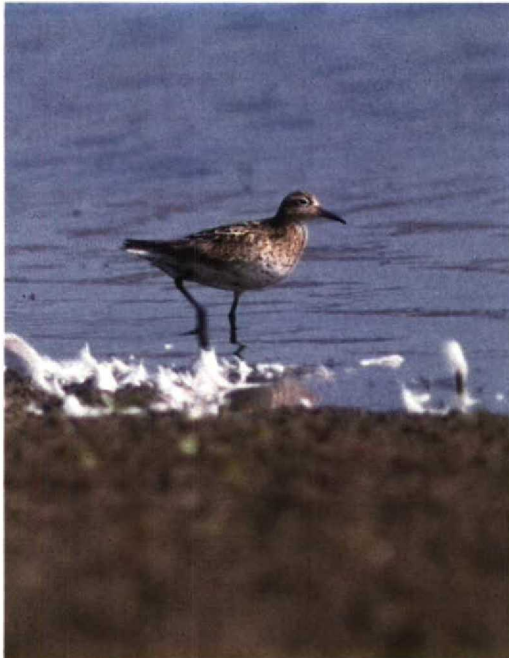
126-127 Siberische Strandloper Calidris acuminata , Philippine, Zeeland, 18 september 1989 (Arnoud B van den Berg, René Pop)

Van begin af aan was duidelijk dat alleen Gestreepte en Siberische Strandloper voor de determinatie in aanmerking kwamen. Op grond van bovenstaande beschrijving kan de Gestreepte Strandloper vrij vlug worden uitgesloten. Als belangrijkste verschillpunten met de aanwezige Gestreepte Strandloper vielen op: 1 de platte buik; 2 de iets langere poten en iets kortere snavel; 3 de rondere en iets kleinere kop; 4 de plattere kruin; 5 de goudgele borst met lichte streping en de niet abrupte afscheiding daarvan met witte onderdelen; 6 de lichtgrijze kleine en middelste vleugeldekveren; en 7 de opvallende rosse kruin en witachtige wenkbrauwstreep. Ondermeer vanwege enkele (bij Gestreepte Strandloper ontbrekende) zwarte chevrons (vooral op de voorflank) en het gesleten kleed was het een adulte vogel. Voor verdere verschillen tussen beide soorten zij verwezen naar Hayman et al (1986).