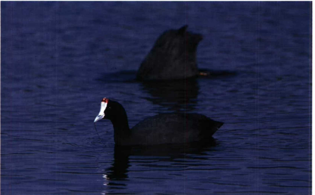
125 Crested Coot Fulica cristata , Sidi Bou Rhaba, Morocco, 22 December 1987 (Arnoud B van den Berg)