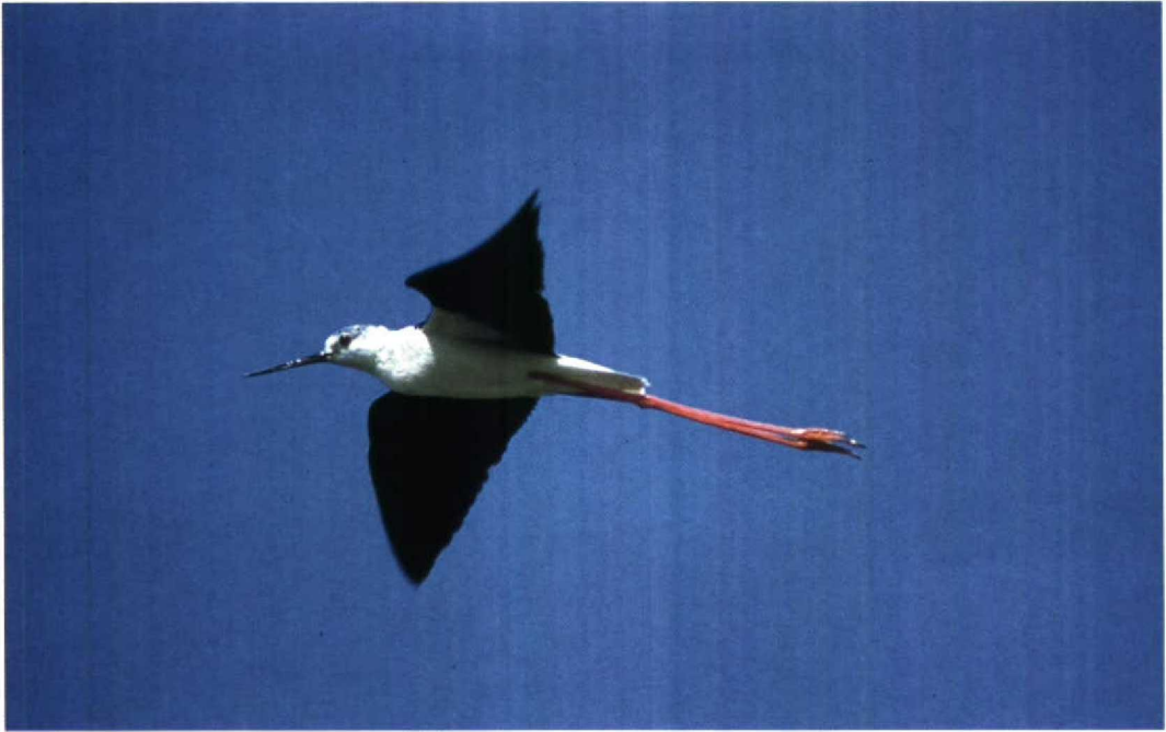
151 Steltkluut Himantopus himantopus , Bergen op Zoom, Noordbrabant, juni 1991

op Rottumeroog werden nog late exemplaren gemeld op 3, 10 en 29 mei. Overigens heeft er dit jaar in Nederland een geslaagd broedgeval van deze soort plaatsgehadt.