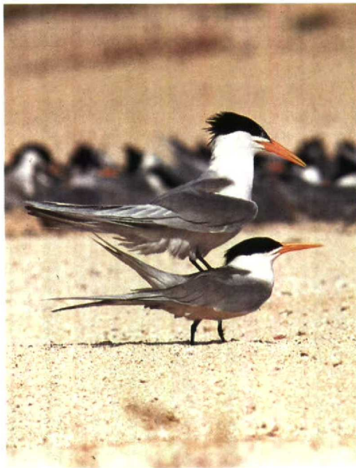
147 Lesser Crested Terns Sterna bengalensis , Karan, Arabian Gulf, Saudi Arabia, June 1991