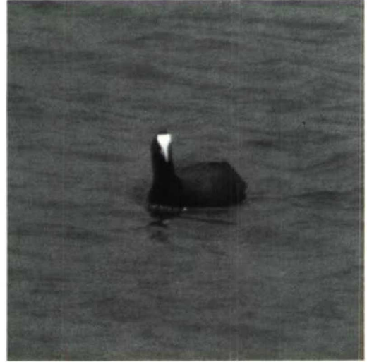
123 Crested Coot Fulica cristata , Spain, 11 May 1990. Note shape of shield and 'firm' connection of shield and bill

curving up to the crown during the breeding season.