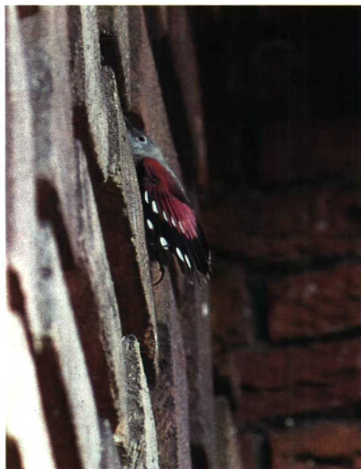
133-134 Rotskruiper Tichodroma muraria , Augustinusparochiekerk, Amsterdam-Buitenveldert, Noordholland, 31 maart 1990 (Lammert van der Veen)

april nog steeds een gedeelte van het winterkleed vertoont (Kees Roselaar pers med). Het is echter onwaarschijnlijk dat de Rotskruiper van Amsterdam in april 1990 nog in volledig winterkleed was. Het leek daarom waarschijnlijk dat de Amsterdamse vogel een vrouwtje betrof. Overigens vertoont c 60% van de vrouwtjes in zomerkleed eveneens een individueel variërende hoeveelheid zwart op de borst zodat bij aanwezigheid van zwarte borstveren een vrouwtje in zomerkleed niet uit te sluiten is; de hoeveelheid zwart is bij mannelijke exemplaren echter groter dan bij vrouwelijke (Löhr 1967).