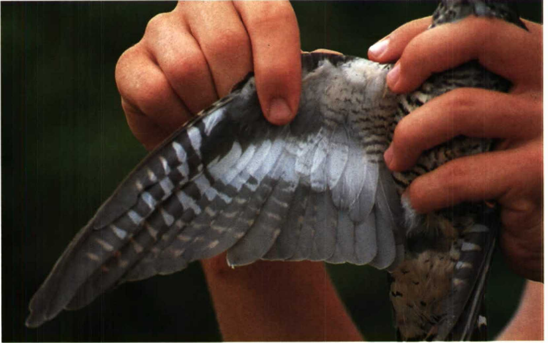
141 Oriental Cuckoo Cuculus saturatus , immature, showing underwing pattern, Mai Po, Hongkong, September 1989 (Paul J Leader) 142 Cuckoo Cuculus canorus , adult female, showing underwing pattern, Rye Meads, Hertfordshire, Britain, May 1990 (P Roper)