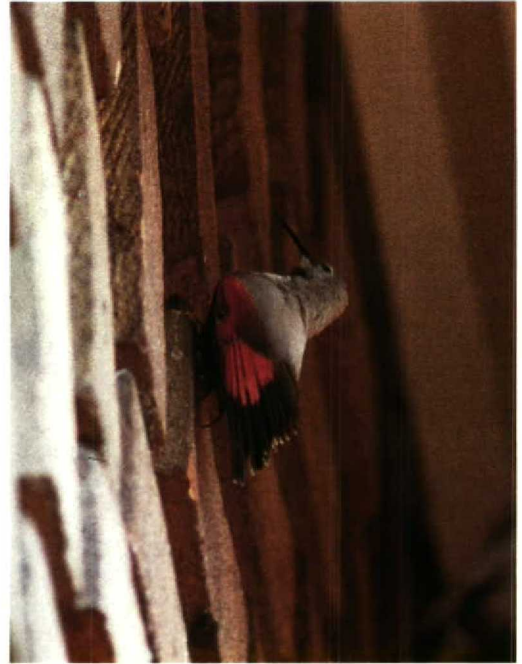
135-136 Rotskruiper Tichodroma muraria , Augustinusparochiekerk, Amsterdam-Buitenveldert, Noordholland, 31 maart 1990

1978. De twee overige Britse gevallen na 1950 betroffen een exemplaar van 6 tot 10 april 1977 bij Hastings, East Sussex, en een mannetje op 16 mei 1985 op Isle of Wight. Er is ook een geval bekend van Jersey, Kanaaleilanden, op 4 maart 1972 (Long 1981).