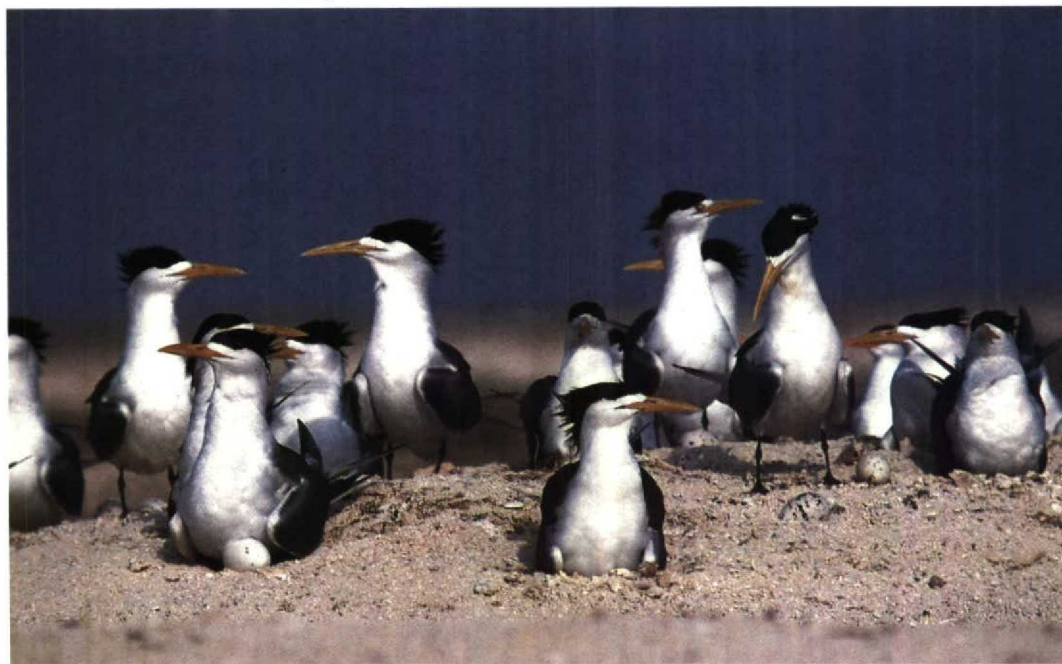
148 Crested Terns Sterna bergii , Karan, Arabian Gulf, Saudi Arabia, June 1991 (Arnoud B van den Berg)