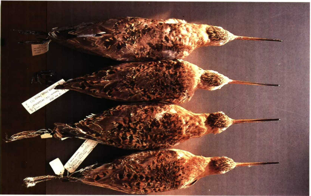
128-129 Black-tailed Godwit Limosa limosa , males (from top to bottom): two L l limosa , Zunderdorp, Noordholland, 20 May 1966 and Jouswier, Friesland, 17 May 1977; two L l islandica , Iceland, 2 June 1957. These are average birds of each subspecies; some limosa are distinctly darker and more extensively red, others much paler and less extensively cinnamon; differences in pattern and amount of summer plumage between females is much less pronounced but difference in tinge of rufous is same as shown by males (Gerrit J Gerritsen)