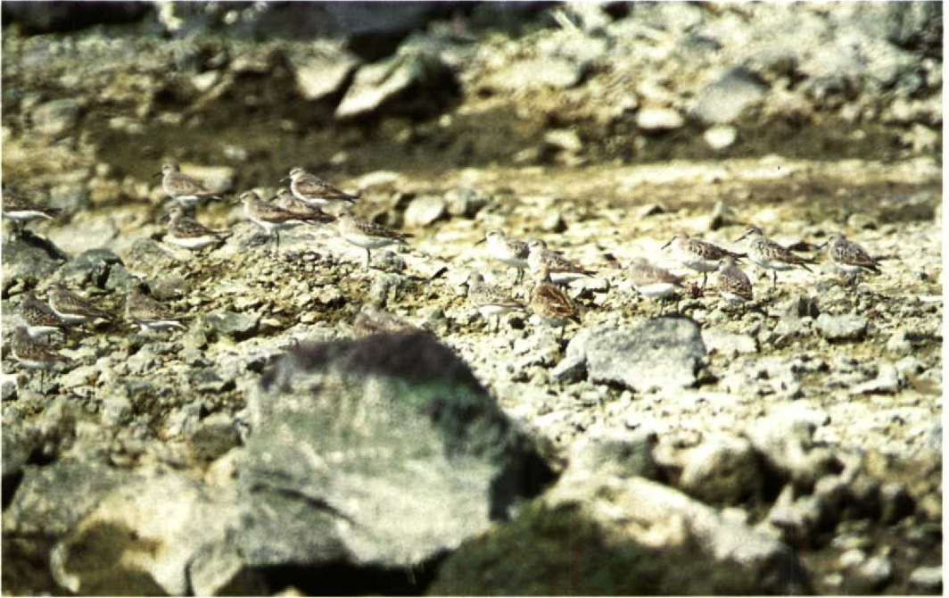
137 White-rumped Sandpipers Calidris fuscicollis , Ilha Terceira, Azores, 28 August 1990

band along the lower rear edge of the folded wing. Another c 25% of the birds retained the smartly patterned scapulars of summer adults. These birds resembled juveniles since the feathering appeared new and the wing-coverts fresh and pale-fringed. However, at close range, the pale fringes were obviously faded and worn and none of the birds was noted as having the fresh crisp fringes typical of juvenile plumage (Killian Mullarney in litt after examination of transparencies).