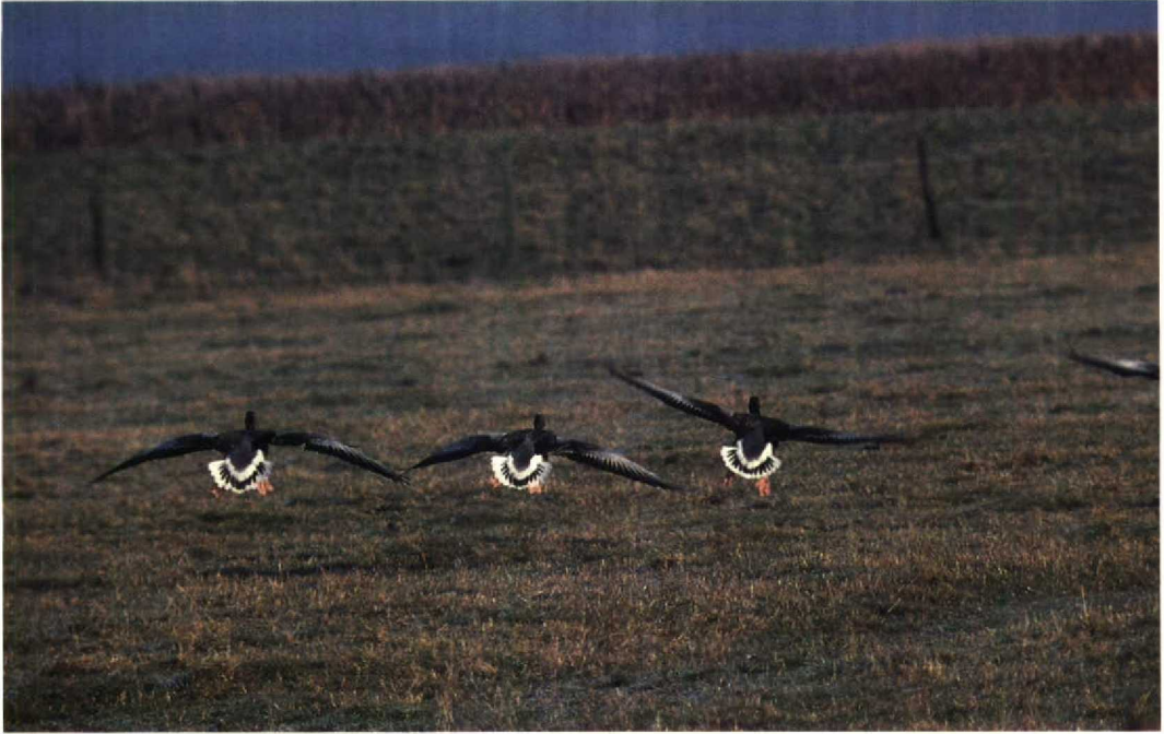
144 Greylag Geese Anser anser , Verdrongen Land van Saeftinge, Zeeland, 30 November 1989

Mystery photograph 42. Solution in next issue