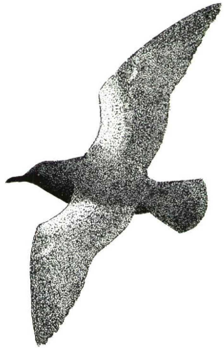
FIGUUR 1 Melanistische Kokmeeuw Larus ridibundus, Borssele, Zeeland, 24 juni 1989. Naar veldschets