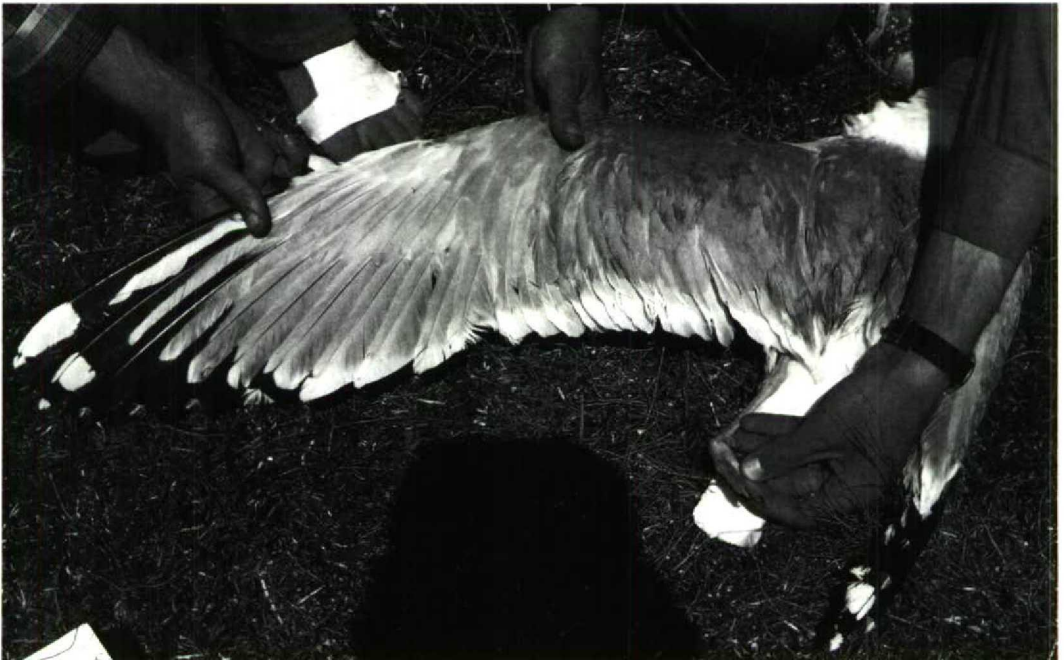
143 Wing of adult Yellow-legged Gull L c cachinnans (sensu Glutz von Blotzheim & Bauer 1982), breeding colony at Sivash, Azov/Black Sea, Ukraine, USSR, May 1989. Note six black-marked primaries (p5-10) with trace of black on p4, white wedge on inner web of p10 and wide black band on inner web of p8. Compare with wing of claimed L c cachinnans from Vistula mouth, Poland (Dutch Birding 12: 16, plate 9, 1990) (Czeslaw Nitecki)

tips on five primaries only – as the bird depicted in Dubois et al's plate 9 – seem to be virtually absent among typical cachinnans . Again, five (or less) black-marked primaries are common in northern populations (54% of a sample of 200, cf Barth 1968; 65% of a sample of 169, cf Coulson et al 1982) but less frequent further south, eg in Germany (13% of a sample of 160, cf Goethe 1961) and Great Britain (20% of a sample of 1424, cf Coulson et al 1982), where a more extensive black pattern predominates. 3 Within the European range, a thayeri pattern on p9 seems to be restricted to Fennoscandia where it forms a SW-NE cline of increasing frequency, reaching 27% (of a sample of 15) in eastern Finnmark (Barth 1968) and again 27% of 95 museum skins from north-western Russia (Coulson et al 1984). It is virtually absent in central and western Europe (0-1% in north-western Germany, the Netherlands and Great Britain) (Barth 1968, Coulson et al 1984) and we are not aware of any records of this character from southern populations of the complex. In fact, the thayeri pattern has been used as a reliable criterion for the identification of northern Scandinavian birds among