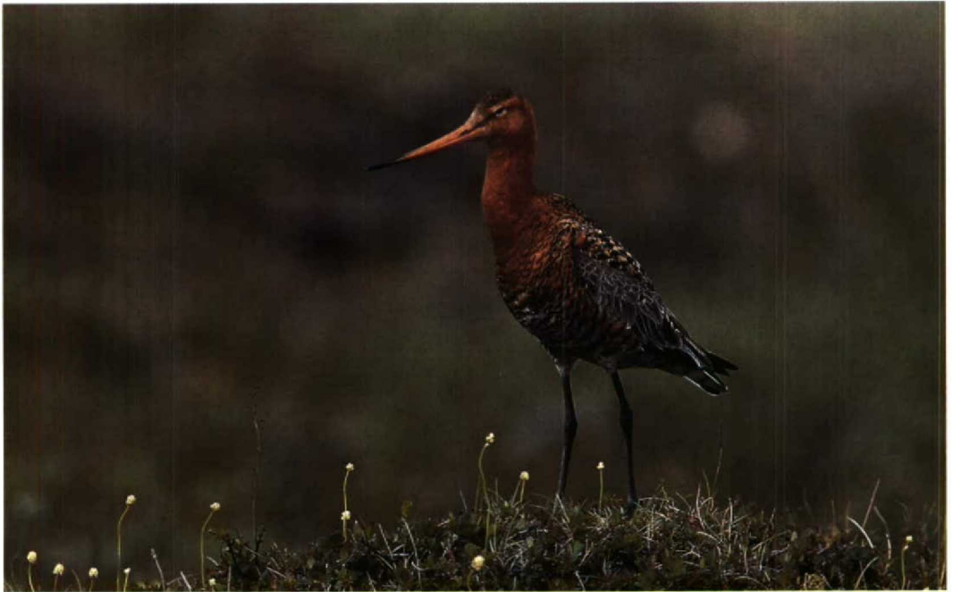
131 Icelandic Godwit Limosa limosa islandica , Myvatn, Iceland, 26 June 1990

It is not generally realized that Black-tailed Godwit has three different types of summer-plumage feathers: 1 Feathers growing early in the pre-breeding moult (presumably when the birds are still in their winter quarters) which are intermediate in appearance between winter- and summer-plumage feathers. These feathers are pale grey (as in winter plumage), not rufous, but differ from winter-plumage feathers in showing a black central streak or arrow mark. They are usually restricted to mantle, scapulars and/or upperbreast. Except for some females, few or none of these feathers remain when the birds are on the breeding grounds. The feathers were scored