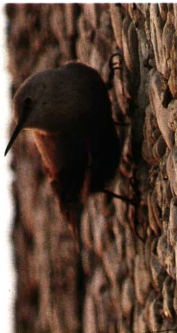
132 Rotskruiper Tichodroma muraria , VU-hoofdgebouw, Amsterdam-Buitenveldert, Noordholland, 15 november 1989

opnieuw op het VU-terrein en omgeving aangetroffen. De vogel vertoonde hetzelfde gedrag als in de voorafgaande winter en was aanwezig tot 5 april 1991.