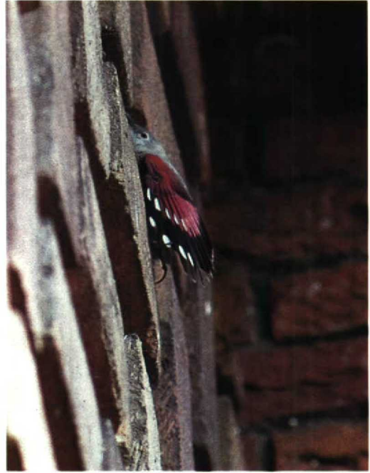
133-134 Rotskruiper Tichodroma muraria , Augustinusparochiekerk, Amsterdam-Buitenveldert, Noordholland, 31 maart 1990

april nog steeds een gedeelte van het winterkleed vertoont (Kees Roselaar pers med). Het is echter onwaarschijnlijk dat de Rotskruiper van Amsterdam in april 1990 nog in volledig winterkleed was. Het leek daarom waarschijnlijk dat de Amsterdamse vogel een vrouwtje betrof. Overigens vertoont c 60% van de vrouwtjes in zomerkleed eveneens een individueel variërende hoeveelheid zwart op de borst zodat bij aanwezigheid van zwarte borstveren een vrouwtje in zomerkleed niet uit te sluiten is; de hoeveelheid zwart is bij mannelijke exemplaren echter groter dan bij vrouwelijke (Löhr 1967).