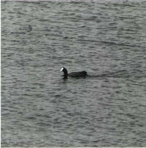
122 Crested Coot Fulica cristata , Spain, 11 May 1990. Note flat and rectangular body shape and high stern as well as typical triangular-shaped head