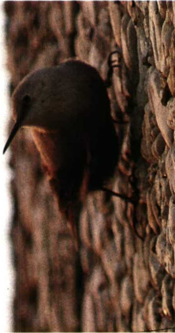
132 Rotskruiper Tichodroma muraria , VU-hoofdgebouw, Amsterdam-Buitenveldert, Noordholland, 15 november 1989 (Arnoud B van den Berg)

opnieuw op het VU-terrein en omgeving aangetroffen. De vogel vertoonde hetzelfde gedrag als in de voorafgaande winter en was aanwezig tot 5 april 1991.