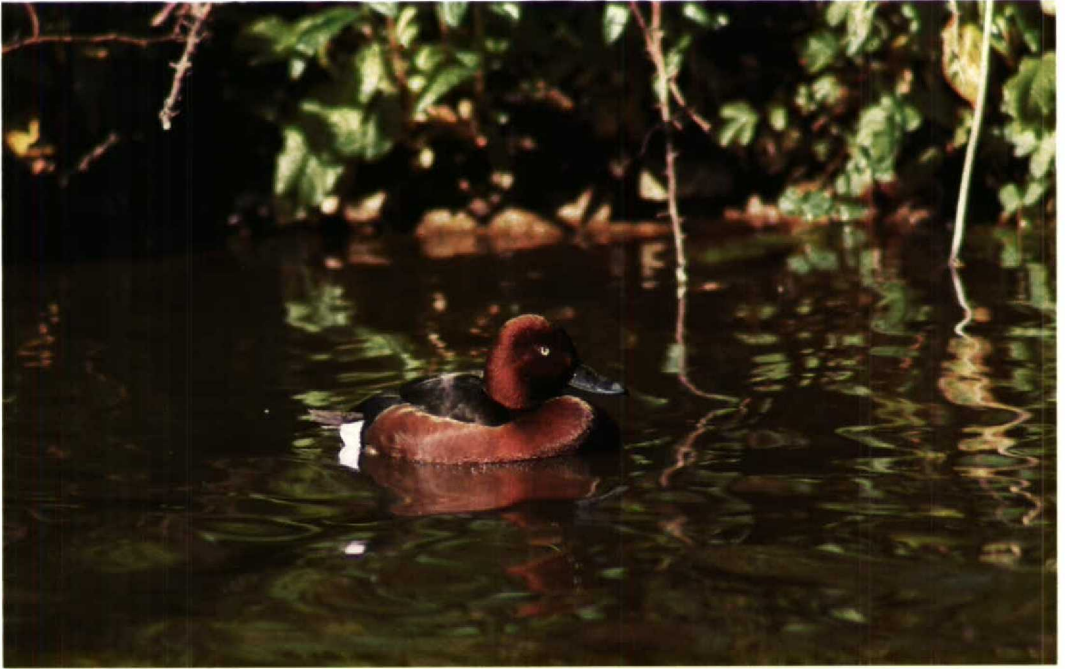
152 Witoegeend Aythya nyroca , Scheveningen, Zuidholland, 18 mei 1991 (Mike Weston)