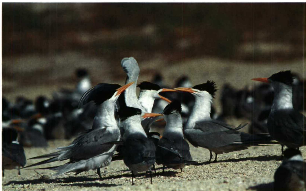
145 Lesser Crested Terns Sterna bengalensis , Karan, Arabian Gulf, Saudi Arabia, June 1991

Arnoud B van den Berg, Michael I Evans & Peter Symens, c/o Duinlustparkweg 98, 2082 EG Santpoort-Zuid, Netherlands