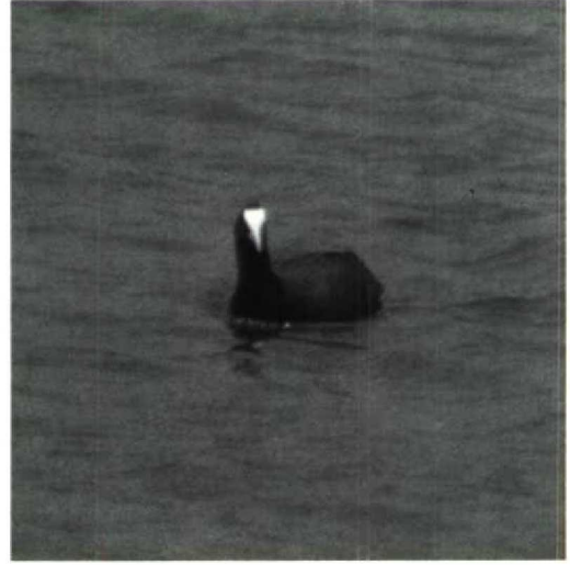
123 Crested Coot Fulica cristata , Spain, 11 May 1990. Note shape of shield and 'firm' connection of shield and bill

curving up to the crown during the breeding season.