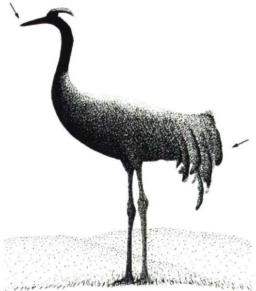
FIGURE 3 Crane Grus grus . Against light, bird may look confusingly pale above and dark on breast. Note loose, 'untidy' tertials and long bill ( Magnus Ullman )