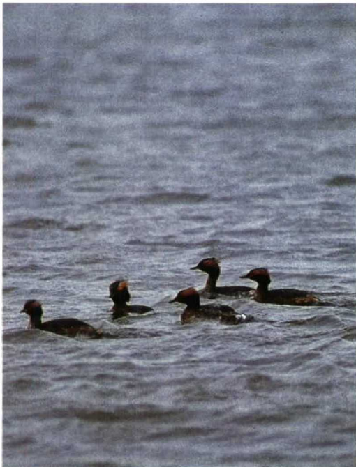
115 Kuifduikers Podiceps auritus , IJmuiden, Noordholland, april 1991

Aythya nyroca was op 29 maart en 14 april aanwezig in de buurt van Haaksbergen O. De Koningseider Somateria spectabilis van Hoek van Holland Zh hield daar weer audiëntie van 28 tot 31 maart en op 14 en 15 april. Een mannetje Brilzeeëend Melanitta perspicillata werd geclaimd op 2 mijl ten noorden van Terschelling Fr op 22 april. In deze maanden werden 32 Zwarte Wouwen Milvus migrans en 56 Rode Wouwen M. milvus gemeld. De Zwarte Wouwen werden voornamelijk in april waargenomen. Een Zeearend Haliaeetus albicilla werd op 20 maart gemeld te Veenhoop Fr. Een exemplaar zat op 29 maart en 1 april op de Dintelse Gorzen Nb. Vanaf 12 april trokken de eerste Grauwe Kiekendieven Circus pygargus alweer het land in. Vier exemplaren werden gezien. Een Steenarend Aquila chrysaetos werd geclaimd in Velp Gld op 11 maart. Al op 14 maart vloog een Visarend Pandion haliaetus over Rotterdam. Vanaf 24 maart werden c 30 exemplaren gezien waarvan sommigen enkele dagen op een plek verbleven. Roodpootvalken Falco vespertinus vlogen voorbij de Knardijk Fl op 11 april, over Groningen Gr op 14 april, langs Breskens op 25 april (twee) en over Lexkesveer bij Wageningen Gld op 27 april. Tot begin april waren op diverse lokaties nog c 20 Slechtvalken F. peregrinus aanwezig. Een doortrekker vloog op 28 april over de Ooijpolder Gld.