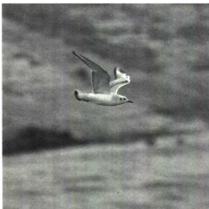
84 Kleine Kokmeeuw Larus philadelphia , Rithem, Zeeland, februari 1990 (Paul van Tuil)

Merkwaardige waarnemingen bereikten ons met betrekking tot de Koekoek Cuculus canorus ; bij Schalkhaar O op 31 januari, bij