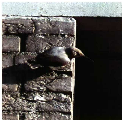
40-41 Rotskruiper Tichodroma muraria , Amsterdam-Buitenveldert, Noordholland, november 1989 (René Pop)