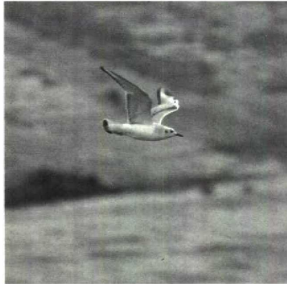
84 Kleine Kokmeeuw Larus philadelphia , Rithem, Zeeland, februari 1990 (Paul van Tuil)

Merkwaardige waarnemingen bereikten ons met betrekking tot de Koekoek Cuculus canorus ; bij Schalkhaar O op 31 januari, bij