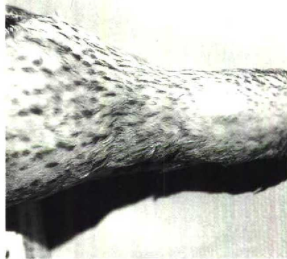
48 Calidris cooperi , moulting from winter to summer plumage, collected at Raynor South, Long Island, New York, USA, 24 May 1833

it was recognized as a possible hybrid but, if not, a chance existed that both could represent an undescribed species. They were also noted to have some features reminiscent of C cooperi and therefore were sent to the USNM for comparison with the unique holotype of C cooperi . However, the latter was found to differ from them by having a shorter and broader bill, a longer wing, a pattern of dark spots on a white background ventrally, white shafts on the primaries and whitish or buff edges to the tertials (R L Zusi in litt). As in C melanotos , the two Australian specimens have the streaked upperbreast demarcated from the white lower ventral area, rusty fringes to the tertials, and the upper surfaces of the primary-shafts are brownish except the 10th (outer) of which the shaft is white.