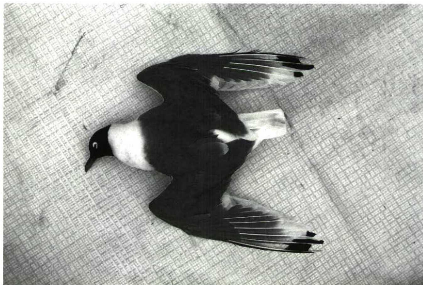
54 Franklins Meeuw Larus pipixcan , Friesland, juni 1988

GEDRAG In vergelijking met Kokmeeuw hogere vleugelslagfrequentie. Vlucht enigszins 'peddelend' (als bij Dwergmeeuw en Drieteenmeeuw Rissa tridactyla ). Met duidelijk gespreide poten op grond staand. Met ingetrokken hals en enigszins onvaste gang lopend. Herhaaldelijk koeien tot op enkele meters benaderend.