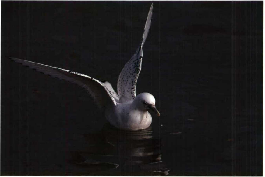
82-83 Ivoormeeuw Pagophila eburnea , Stellendam, Zuidholland, februari 1990 (Arnoud B van den Berg, René Pop)