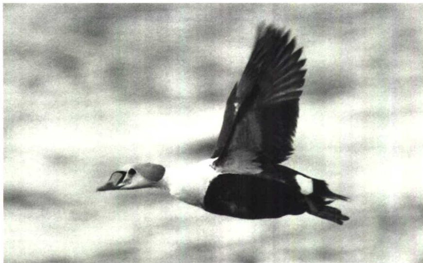
89 Koningseider Somateria spectabilis , Harlingen, Friesland, april 1990 90 Steppekievit Chettusia gregaria , IJsselstein, Utrecht, april 1990