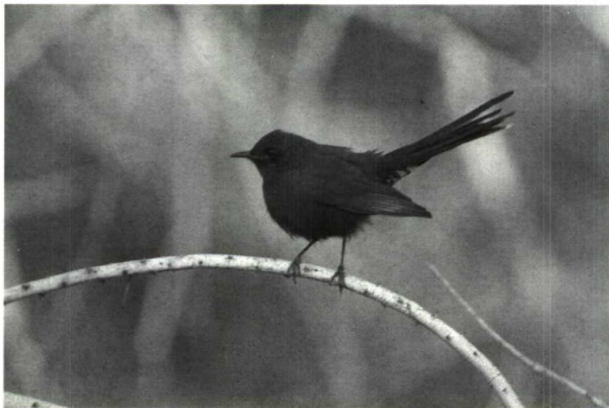
76 Black Bush Robin Cercotrichas podobe , Yotvata, Israel, April 1990 (David Cottridge)

World 3: 91-93, 1990). A very confiding first-winter Ivory Gull Pagophila eburnea attracted many birders to Stellendam, Zuidholland, during 9-19 February, being only the second record of this arctic species for the Netherlands. For the sixth winter in succession, an Oriental Turtle Dove Streptopelia orientalis remained at Mörbylånga, Öland, Sweden. In February-April, there was a remarkable influx of Great Spotted Cuckoos Clamator glandarius in Britain, with individuals in Cheshire (18 March), Devon (23 February and 20-29 March), Kent (25 March) and Sussex (4-30 April). A Scops Owl Otus scops found on a boat 3 km south of Portland, Dorset, Britain, on 20 March was transferred to Portland Bird Observatory, where it was released the same evening. It flew off, never to be seen again. The first Snowy Owl Nyctea scandiaca for the Netherlands since the winter of 1980/81 was photographed and seen by only a few birders at Lage Zwaluwe, Noordbrabant, on 2 March. About 15 Hawk Owls Surnia ulula were observed in Denmark last winter. A Needle-tailed Swift Hi-