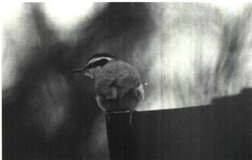
77 Red-breasted Nuthatch Sitta canadensis , Holkham Pines, Norfolk, Britain, February 1990

rundapus caudacutus at Skaftung on 21 April was the second for Finland; the first was in May 1933. The Grey Hypocolius Hypocolius ampelinus stayed at Eilat, Israel, until at least 2 January. At Yotvata, also in Israel, a Black Bush Robin Cercotrichas podobe was present from 2 until at least 21 April. A first-summer male Desert Wheatear Oenanthe deserti at Carnsore Point, Wexford, from 11 to 21 March formed the first record for Ireland. From 3 February to 9 March, Chingford, Greater London, was the residence of Britain's first Naumann's Thrush Turdus naumanni naumanni (for more information on this exciting bird, probably a first-winter male, see Birding World 3: 50-53, 1990). A male Sardinian Warbler Sylvia melanocephala at Stratton, near Bude, Cornwall, from 8 to 22 March was the first in Britain to be twitchable since those in Norfolk and Scilly in 1980. The Red-breasted Nuthatch Sitta canadensis at Holkham Pines, Norfolk, Britain, was still present in April. Between 11 and 19