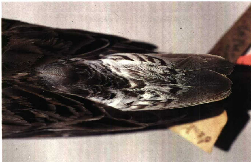
49 Calidris cooperi , moulting from winter to summer plumage, collected at Raynor South, Long Island, New York, USA, 24 May 1833 (courtesy of R L Zusi, USNM). Note that some uppertail-coverts are missing, in particular some from centre 50 Calidris cooperi , moulting from winter to summer plumage, collected at Raynor South, Long Island, New York, USA, 24 May 1833 (courtesy of R L Zusi, USNM)