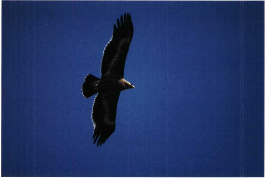
59-60 Steppe Eagle Aquila nipalensis , first-winter, Sekinchan, Selangor, Peninsular Malaysia, 19-20 February 1987 (Andreas J Helbig)