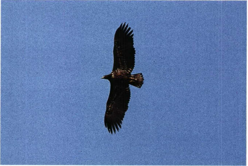
72 White-tailed Eagle Haliaeetus albicilla , Brabantse Biesbosch, Noordbrabant, Netherlands, January 1990 (René Pop) 73 Caspian Plover Charadrius asiaticus , Eilat, Israel, March 1990 (René Pop)