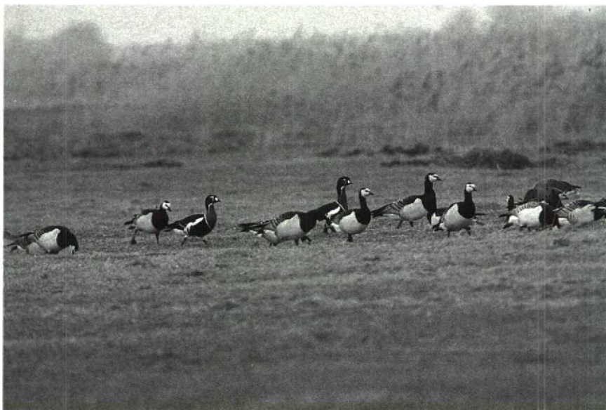
80 Roodhalsganzen Branta ruficollis en Brandganzen B leucopsis , Anjum, Friesland, februari 1990

denswaardig is het geval van een ongeringd adult tussen Rietganzen Anser fabalis bij Maaseik BL van 20 januari tot 10 februari. Bij het Jaap Deensgat Gr zaten nog twee exemplaren van 17 tot 19 maart. De vijf adulte Sneeuwganzen A caerulescens werden op 14 en 15 januari nog in de Noordoostpolder gezien. Op 18 februari zaten er vijf bij Rijs Fr. Een à twee Ross' Ganzen A rossii werden, soms in gezelschap van een Sneeuwganzen, tot eind maart afwisselend gezien bij Stad aan 't Haringvliet en De Plaat van Scheelhoek bij Stellendam. Er werden nog zo'n acht andere Sneeuwganzen gemeld waaronder exemplaren van de blauwe vorm in de zuidelijke Lauwersmeer Gr op 4 maart en bij Kornwerd Fr op 30 maart. Een Canadese Gans Branta canadensis met kenmerken van één van de kleinere ondersoorten zat in februari en maart in de ganzengroep die van Stad aan 't Haringvliet naar De Plaat van Scheelhoek pendelde. Witbuikrotganzen B bernicla hrota werden slechts gezien bij Goedereede Zh op 4 januari, bij de Koudekerkse Inlagen op