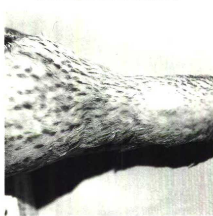
48 Calidris cooperi , moulting from winter to summer plumage, collected at Raynor South, Long Island, New York, USA, 24 May 1833

it was recognized as a possible hybrid but, if not, a chance existed that both could represent an undescribed species. They were also noted to have some features reminiscent of C cooperi and therefore were sent to the USNM for comparison with the unique holotype of C cooperi . However, the latter was found to differ from them by having a shorter and broader bill, a longer wing, a pattern of dark spots on a white background ventrally, white shafts on the primaries and whitish or buff edges to the tertials (R L Zusi in litt). As in C melanotos , the two Australian specimens have the streaked upperbreast demarcated from the white lower ventral area, rusty fringes to the tertials, and the upper surfaces of the primary-shafts are brownish except the 10th (outer) of which the shaft is white.