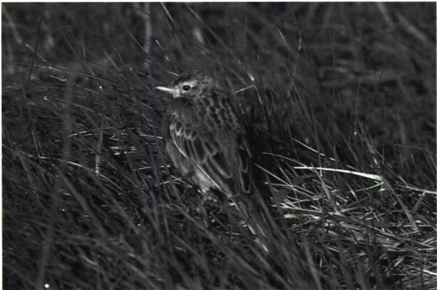
58 Grote Pieper Anthus richardi , Breskens, Zeeland, april 1988 (Paul Knolle)

ruï en leeftijd Adulte Grote Piepers ruïen volledig in het najaar; deze ruï vindt plaats in de periode van juli tot november, en wordt soms onderbroken en in de winterkwartieren voortgezet. In maart en april ondergaan adulte vogels een onvolledige ruï, waarbij een variabel deel van de lichaamsveren, kleine en (meestal) middelste vleugeldekveren, en meestal de middelste staartpennen vervangen worden. Juveniele vogels ruïen naar het eerste winterkleed in de periode augustus-september, maar de ruï wordt ook hier soms onderbroken en in het winterkwartier afgemaakt; deze ruï omvat lichaamsveren, vleugeldekveren (behalve de buitenste grote dekveren), enige tertials (soms alle) en de middelste (soms meer) staartpennen. De ruï van eerste winter- naar eerste zomerkleed is variabel, soms als adult, soms bijna volledig onderdrukt, waarbij zelfs oude veren uit het juveniele kleed niet geruid worden (Cramp 1988). De Grote Pieper van Breskens vertoonde nog kenmerken van het ju-