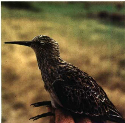
52 Calidris resembling C cooperi , adult winter plumage, Stockton, New South Wales, Australia, 21 March 1981 (S G Lane)

skinned, whereafter its size depends upon the skills of the preparator. Indeed, the holotype of C cooperi exhibits the long body, slender neck and bulged crop so commonly found in specimens of the last century. It was collected in 1833 and Baird, who lived from 1823 to 1887 (Mearns & Mearns 1988), could not have measured it before it was skinned. Its true size in life will never be known but can be judged by other repeatable measurements.