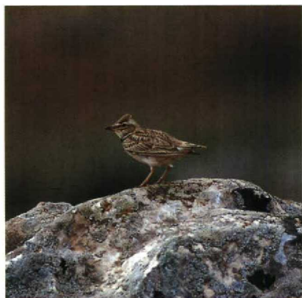
61 Calandra Lark Melanocorypha calandra calandra , Turkey, April 1986 (Magnus Ullman)