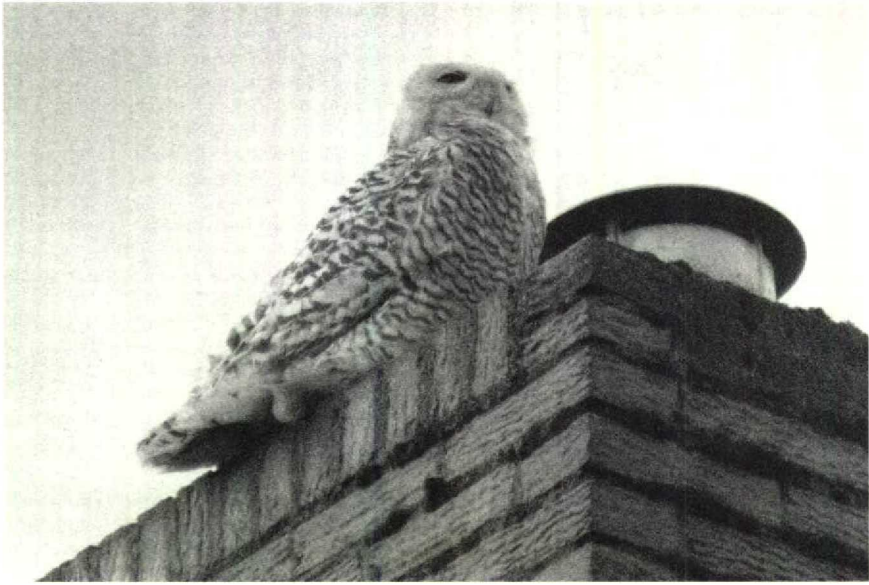
87 Sneeuwuil Nyctea scandiaca , Lage Zwaluwe, Noordbrabant, maart 1990 88 Dwerggors Emberiza pusilla , Katwijk, Zuidholland, april 1990