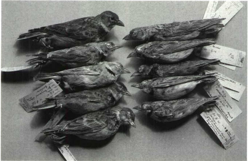
65 Skins of Calandra Lark Melanocorypha calandra calandra (left: upper three, males; lower two, females) and Bimaculated Lark Melanocorypha bimaculata torquata (right: upper four, males; lower one, female), Universitetets Zoologiske Museum, København, Denmark (Magnus Ullman)