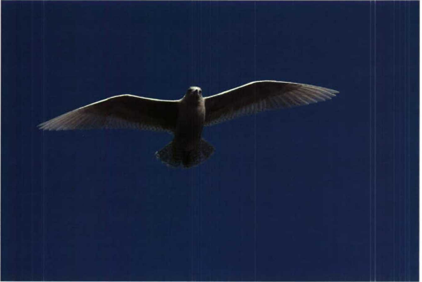
85 Kleine Burgemeester Larus glaucooides , IJmuiden, Noordholland, januari 1990 ( Hans Gebuis ) 86 Pestvogel Bombycilla garrulus , Almere, Flevoland, februari 1990 ( Edwin Russer )