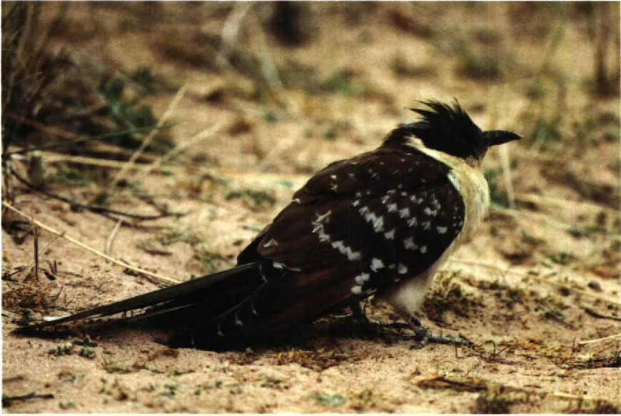
74 Great Spotted Cuckoo Clamator glandarius , Dawlish Warren, Devon, Britain, March 1990 75 Naumann's Thrush Turdus naumanni naumanni , Chingford, Greater London, Britain, January 1990