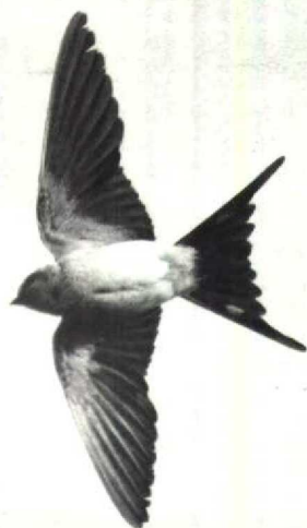
57 Red-rumped Swallow Hirundo daurica , Texel, Noordholland, October 1989 ( Hans Gebuis )

Witherby et al (1938) simply mention that the outer pair of rectrices sometimes have a grey mark on the inner web. At the Rijksmuseum van Natuurlijke Historie at Leiden, Zuidholland, I found three out of 15 specimens, belonging to three different subspecies, H d daurica (from June), H d melanocrissa and H d nipalensis , which showed similar whitish patches on the outer pair of rectrices, confirming that this feature occurs regularly in this species.