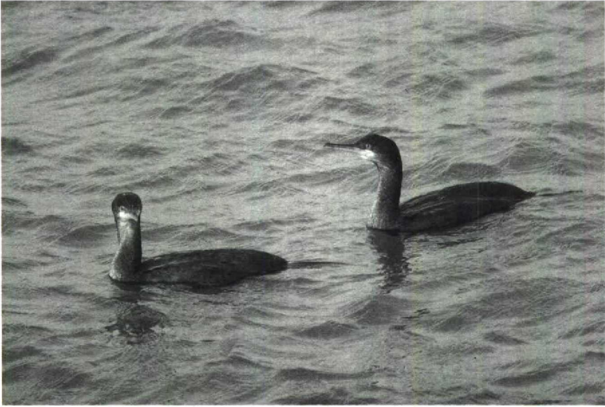
78 Kuifaalscholwers Phalacrocorax aristotelis , IJmuiden, Noordholland, februari 1990 79 Dwergganzen Anser erythropus , Strijen, Zuidholland, februari 1990