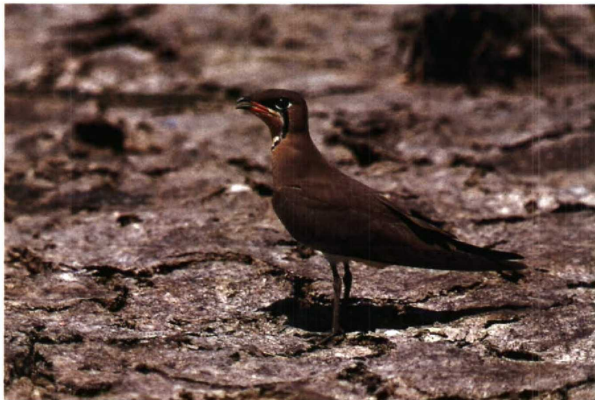
68 Oriental Pratincole Glareola maldivarum , Khao Sam Roi Yot NP, Thailand, April 1989

Mystery photograph 36. Solution in next issue.