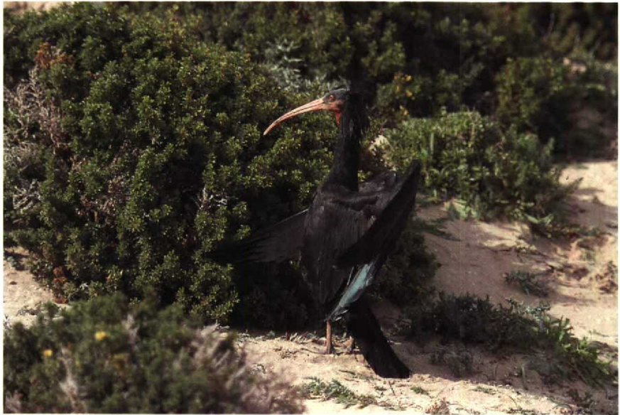
14 Bald Ibis Geronticus eremita , Tamri, Morocco, January 1990