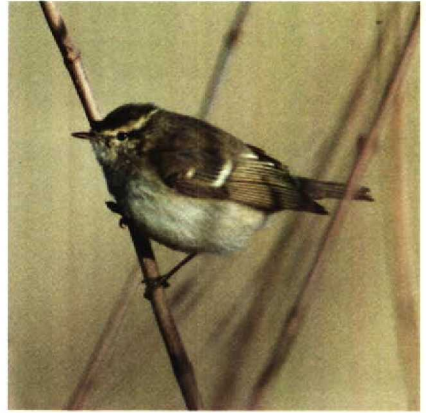
26 Hume's Warbler Phylloscopus humei , New Biggin, Northumberland, Britain, November 1989 (A S Butler)