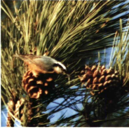
25 Red-breasted Nuthatch Sitta canadensis , Holkham Pines, Norfolk, Britain, October 1989 (David Cottridge)