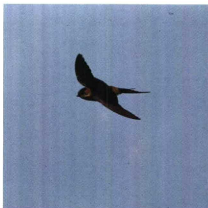
37-38 Roodstuitzwaluw Hirundo daurica , Texel, Noordholland, oktober 1989

Kortteenleeuwerik Galandrella brachydactyla zuidwaarts. Begin december werden er nog Boerenzwaluwen Hirundo rustica waargenomen bij Bergen Nh, Terneuzen en Bleiswijk Zh. Dé 'inhaalsoort' van dit najaar kwam in veelvoud, in de gestalte van vijf Roodstuitzwaluwen H daurica , die van 27 oktober tot 1 november te zien waren op Texel. Op 2 november vloog er één langs Katwijk. In oktober werden nog enkele Duinpiepers Anthus campestris en c 20 Grote Piepers A richardi waargenomen. Late Grote Piepers waren op 14 november bij Marken Nh en op 18 november bij Zoutkamp Gr. Roodkeelpiepers A cervinus werden waargenomen op 4 oktober bij Valkenisse Z en op Terschelling, op 12 oktober bij 's Gravenhage Zh, op 15 oktober bij Camperduin, op 17 oktober bij Moeskroen Hg en de HW-duinen en op 18 oktober bij Deventer. Pestvogels Bombycilla garrulus werden slechts gemeld op 25 december in Groningen Gr (drie) en op 29 december bij Rhenen U. Siberische Roodborsttapuiten Saxicola torquata maura werden opgemerkt op 25 oktober op Texel en 13 november in de HW-duinen. Op Texel zou op 9 oktober een Rode Rotslijster Monticola saxatilis zijn gezien. Bij Harchies waren in oktober en november drie zangposten van Cetti's Zanger Cettia