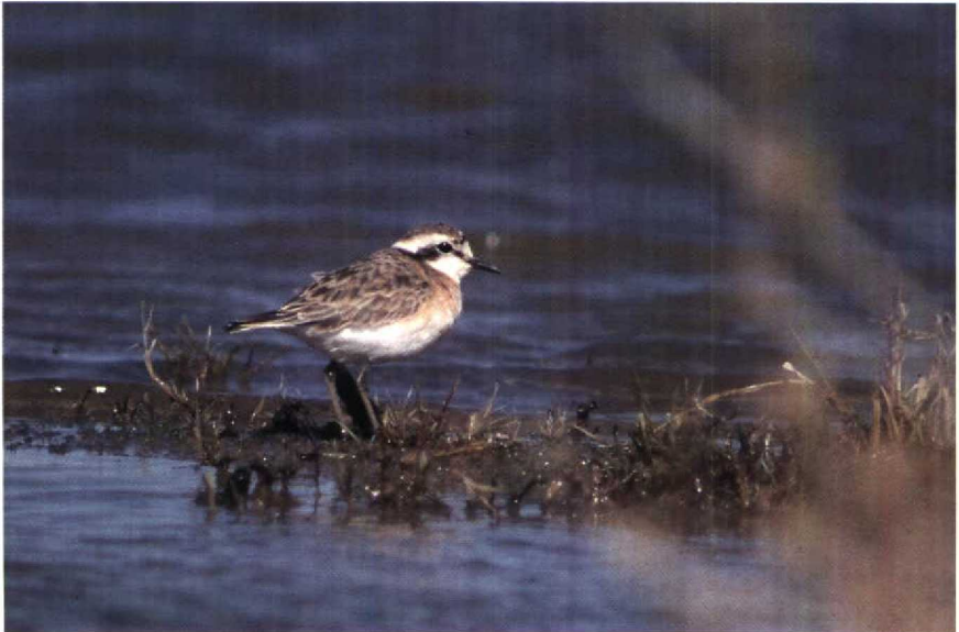
27 Kittlitz's Plover Charadrius pecuarius , Merzouga, Morocco, January 1990 (Arnold Meijer)