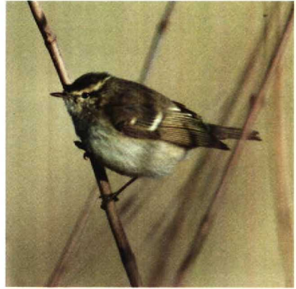
26 Hume's Warbler Phylloscopus humei , New Biggin, Northumberland, Britain, November 1989