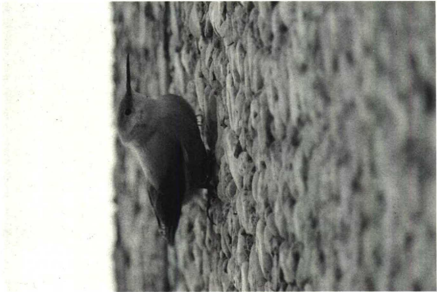
42 Rotskruiper Tichodroma muraria , Amsterdam-Buitenveldert, Noordholland, november 1989 (Arnoud B van den Berg)

werd gehoord op 19 oktober bij Zeebrugge. Er waren twee vangsten van Raddes Boszangers P. schwarzi bij Het Zwin op 6 en 10 oktober, hetgeen, samen met nog een vangst in het binnenland, het aantal Belgische gevallen op vijf bracht. Op 16 oktober werd op Texel een Bruine Boszanger P. fuscatus gemeld en op 25 en 28 (vangst) oktober één op de Maasvlakte, waar zich ook nog een Raddes Boszanger bevond. Tussen 15 oktober en 14 november werden 12 Siberische Tjiftjaffen P. collybita tristis opgemerkt waaronder een zingend exemplaar op Texel. Daarnaast waren er vangsten op 4 november bij Castricum en op 12, 14 en 15 november in de AW-duinen en een laat exemplaar op 3 en 25 december bij Harchies. Meldingen van Kleine Vliegenvangers Ficedula parva waren op twee handen te tellen; bij Heist op 2 oktober, op Terschelling op 4 en 5 oktober, bij Zeebrugge op 4 en 5 oktober (maximaal vier), op het Kornwerderzand op 8 oktober en op Schiermonnikoog op 17 oktober (vangst). Vanuit Nederland werd er met veel verbazing