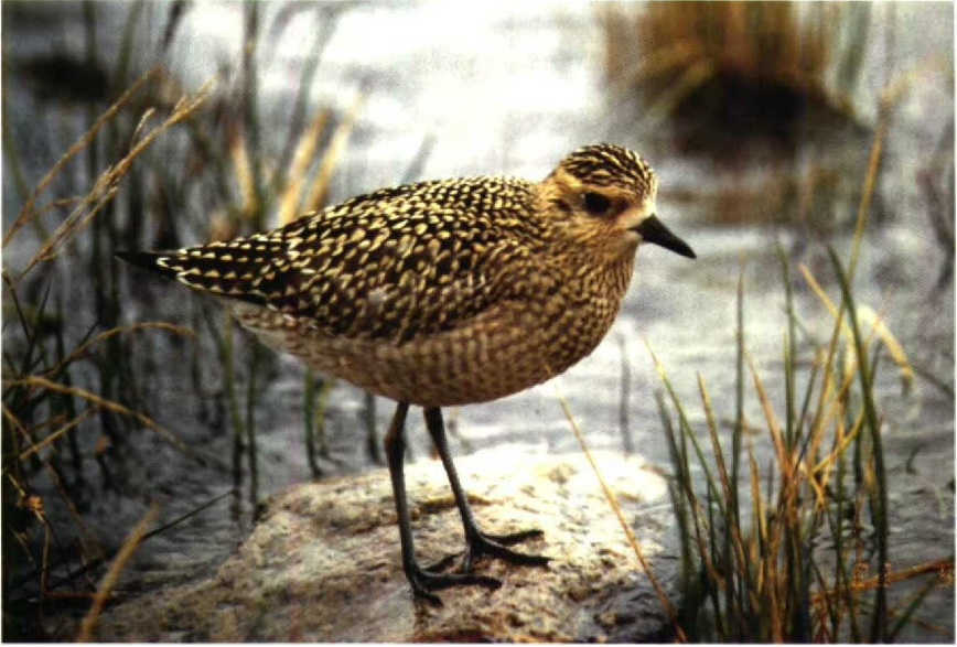
180 Pacific Golden Plover Pluvialis fulva , Finland, September 1990 (Jouni Riinimäki) 181 Spotted Sandpiper Actitis macularia , Rheindelta, Vorarlberg, Austria, October 1990 (Andreas J Helbig)