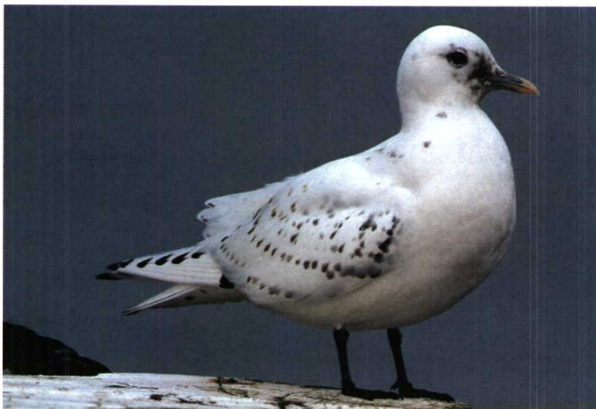
173 Ivoormeeuw Pagophila eburnea , Stellendam, Zuidholland, februari 1990

Het sneeuwwitte voorkomen, de opvallende zwarte stippellijnen op de bovenvleugels, de blauwgrijze snavel met gele punt, het groezelige gebied rond de snavelbasis en het donkere oog duiden op een eerste-winter Ivoormeeuw en sloten alle andere meeuwen uit. De zwarte poten sloten een leucistische meeuw uit (cf Harrison 1983, Grant 1986).